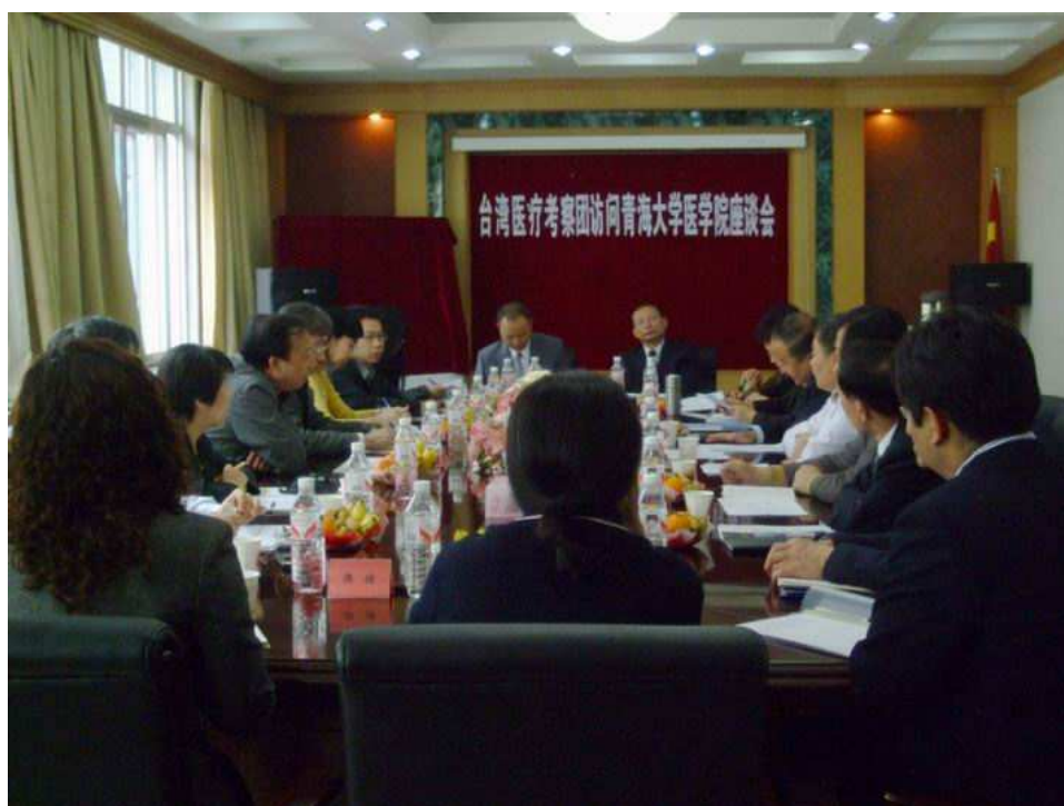
照片 10 與青海大學醫學院座談