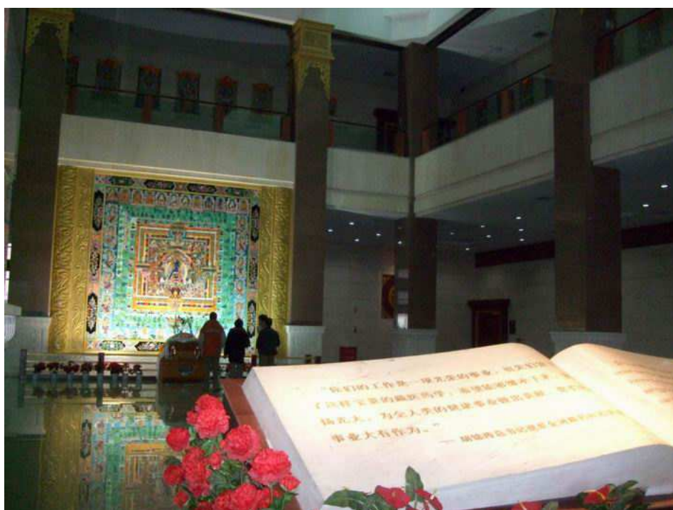
照片 16 參觀中國藏醫藥文化博物館