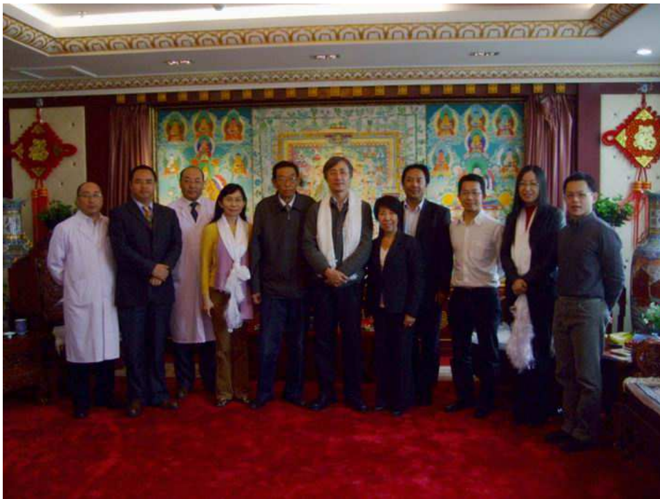
照片 4 與青海省藏醫院人員合影