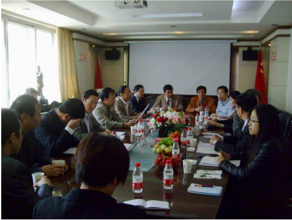
照片 7 與西寧市口腔醫院座談