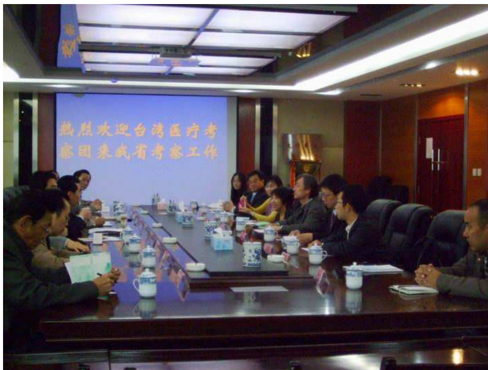
照片 1 與青海省衛生廳座談