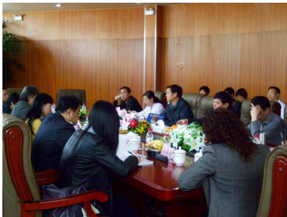
照片 12 與青海省疾病預防控制中心座談