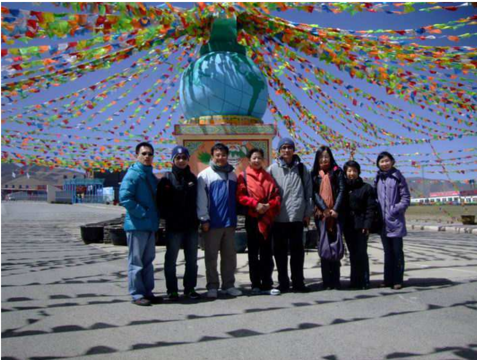
照片 14 參觀青海湖