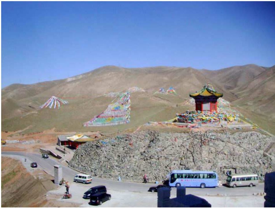
照片 13 日月山一隅