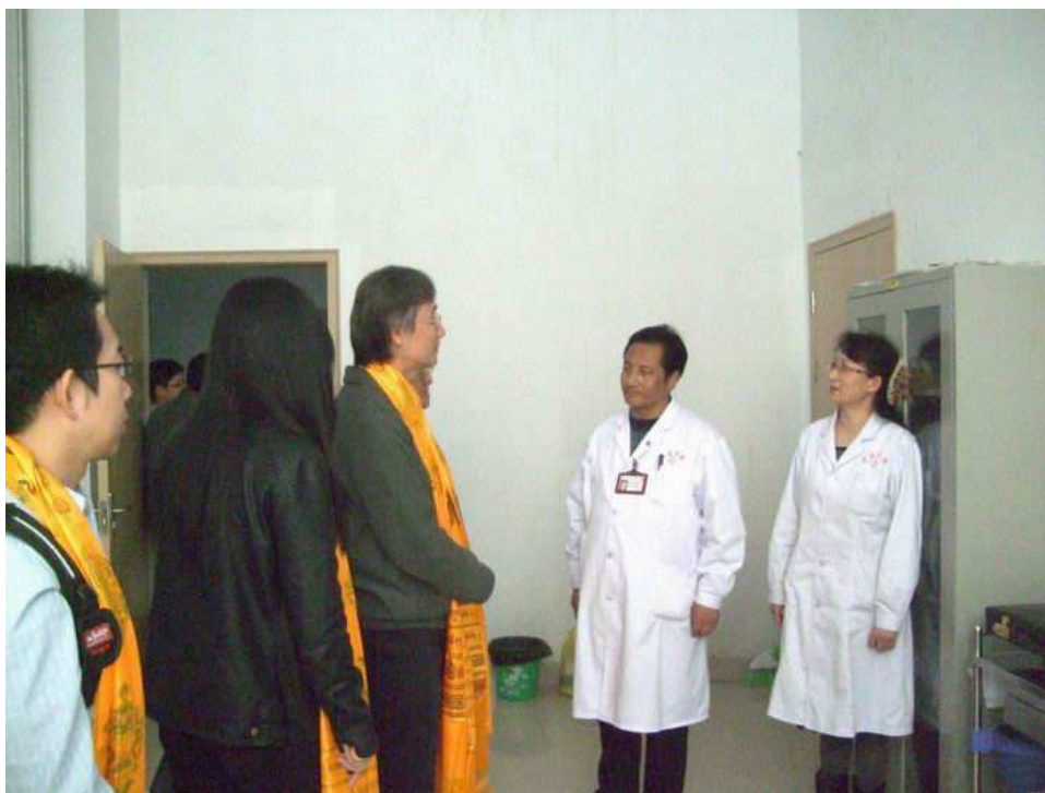
照片 9 參訪青海福利慈善醫院