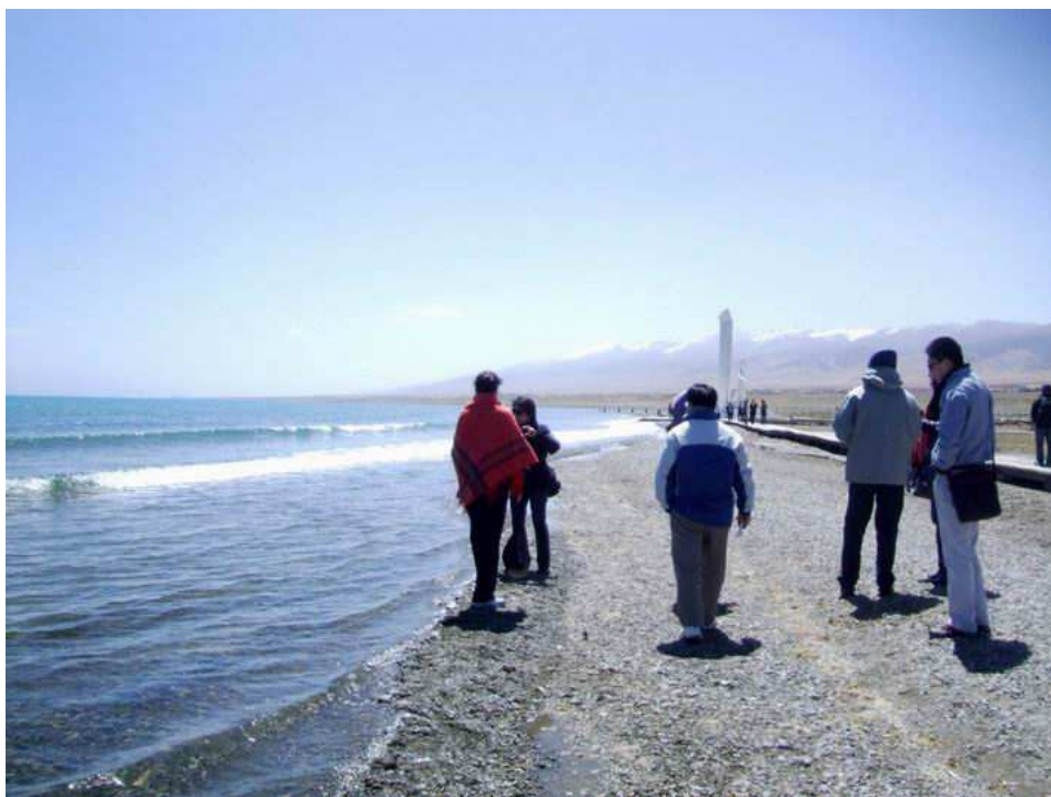
照片 15 青海湖一隅