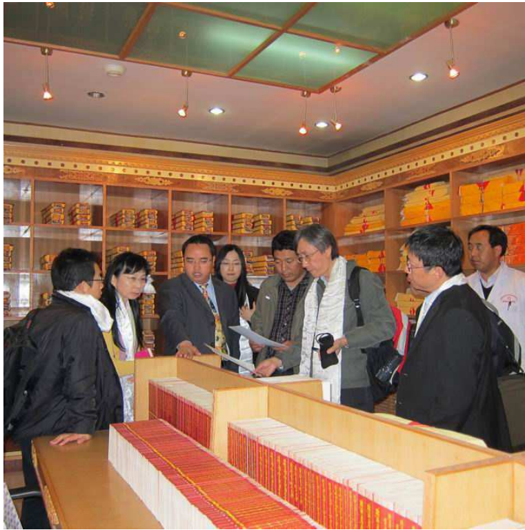
照片 3 參訪青海省藏醫院文獻室