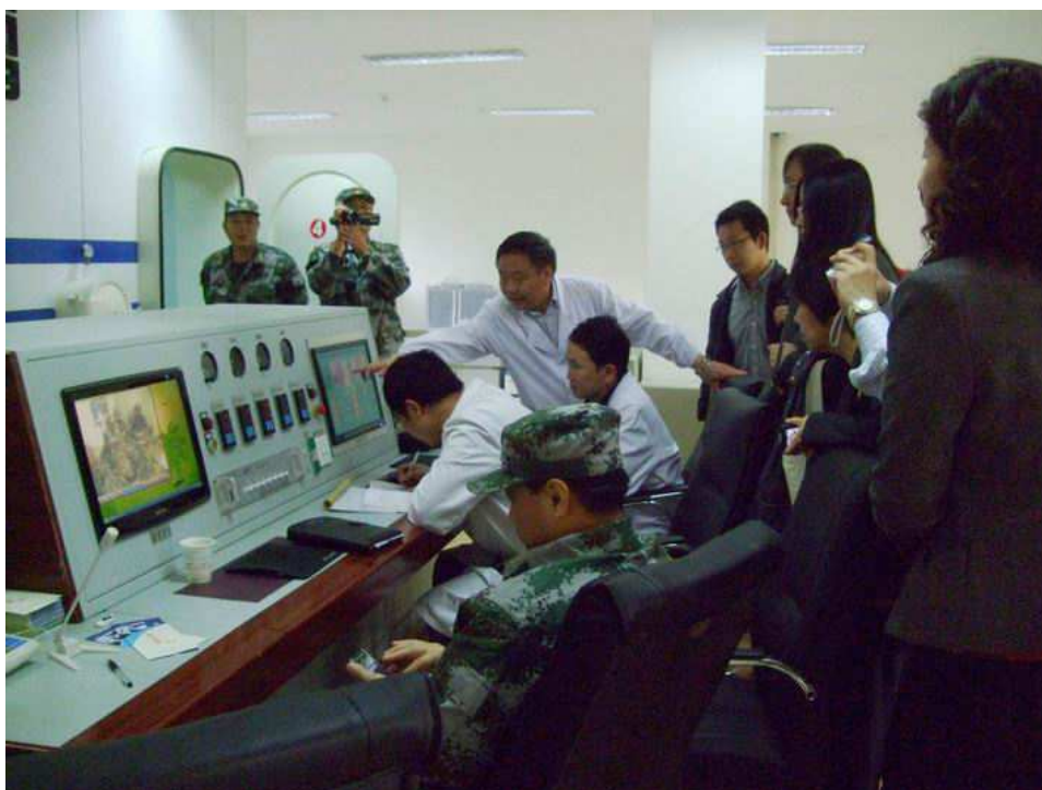
照片 11 參訪青海大學醫學院低壓氧艙室