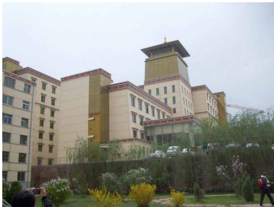
照片 2 青海省藏醫院外觀