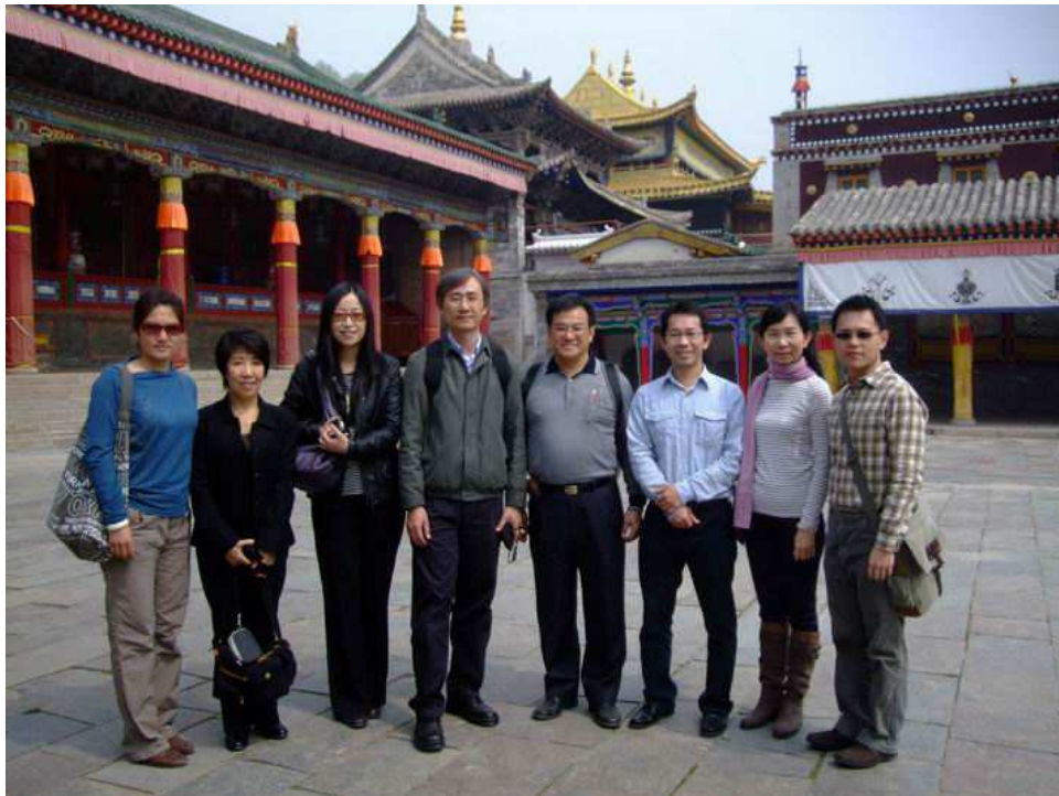
照片 8 參觀塔爾寺