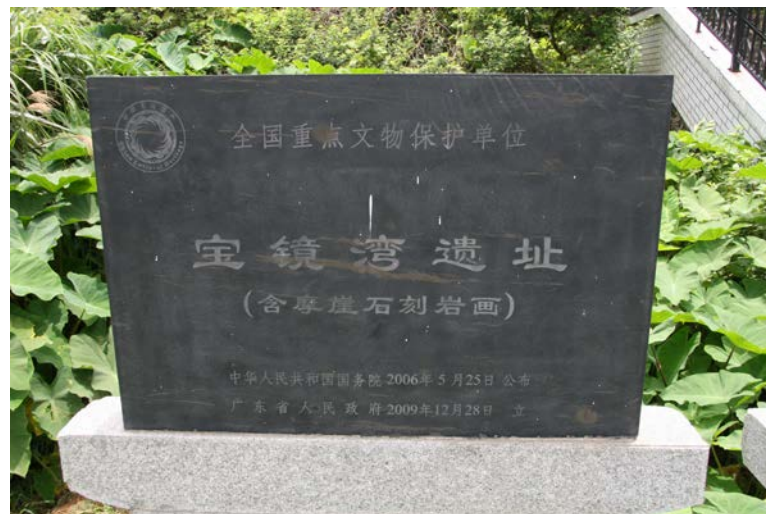
圖 6. 寶鏡灣遺址碑牌。

寶鏡灣遺址（圖 6）位於珠海市金灣區南水鎮高欄島西南部的寶鏡灣，包括遺址和岩畫（摩崖石刻畫）。屬於新石器時代晚期至青銅時代的文化遺存。寶鏡灣遺址面積 10000 餘平方米，是一處沙丘連山崗遺址。1997-2000 年，先後進行一次試掘和三次發掘，出土了大量石器生產工具、陶器生活用具及石圭、玉玦、水晶玦等裝飾品及禮器，並發現居住遺跡。