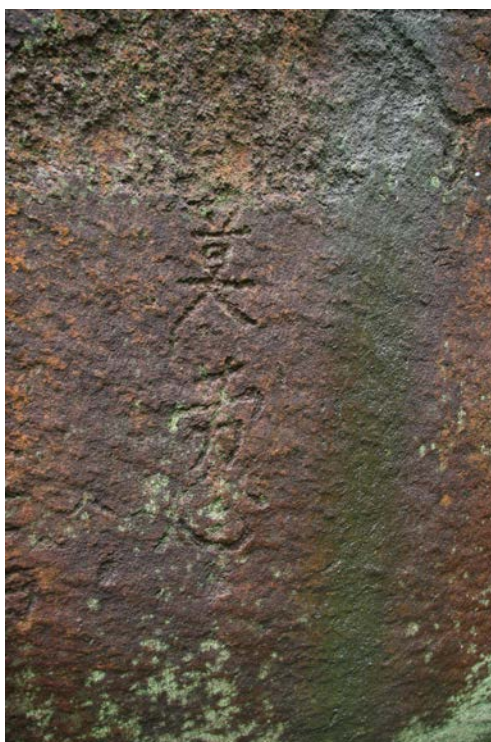
圖 7. 寶鏡灣遺址「藏寶洞」東壁下方所刻「莫勞心」疑為近世所刻。

除了遺址外，我們主要造訪的是「藏寶洞」岩畫，由珠海市博物館副館長進行解說。陳振忠副館長說道來此處探查遺址及岩畫時，先進行居民的訪談，得知有一個「藏寶洞」，這個地名的由來是因為清朝乾隆到嘉慶年間有一個叫張保仔的海盜，在此地劫富濟貧，傳說張保仔將財寶分為三份，“天一份、地一份、人一份”。天一份，資助當地貧民；地一份，挖地掩埋以應急需；人一份，犒賞有功將士。這個藏寶洞據說就是那個“地一份”埋藏寶藏的地點。甚至今寶鏡灣岩畫下還刻有「莫勞心」（圖 7）這樣的字眼。我們這群參訪者紛紛推測，到底是後人盡力挖掘後無所獲所留下的警語，還是這其實是表示「寶藏已被我取走了，所以不要再費心挖掘了」？引為趣談。