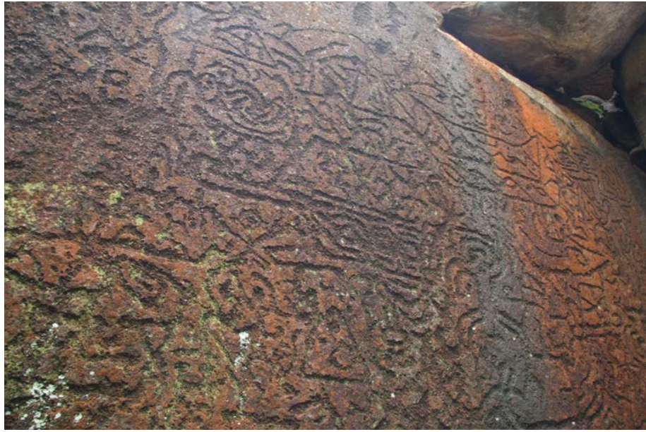
圖 8. 寶鏡灣遺址「藏寶洞」東壁的岩畫。

藏寶洞有東壁、西壁以及東壁岩畫左側各有一幅岩畫，共三幅。藏寶洞東壁岩畫(圖8)圖案密集而複雜，幾乎都是圍繞著海船而組成的一幅史前先民的生活圖景，有船、波浪及鹿、蛇等動物，有巫師，有先民居住的幹欄式房屋，畫面由十多組圖案組成。這是珠江口地區目前發現岩畫中保存得最完好、內容最豐富的一幅早期岩畫。