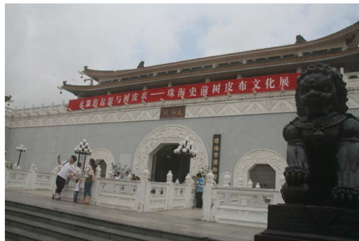
圖 4. 珠海市博物館—九洲城外觀。

九洲城改建為博物館後，以其優越的地理位置、古樸優雅的建築風格，成為極具特色的園林式博物館之一。本館藏品包括陶瓷器、青銅器、書畫、玉石器、竹木漆器、雕塑、璽印、錢幣、少數民族工藝品等 21 個門類，既有新石器時代晚期珠海先民的生活生產用具，又有中國近代史上赫赫有名的珠海歷史名人的文物資料。博物館下設保管部、研究室、陳列部、拓展部、保衛部、辦公室等 6 個部門，擁有研究生以上學歷的人員 4 人，中高級專業技術人員 13 人。