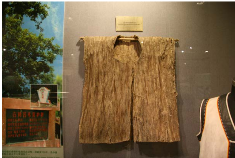
圖 1. 樹皮衣的樣貌。

樹皮衣服是人類衣服體系的重要分支，近年學術界發現，世界樹皮布文化極可能源自中國南方。在紡織衣服於當地尙未發展時，該地域的人類普遍以樹皮衣（圖 1）遮體，而在深圳咸頭嶺遺址，就發現迄今所知世界最早期的樹皮衣製作工具——石拍，證實已有六千六百年歷史。樹皮布技術更由海路推展至菲律賓、台灣，甚至遠達中美洲，較陸上的「絲綢之路」歷史還要久遠。