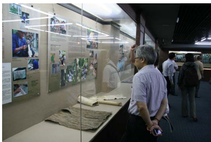
圖 5. 「衣服的起源與樹皮衣－珠海史前樹皮布文化」展場一隅。

展示中，一方面顯示了環珠江口樹皮衣服的傳統，對世界人類衣服起源重大的意義，同時也展示了香港中文大學中國考古藝術研究中心歷年樹皮布的收藏品。包括來源于臺灣、海南、雲南和非洲、斐濟、印尼、越南、菲律賓、泰國等地的樹皮衣相關藏品，許多是難得一見的珍貴標本。