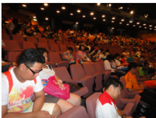
吉隆坡來台升學說明座談會