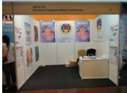
本會攤位佈置情形(吉隆坡)