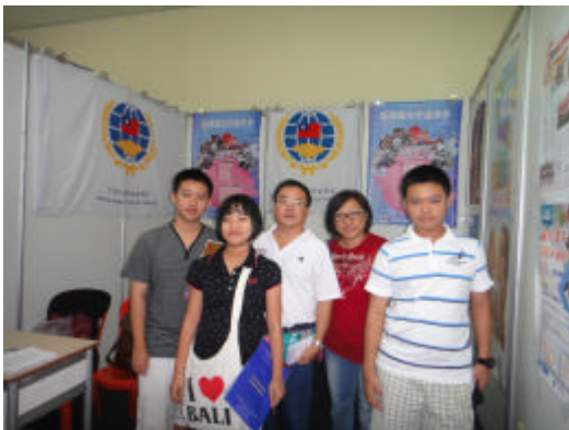
全家人一起參觀台灣高教展(怡保)