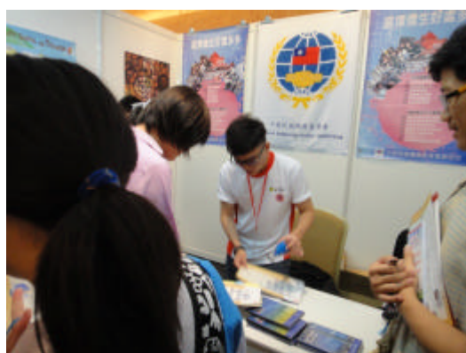
同學至本會攤位詢問及索取來台升學相關資訊