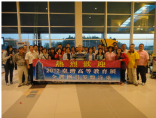
詩巫留台同學會熱烈歡迎台灣高教展 成員抵達詩巫