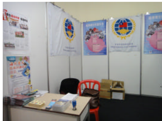
本會攤位佈置情形(怡保)