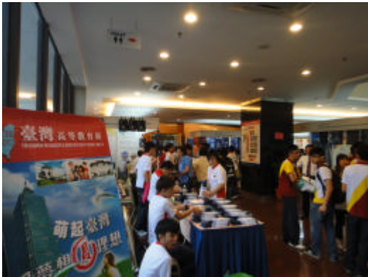
學生踴躍參加本次教育展