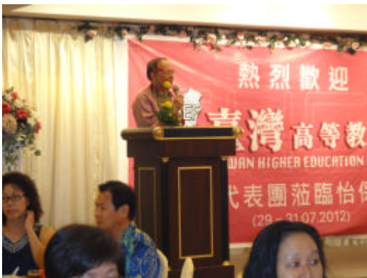
怡保留台同學會熱烈歡迎台灣高教展成員抵達怡保