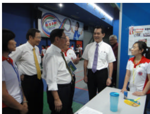
海外聯合招生委員會隨團榮譽顧問吳清基、教育部政次林聰明及留台聯總總會長李子松參觀本會攤位(詩巫)