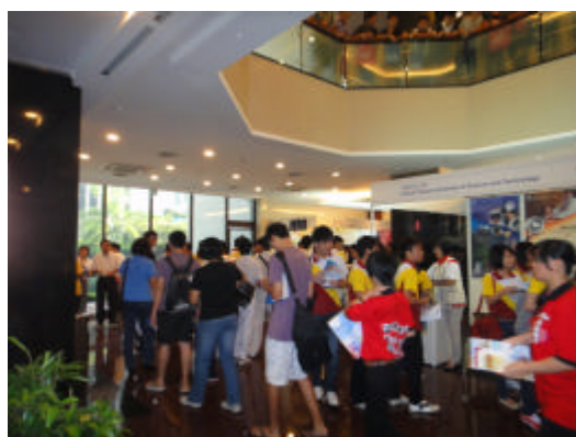
學生踴躍參加本次教育展