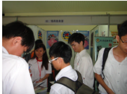
同學詢問及索取來台升學相關資訊(怡保)