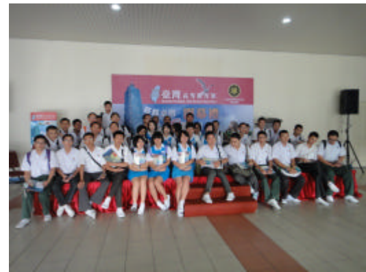
各校同學於怡保開幕典禮後留影