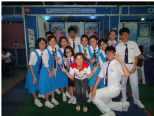
同學至本會攤位參觀並留影