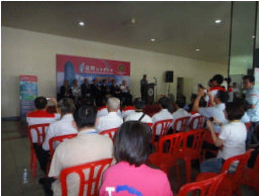
怡保教育展開幕典禮