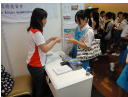
學生至本會攤位詢問及索取來台升學相關資訊