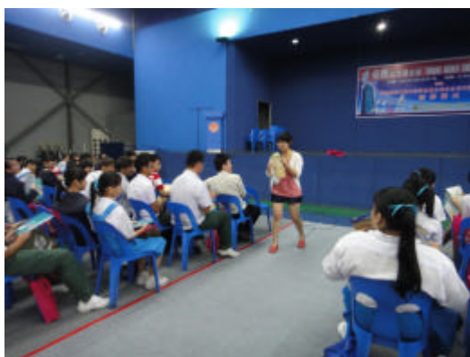
來台升學說明會及有獎徵答(詩巫)