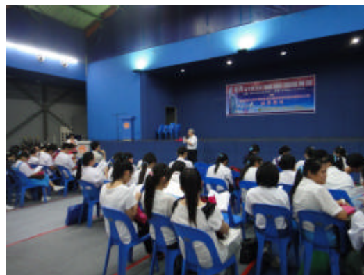
來台升學說明會(詩巫)