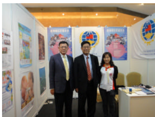
任副委員長參觀 2012 年馬來西亞高等教育展(吉隆坡)