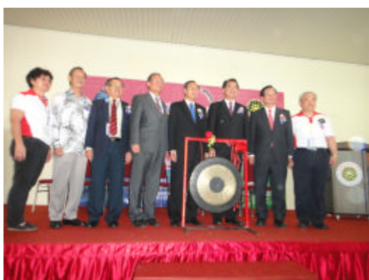
怡保開幕敲鑼儀式