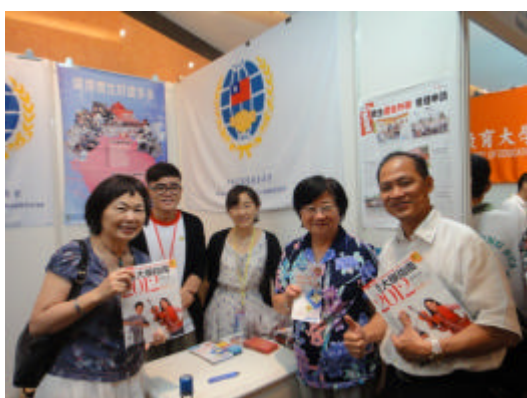
文化大學海青班主任及馬來西亞文化大學海青班校友會會長參觀本會攤位(吉隆坡)