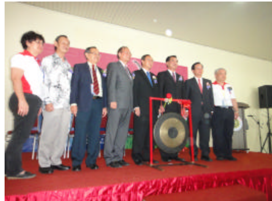
怡保教育展開幕典禮