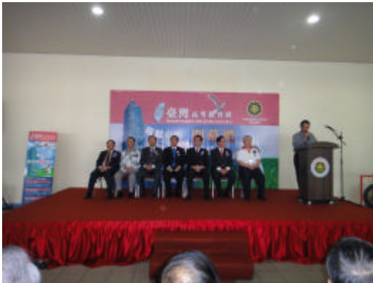
怡保教育展開幕典禮