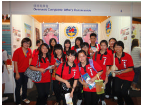
同學至本會攤位詢問及索取來台升學相關資訊