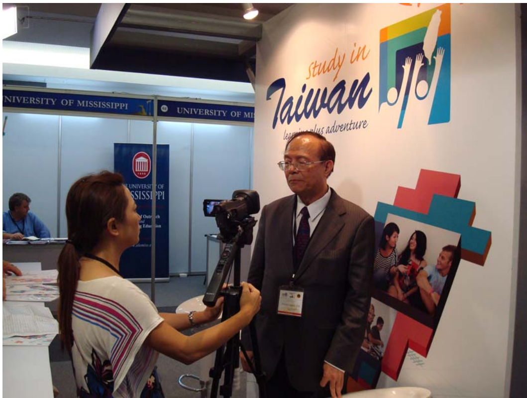
林政次接受中央通訊社現場採訪