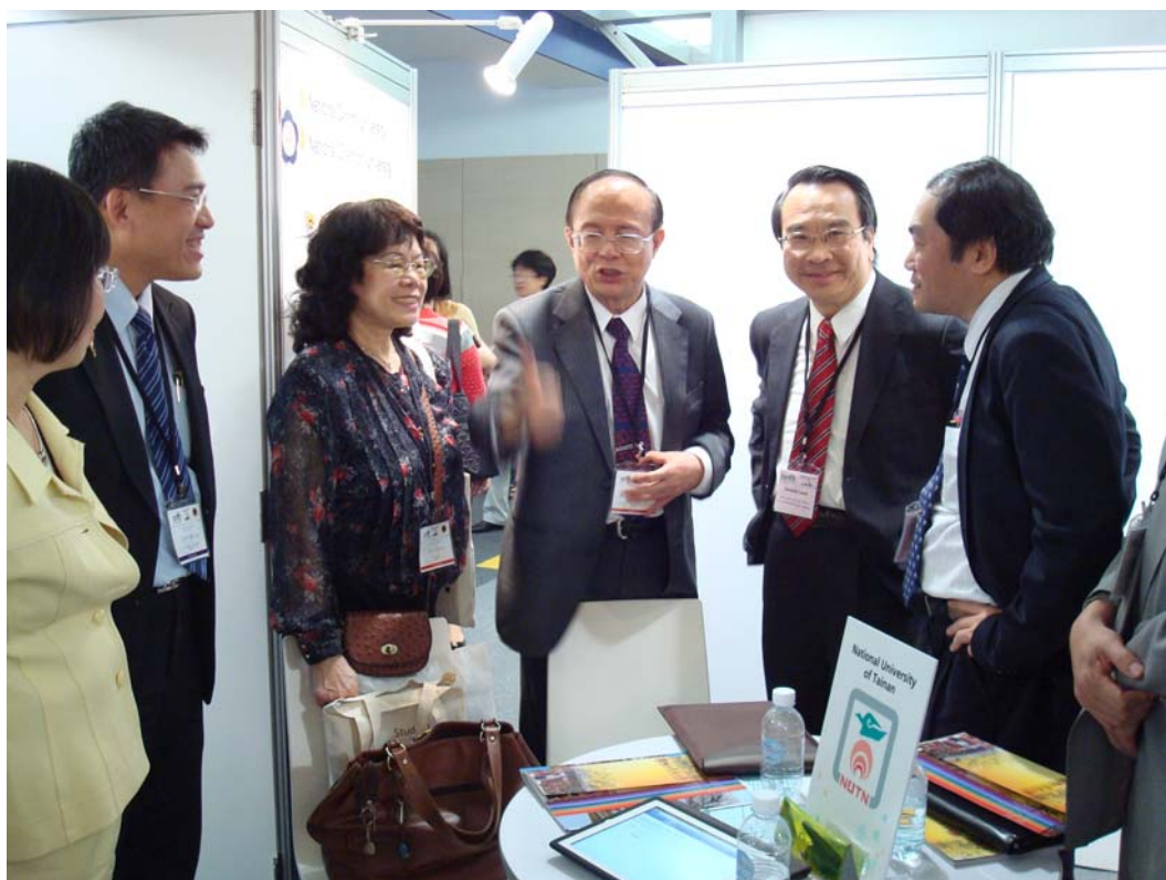
林政次訪視 APAIE 臺灣攤位