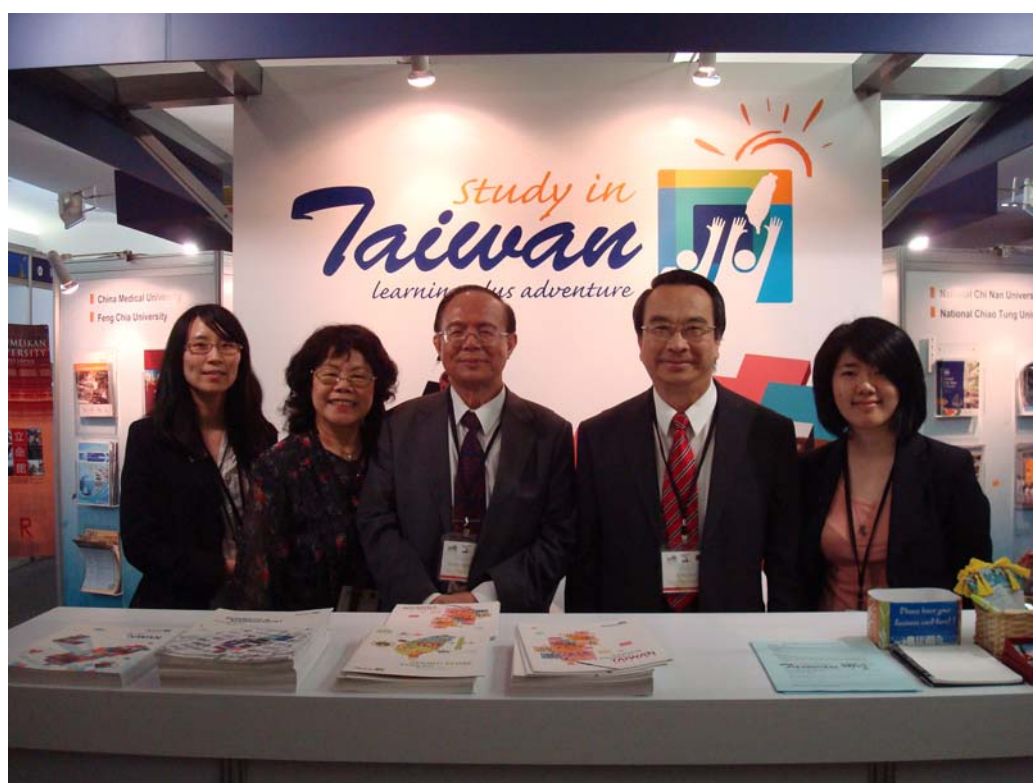
林政次訪視 APAIE 臺灣攤位-高教基金會