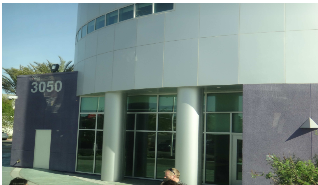
LASVEGAS PBS 電視台

Vegas PBS 原名 KLVX，建立於 1968 年。2006 年，KLVX 重新打造新品牌，並改名為 Vegas PBS。Vegas PBS 電視台位於 3050 E Flamingo Road Las Vegas, NV,89121。