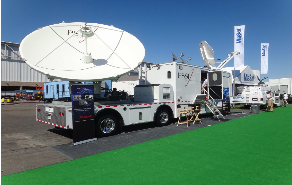
傳播媒體展中央館會場

NAB 傳播媒體展(NAB Show)的內容主要為展覽與研討會兩大主軸。參展廠商超過 1609 家，展出內容包括音響製品，遊戲設備，衛星系統，無線廣播設施，數位管理設備，行動電視和技術，電視，數位相機，郵政產品數位信號設備，網路電視，燈光燈具，節目製作設備，雷射音響設備，數位錄音錄相設備，多媒體電腦和軟體，通訊設備，行動電話，節目軟體，電信電纜，動畫製作，數位電視及照相裝備，各類廣播電台，電視發射裝備等，除舉辦傳播媒體器材展覽外，並針對產業相關議題舉行研討會。