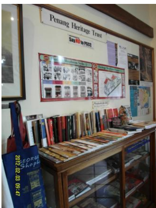
檳城遺產信託 PHT(101.2.3)