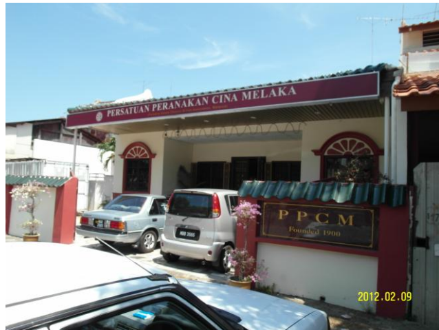
馬六甲峇峇公會(101.2.9 梁瑟晏攝)