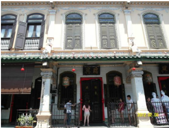
馬六甲峇峇娘惹私人博物館(101.2.8)