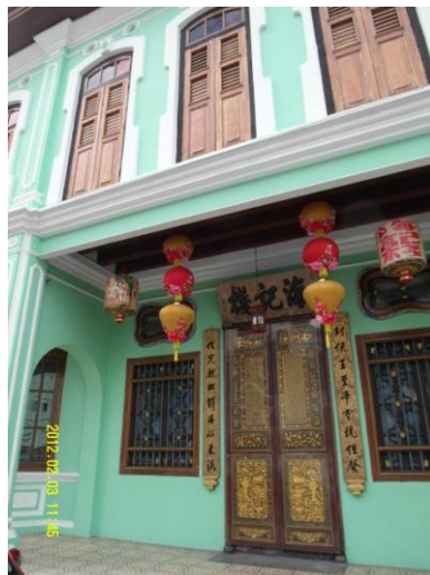
檳城私人僑生博物館(101.2.3)