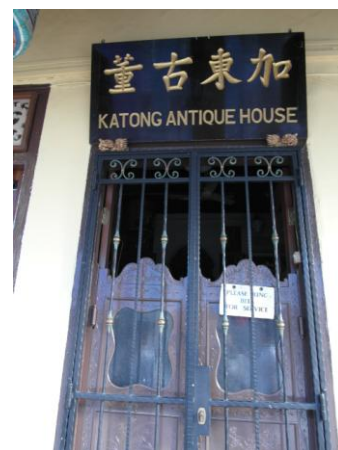
位東海岸路的加東古董(101.2.10)