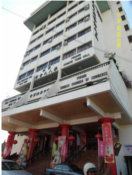
檳州華人大會堂(101.2.3 梁瑟晏攝)