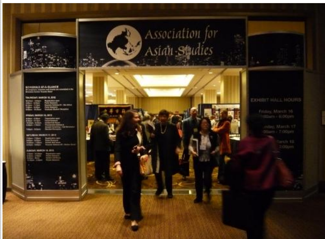
2012 年第 64 屆美國亞洲研究學會（AAS）年會書展入口。(101.03.16)