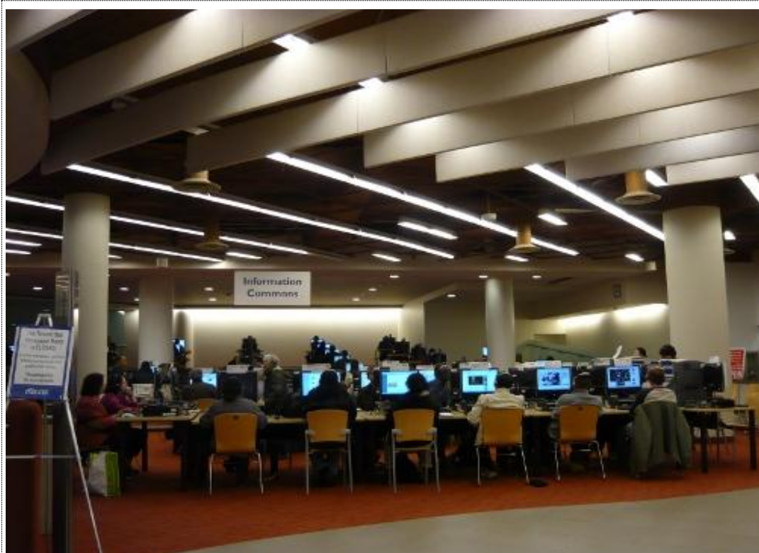
多倫多參考書圖書館(North York Central Library)是多倫多市最大的公立圖書館，位於多倫多市的中心位置。(101.03.17)