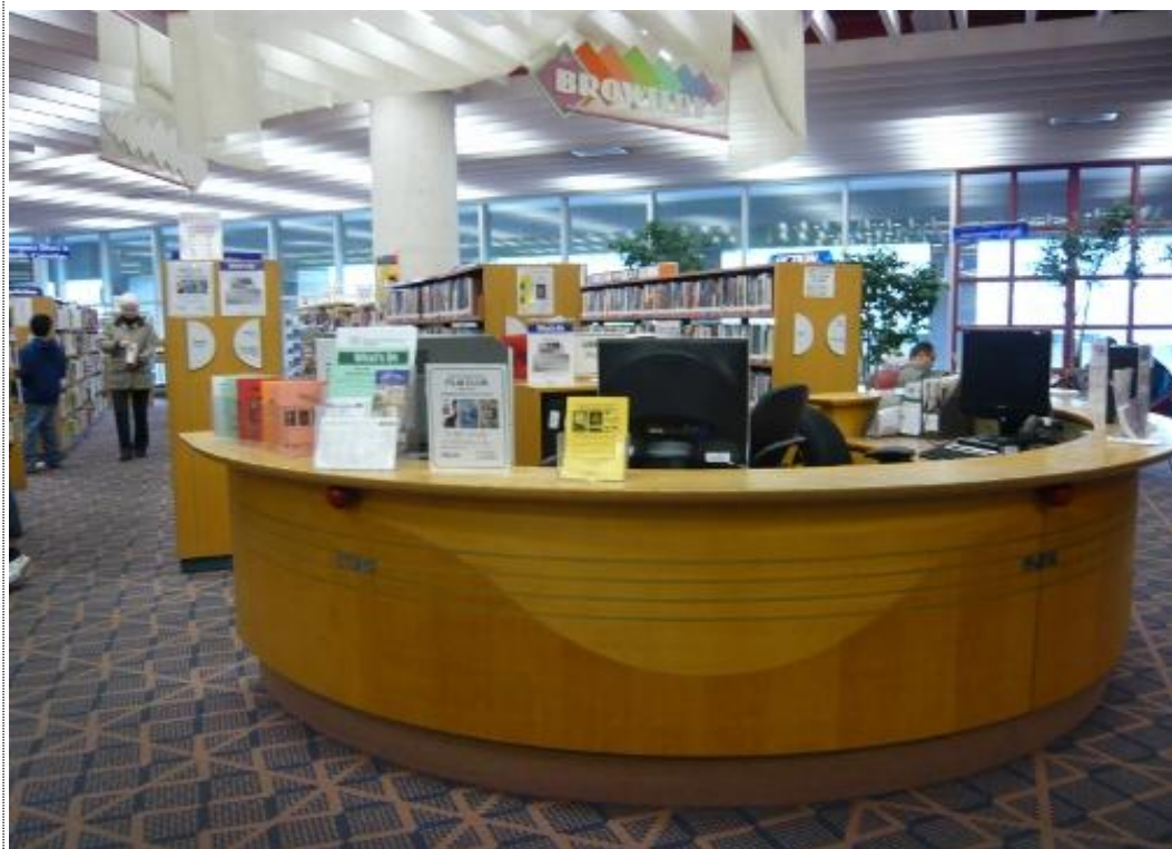
北約克中央圖書館(North York Central Library)內部空間寬敞明亮、設備齊全，提供讀者優質與便利的服務。(101.03.17)