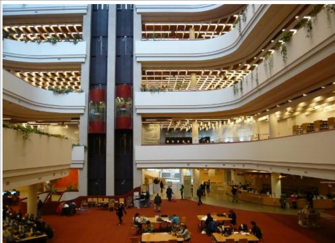
多倫多參考書圖書館(North York Central Library) 挑高的大廳頗為氣派，內部設備完善且空間寬敞，提供讀者安靜的閱讀環境。(101.03.17)