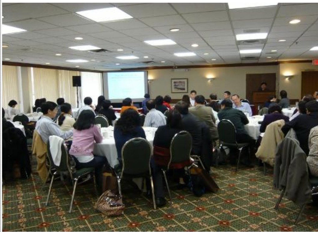
北美中國研究圖書館員學會學術研究信息交流會(Society of Chinese Studies Librarian, SCSL)的會議，與會者聆聽報告。(101.03.16)