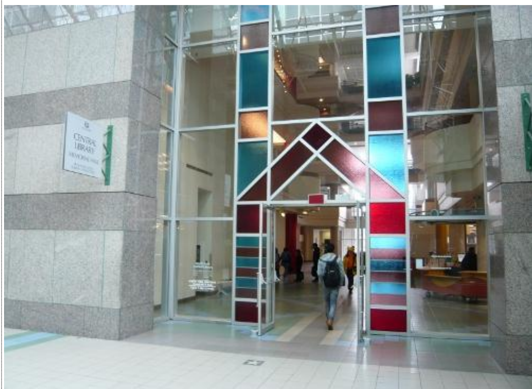
北約克中央圖書館(North York Central Library)位於多倫多市地鐵系統最北邊的倒數第二站 North York Centre 地鐵站的出口。(101.03.17)