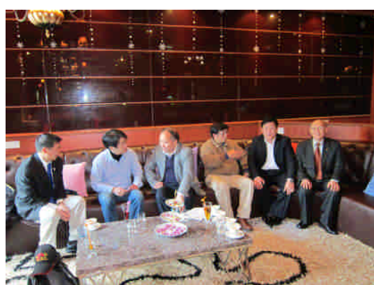
101.2.23 拜會廈門大學管理學院