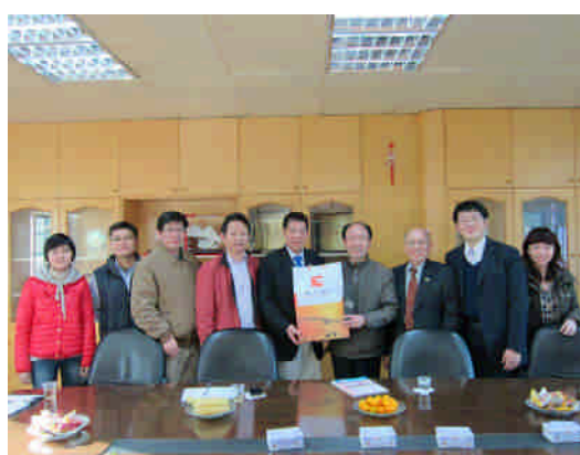
101.2.23 與廈門市教育局領導們合影