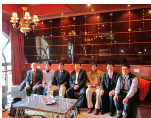
101.2.23 與廈大管理學院領導合影