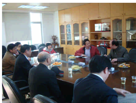
101.2.23 與廈門市教育局領導座談