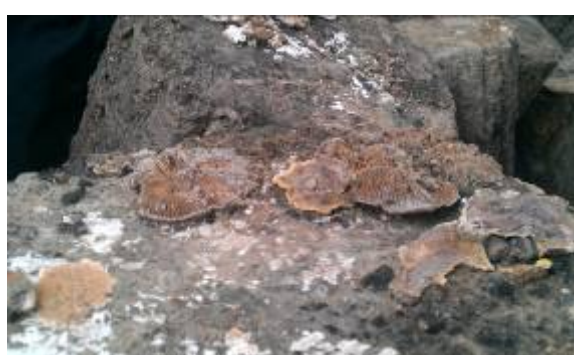
清州市農戶栽培之香菇段木上漲出裂折菌