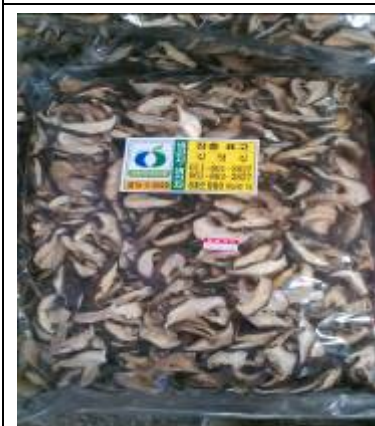
韓國可樂市場所見之香菇切片