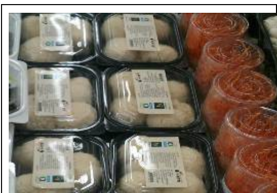
韓國農協超市販售之猴頭菇與北蟲草