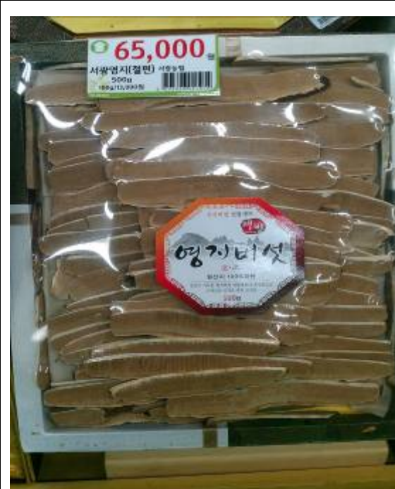
韓國農協超市販售之靈芝切片