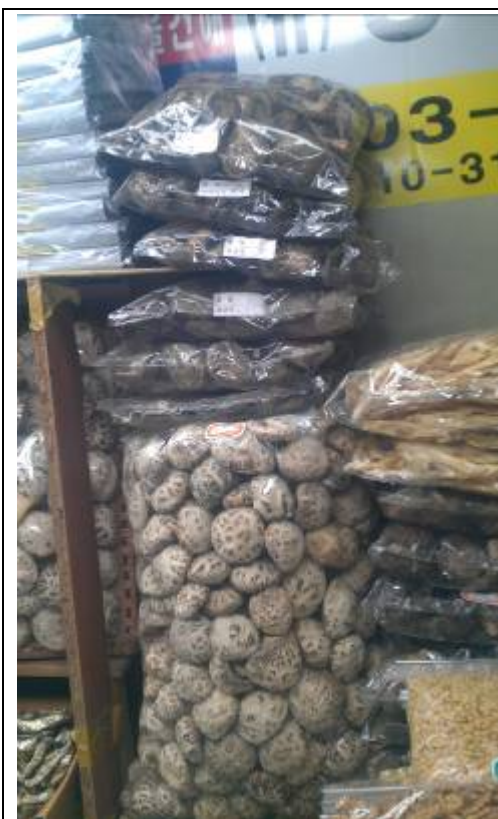
可樂市場內隨處可見之大陸香菇