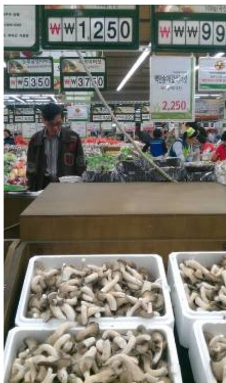
韓國農協超市販售之鮮銷杏鮑菇