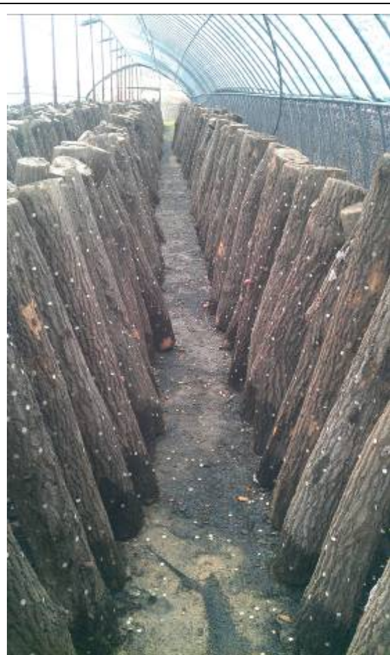
韓國當地以段木栽培香菇之情形