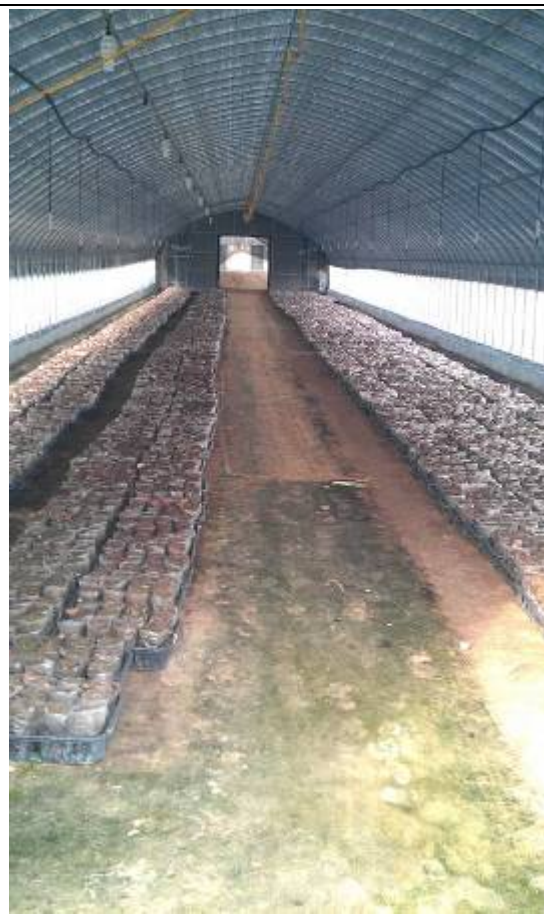
韓國當地以台灣式太空包栽培香菇之情形