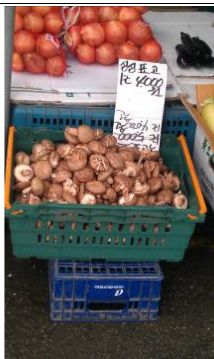
可樂市場內之鮮銷香菇