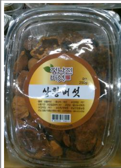
韓國農協超市販售之桑黃