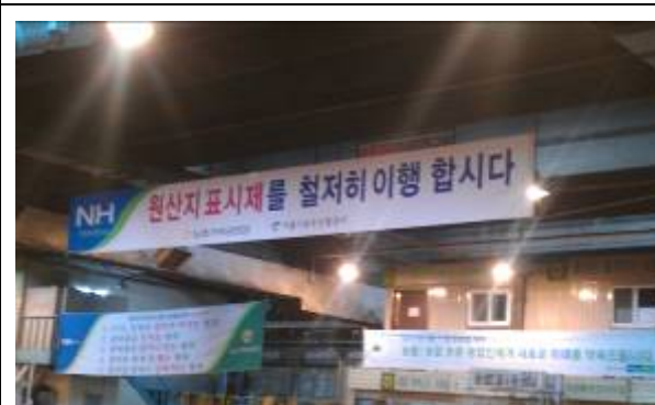
韓國可樂市場所見加強產地標示宣導