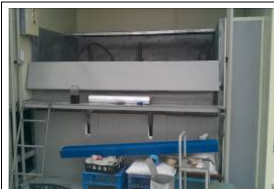
京幾道農戶所使用之混料機