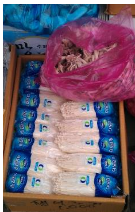
可樂市場內之鮮銷金針菇