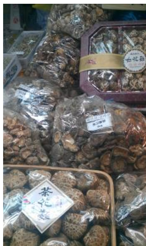
可樂市場內隨處可見之大陸香菇