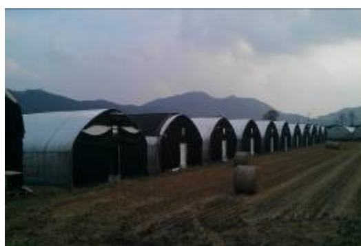
京幾道農戶所使用之香菇栽培庫