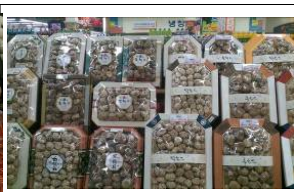
韓國農協超市販售之乾香菇