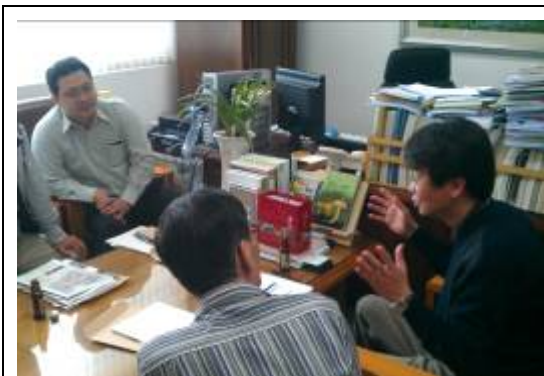
山林組合食用菌研究所座談