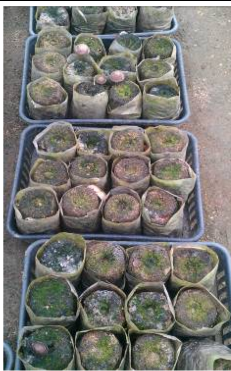
清州市農戶栽培之太空包香菇