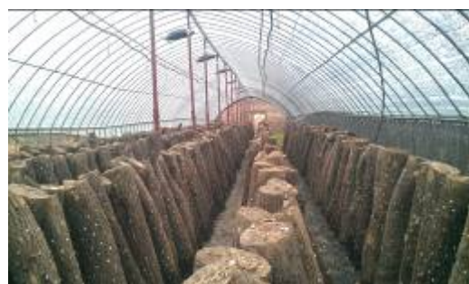
清州市農戶栽培之段木香菇