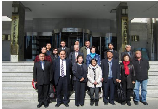
10月24日拜會內蒙古衛生廳