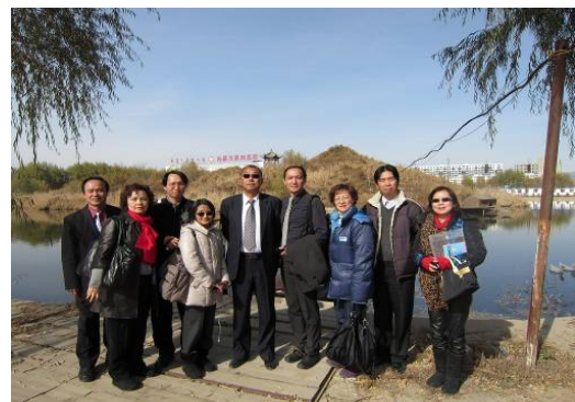
10月25日內蒙古第四醫院人工湖