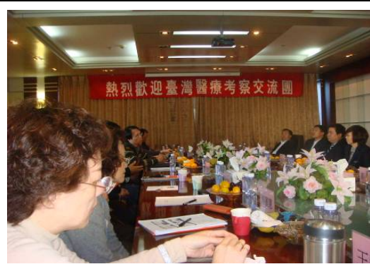
10月28日包頭市中心醫院