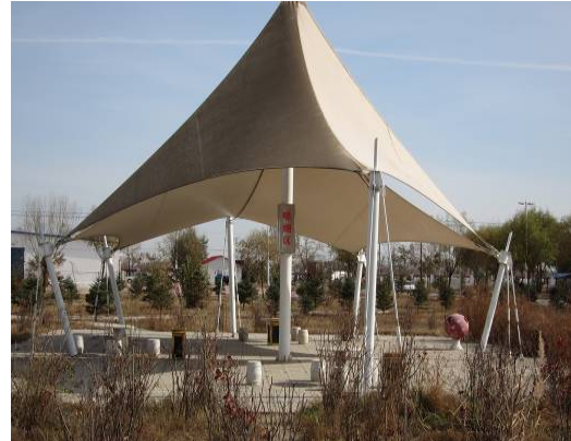
10月25日內蒙古第四醫院戒菸亭