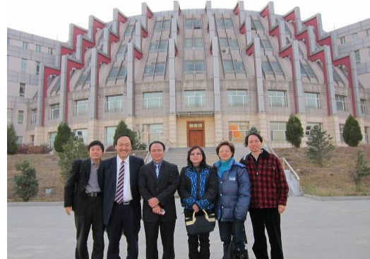
10月24日參訪內蒙古醫學院