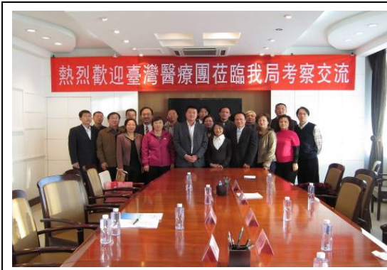
10月27日包頭市衛生局