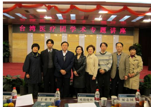
10月23日內蒙古人民醫院演講