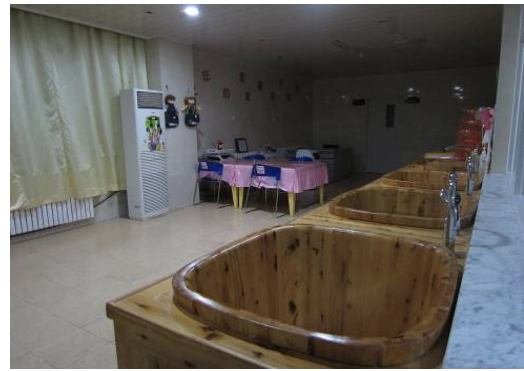
10月27日包鋼醫院嬰兒室浴盆