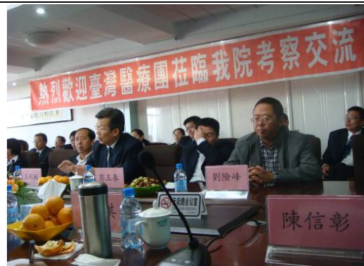
10月28日包頭市第二附屬醫院