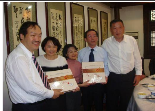
10月28日包頭市第二附屬醫院