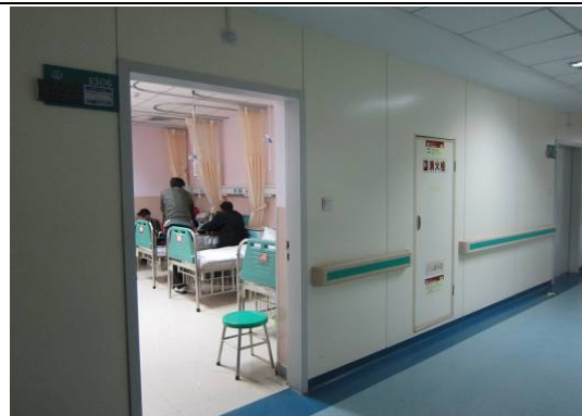
10月27日包鋼醫院病室及懸吊點滴架