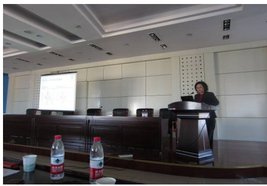
10月23日疾病預防控制中心演講