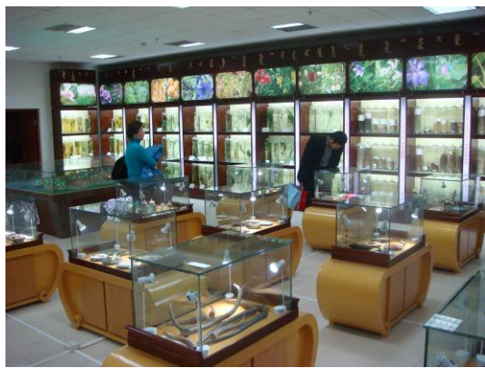
10月24日內蒙古醫學院蒙醫博物館