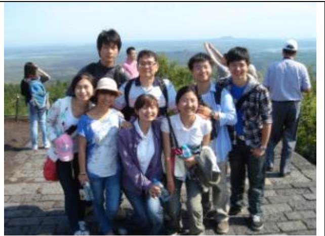
學生與指導老師（後排）以及北京師範同學（前排）活動合影