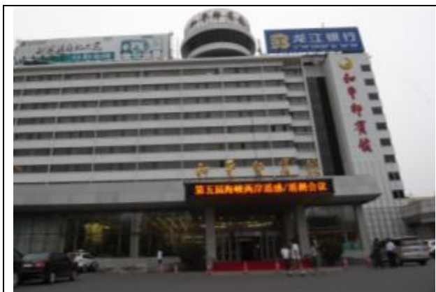
會議地點中國哈爾濱