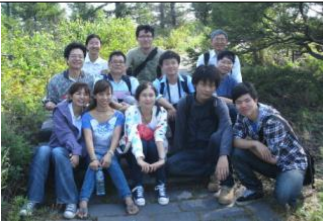
與中央大學師生及北京師範大學生 於五大連池黑龍山合影