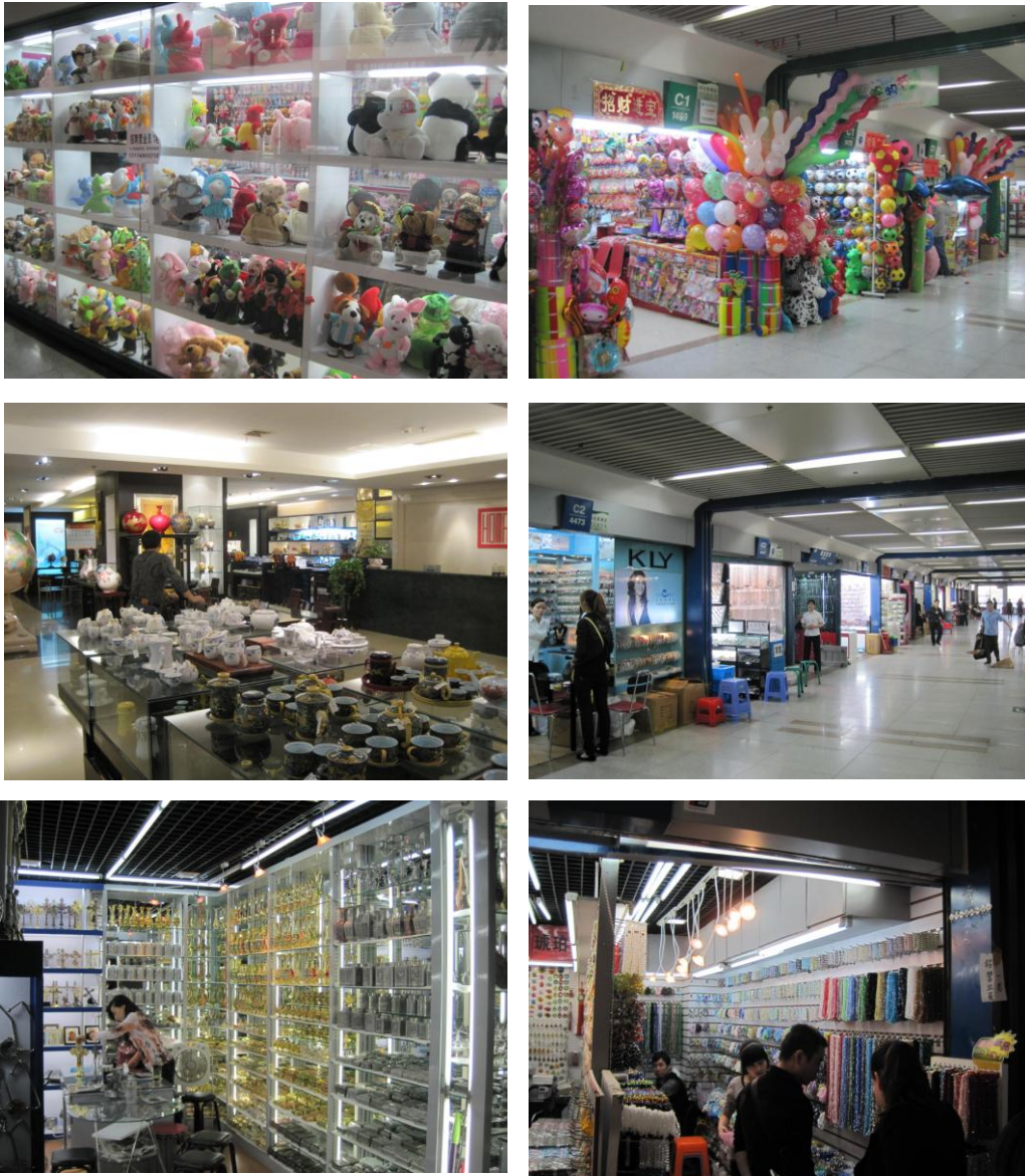
圖 15 義烏小商品批發市場商品展示專櫃