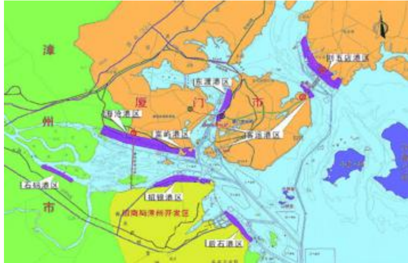
圖 17 廈門港區規劃圖

擁有和平碼頭、國際旅遊客運碼頭和五通海空聯運碼頭。發展海峽、海灣滾裝運輸、海空聯運，沿海、短途旅客運輸以及為城市生活、旅遊服務。