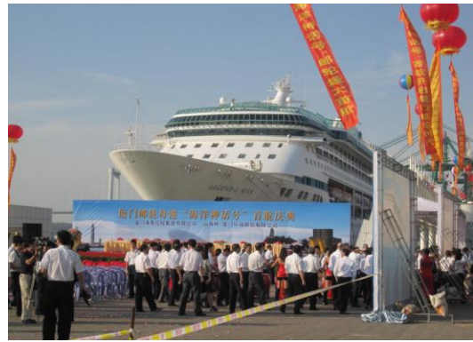
圖19 「海洋神話號」首航慶典