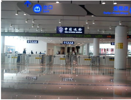
圖 8 行李託運及通關區