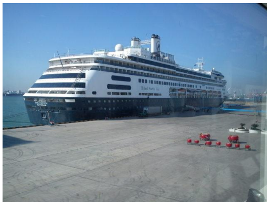
圖 6 太陽公主號靠泊客運碼頭