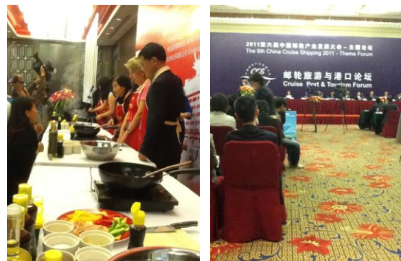
圖 11 外交官烹飪大賽與郵輪旅遊討論