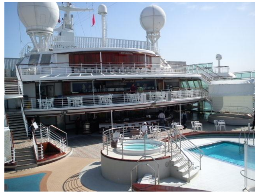
圖 9 太陽公主號郵輪外實景