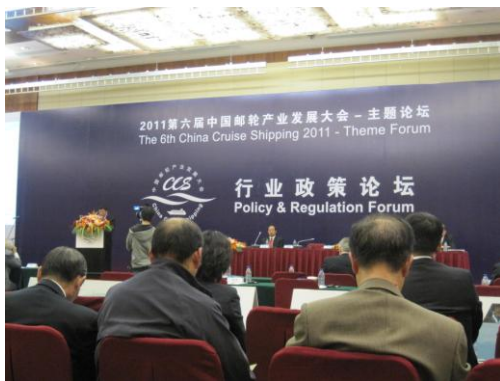
圖 10 行業政策論壇