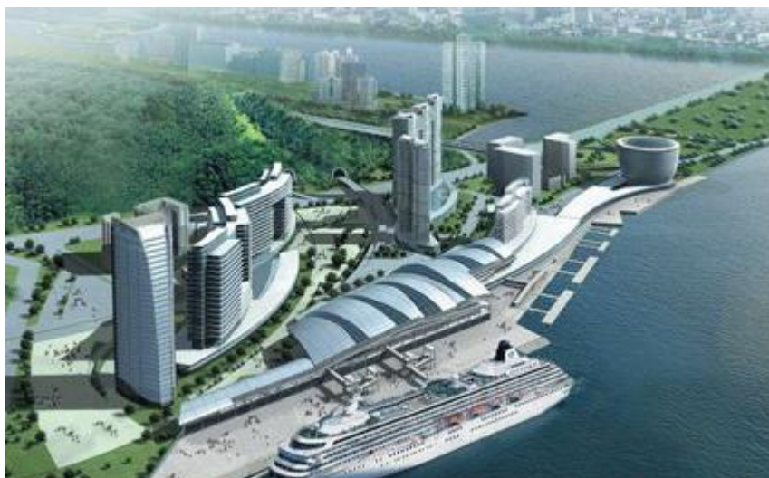
圖 16 廈門東渡郵輪中心 資料來源 http://www.taihainet.com

港灣由大小金門等島嶼形成一道天然屏障，港內水域寬闊、水深浪小、不結凍且少淤泥。岸線總長 202.3 公里，適於建港的岸線 60.5 公里；錨地面積達 19 平方公里。進港航道全長約 42 公里，水深達到-14 米，10 萬噸級船舶全天候進出港。目前，全港共有營運泊位 122 個，深水泊位 33 個，包括貨櫃、石油、煤炭等專用碼頭，第六代貨櫃船舶可直接靠泊作業。2011 年 1-10 月全港累計貨物吞吐量 1.3 億噸，貨櫃吞吐量突破 522 萬 TEU，廈門港旅客突破 107.8 萬人次，比同年增長 22.3%，其中台灣航線旅客為 15 萬人次，比同年增加 35.56%。