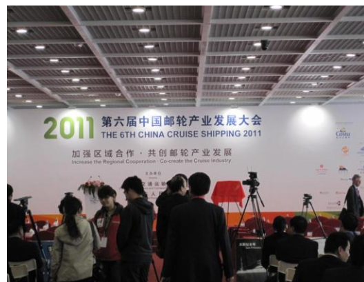
圖 5 大會開幕儀式記者招待會