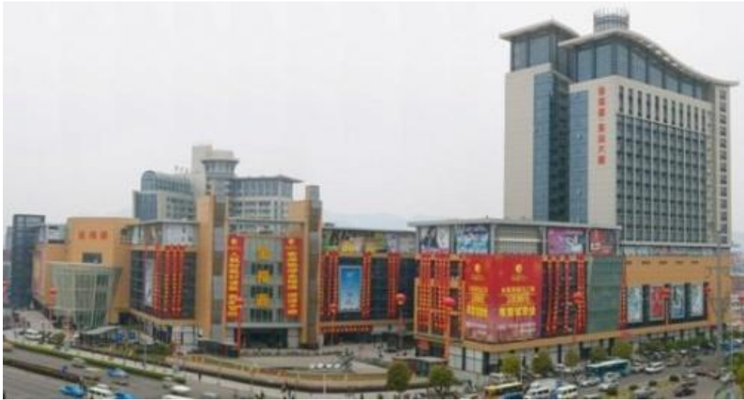
圖 14 義烏國際商貿城示意圖

義烏是一個商業十分發達的城市，義烏市中的 160 萬人口，每 8 個人就有一個在經商。義烏小商品市場匯集了世界各地廠家生產的 32 多萬種產品；市場的成交額已連續 14 年居中國各大小商品市場榜首，也是目前全球最大的日用消費品流通中心和大陸地區重要的商品出口基地。