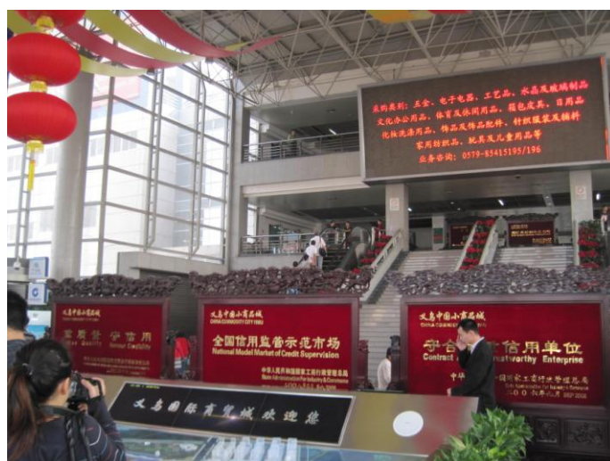
圖 13 義烏國際商貿城內實景

小商品城由義烏國際商貿城、篁園市場、賓王市場三個市場群組成，市場擁有 28 個大類、10 萬餘種小商品，幾乎囊括了工藝品、飾品、小五金、日用百貨、箱包、雨具、電子電器、玩具、化粧品、襪業、副食品、鐘錶、線帶、針棉、紡織品、領帶、服裝等所有日用工業品。其中，飾品、襪子、玩具產銷量佔全國市場 1/3 強。物美價廉，應有盡有的特色鮮明，在國際上具有極強的競爭力。