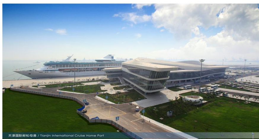
圖 1 天津港國際郵輪碼頭示意圖

它位於環渤海區域的中心地帶，河海交匯，面海依港，區內 153 公里的海岸線和世界第五大港口—天津港，為發展郵輪產業提供了有利的自然條件；它背靠北京、天津兩大直轄市，輻射華北、東北、西北 13 個省市區，腹地廣闊，交通便捷，蘊藏著豐富的旅遊資源和巨大的消費市場。2006 年，加快天津濱海新區開發開放納入大陸地區發展戰略，濱海新區經濟社會發展突飛猛進，目前已經成為大陸地區開放度最高、政策最優惠、發展最活躍的地區之一。