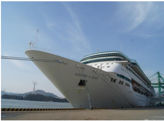
圖18 皇家加勒比郵輪「海洋神話號」

本次首航標誌著以廈門為母港、聯結兩岸三地的郵輪旅遊項目正式啟動，具有重大的先行效應和深遠意義，也拉開廈門建設郵輪母港的序幕。廈門環球郵輪有限公司也將引入未來亞洲地區最大型郵輪“海洋航行者號”（14萬噸）。同時，東渡港區也將啟動改造，逐漸從貨運港區向郵輪母港轉型。未來，廈門港除了努力提升國際航運樞紐港地位外，也將大力發展高級客運。