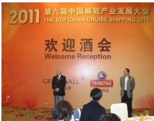
圖 4 大會歡迎酒會主席致詞

三、除了以上郵輪產業的相關部門正發展中，郵輪公司如皇家加勒比海郵輪公司、哥詩達郵輪公司及麗星郵輪公司為目前亞洲經營郵輪前三大公司，從本次大會中獲知 2012 年此三家公司將於東北亞地區派遣六艘郵輪，航行於上海、天津、香港、基隆、台中、高雄、花蓮、釜山、濟州、新加坡、三亞、福岡、長崎等城市，總計安排 356 航次彎靠台灣有 94 航次，比率高達 26%，未來隨著兩岸郵輪市場發展，以及基隆、台中、高雄及花蓮等國際商港旅客及碼頭設施日趨完備，台灣郵輪航次及旅客樂觀預估會繼續增加。