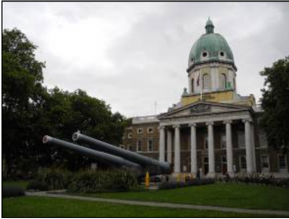
圖片三十一 帝國博物館外觀

大廳展示了許多第一以及第二次世界大戰的軍事武器，舉凡戰鬥機、坦克車以及火炮等，當看到這些實體的戰爭武器時，相信都讓學員留下深刻的印象(圖片三十三)。