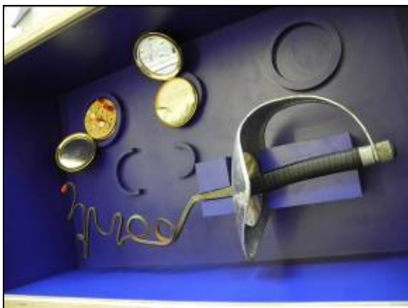
圖片三十七 使用的各種道具

也發現一些學員提出的想法的確具有相當多的創意。其實這所有的課程是館員為國高中生準備的教育活動，這些上課內容都是為了刺激學生去思考展品以及自身的關聯性，而事實證明這樣的教案的確相當具有啟發性，是一次相當有趣的上課經驗(圖片三十七、三十八)。