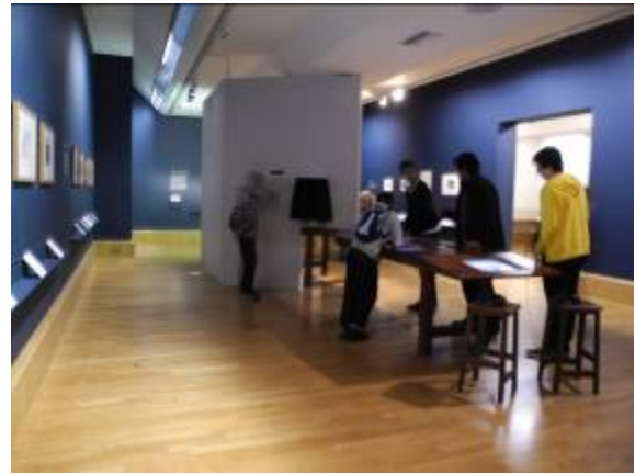
圖片四十二 教育展情景

以上就是本次出國行程的內容概述，可以從中發現這次行程真的有許多的收穫，包括參觀英國的博物館、與館員座談甚至進行教育活動等，而相關內容將在報告的最後部分做整理。