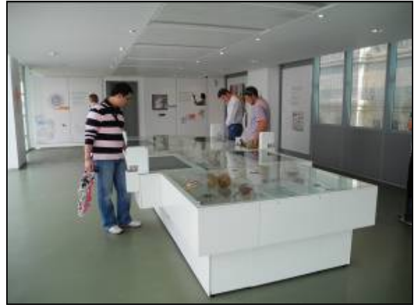
(圖十六)達爾文中心展場情景