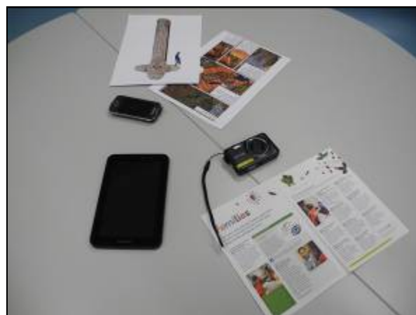
(圖十)上課所使用的數位媒體工具

透過大英博物館三位館員的介紹，讓參加的學員對英國博物館的教育形式有了基本的了解。就館方的立場，是相當關心學生與孩童在博物館中的學習，多元的教學方法也能激起參加者的興趣，這是台灣博物館教育人員需要效仿的地方。