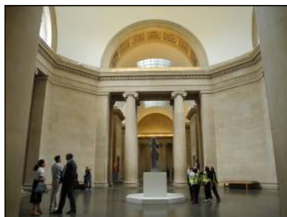
圖片四十 泰德英國館大廳

進去參觀後，發現該館真的蒐藏許多著名的藝術品，蒐藏類型也相當多元，包括繪畫、雕塑、裝置藝術等(圖片四十一)。除了傳統的精緻藝術外，館內同時