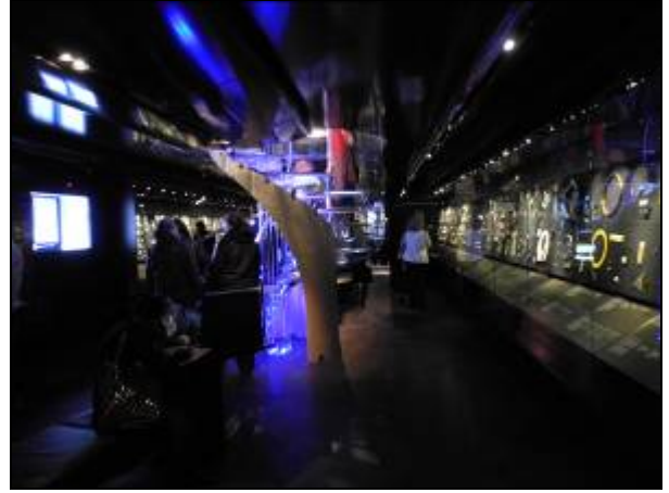
(圖十二)博物館內珠寶展廳

下午則是參觀大英自然史博物館，這座博物館是由英國文化、媒體與體育部贊助，而且是非政府部門的公共機構。該館擁有的生物與地球科學標本約七千萬件，包括植物學、昆蟲學、礦物學、古生物學以及動物學。雖然博物館的外觀看似幾百年的古老建築，但是仔細看，就發現牆壁柱頭上的雕塑可都是恐龍(圖十三、圖十四)。