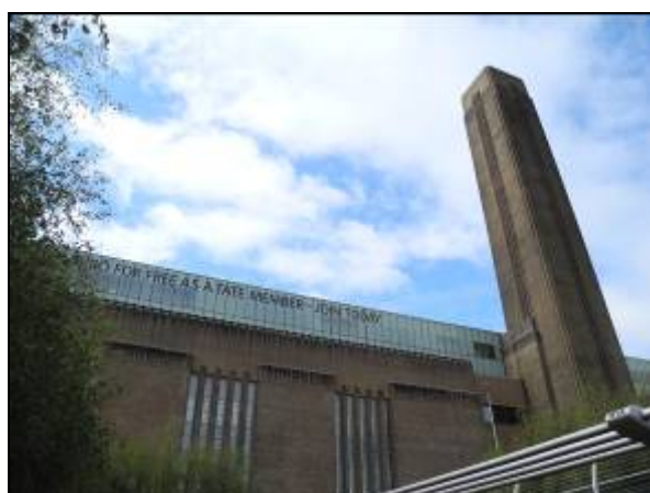
圖十九 泰德現代館外觀

在參訪行程的第四日，老師為學員安排去的是泰德現代館。該館是英國主要的現代美術館，是座落於一座前身為發電廠的廠房中，在經過改建後，成為新興的藝術區。泰德現代館展覽的是從 1900 年至今的現代美術作品。包括二十世紀相當著名的藝術家如畢卡索、達利以及羅丹等。這座成立於 2000 年夏天的當代藝術館，在經過十年的努力之後，已經足以和美國的紐約現代美術館還有法國的龐畢度中心相互媲美(圖十九、二十)。