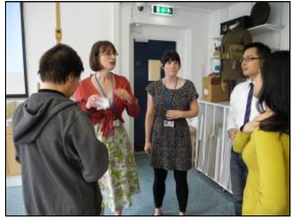
圖片三十四 館員進行課程

第二堂課則是由教育學習與詮釋部門的館員為學員上課(圖片三十五)。這堂課程的內容相當有趣，就是館員以各種特別的教材來激發學員們的想像力以及聯想能力。館員首先拿一個造型特殊的杯子舉例，杯中是有塑膠製作成的型體，並包覆著一隻船。館員將杯子輪流傳給學員，並請學員發揮想像力去描述看到杯子所聯想的事物。練習過後，再來就是進行個人的作業，館員發給每桌的學員一個箱子，箱子中各有數件相同性質的道具，都是不同性質的物件組合在一起。館員要每位學員選擇其中一件道具，並去進行腦力激盪，想一想這件道具的特性(圖片三十六)。