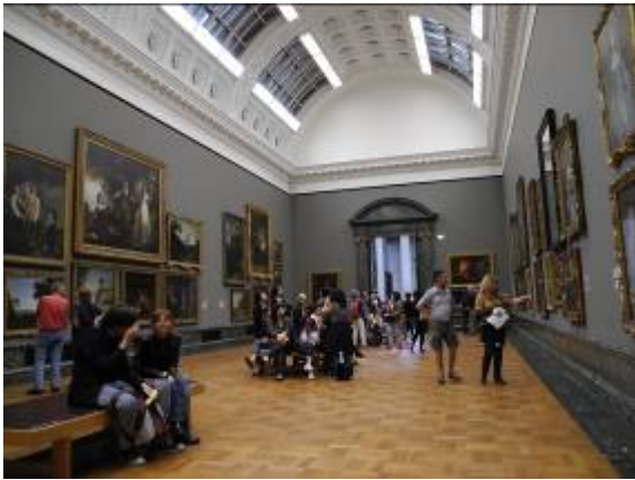
圖片四十一 傳統繪畫展覽

也有展出當代藝術作品，館內最大的特色就是都展出英國藝術家的作品，最家喻戶曉的畫家包括泰納、康斯坦伯等。展覽的形式與國家畫廊和泰德現代館類似，多屬於掛置在展覽間的形態。而館內最具特色的一個展廳是以泰納的作品為例，探討色彩與線條的教育展示，透過各種引導性展示還有說明文字，能讓觀眾對泰納繪畫作品有更深一層的認識(圖片四十二)。能在最後一天還參觀到如此具有特色的展示是相當有趣的。