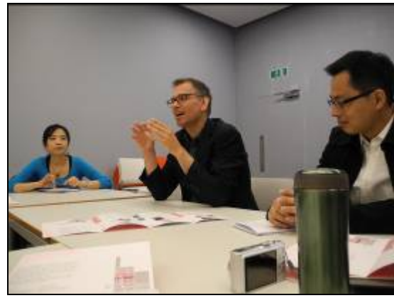
圖二十二 講者講課情景