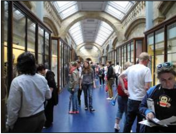
(圖十五)博物館內展場情景