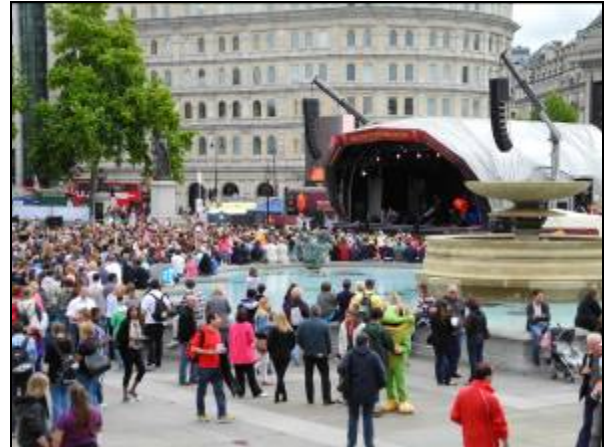
圖十八 特拉法加廣場舉辦活動情景

由於國家畫廊規定在館舍內禁止拍照，所以在報告內是無法提供館內的照片。但是國家畫廊中真的擁有相當多件藝術史大師的作品，像是達文西《岩窟中的聖母》、米開朗基羅《埋葬》、霍爾班《大使》、委拉斯蓋茲《鏡前的維納斯》等名作。而且展場與展品的數量都相當多，就是讓觀眾花上一整天也未必能夠看完所有的作品。由於當日的行程屬於自由參觀，所以並沒有博物館館員接待與上