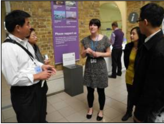
圖片三十三 館員接待學員