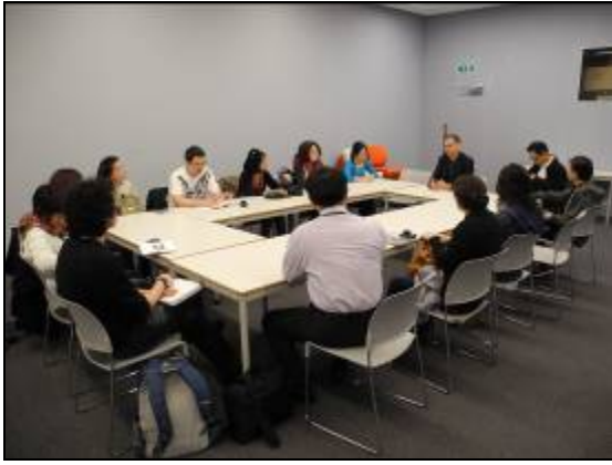
圖二十一 上課情景