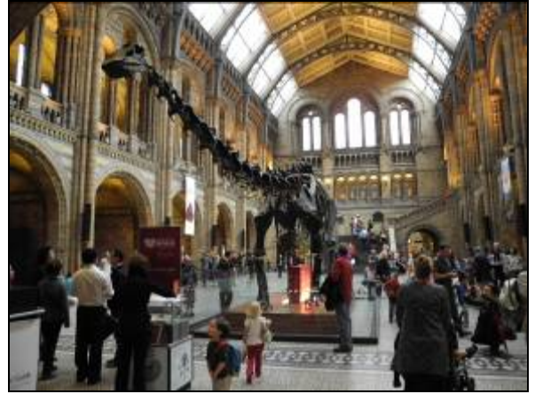
(圖十四)大英自然史博物館大廳

館內的展示相當多元，從純展示恐龍標本到運用數位科技的達爾文中心都應有盡有(圖十五、圖十六)。因此在這裡可以見識到自然科學類博物館在不同類型展示與教育上的成就。