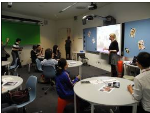
(圖九)數位媒體教室上課情景

第三堂課則是去館內的數位學習教室上課(圖九)，這間由三星企業贊助的學習空間，是由館員利用各種數位媒體工具教導小朋友如何去認識藝術品與古文物。這些數位工具像是筆記型電腦、手機或是數位相機能引起小朋友的興趣(圖十)，隨著活動內容的引導，可以讓他們主動的去認識這些博物館的館藏品。