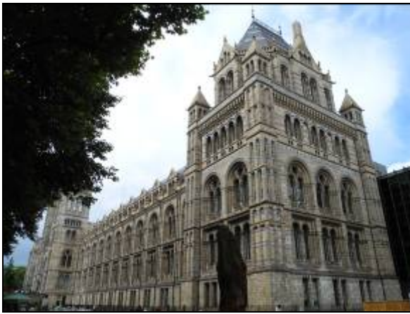
(圖十三) 大英自然史博物館建築外觀

下午則是參觀大英自然史博物館，這座博物館是由英國文化、媒體與體育部贊助，而且是非政府部門的公共機構。該館擁有的生物與地球科學標本約七千萬件，包括植物學、昆蟲學、礦物學、古生物學以及動物學。雖然博物館的外觀看似幾百年的古老建築，但是仔細看，就發現牆壁柱頭上的雕塑可都是恐龍(圖十三、圖十四)。