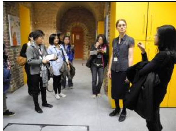
(圖二) 參觀學校團體休息室

接著上午時間是自由時間，學員可以利用三個半小時的時間去自然參觀大英博物館內的展覽。而該館最引以為傲的就是擁有極為豐富的館藏文物，因此儘管有三個多小時的參觀時間，還是只能以瀏覽的方式快速走過，但也因此見識到古埃及的羅賽特之石(圖三)、木乃伊、艾爾金大理石群等知名的典藏品，可以說真的有相當大的收穫。