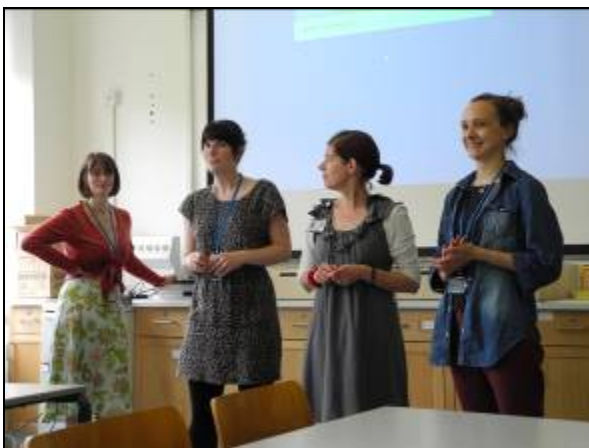
圖片三十五 教育部門的館員

第二堂課則是由教育學習與詮釋部門的館員為學員上課(圖片三十五)。這堂課程的內容相當有趣，就是館員以各種特別的教材來激發學員們的想像力以及聯想能力。館員首先拿一個造型特殊的杯子舉例，杯中是有塑膠製作成的型體，並包覆著一隻船。館員將杯子輪流傳給學員，並請學員發揮想像力去描述看到杯子所聯想的事物。練習過後，再來就是進行個人的作業，館員發給每桌的學員一個箱子，箱子中各有數件相同性質的道具，都是不同性質的物件組合在一起。館員要每位學員選擇其中一件道具，並去進行腦力激盪，想一想這件道具的特性(圖片三十六)。