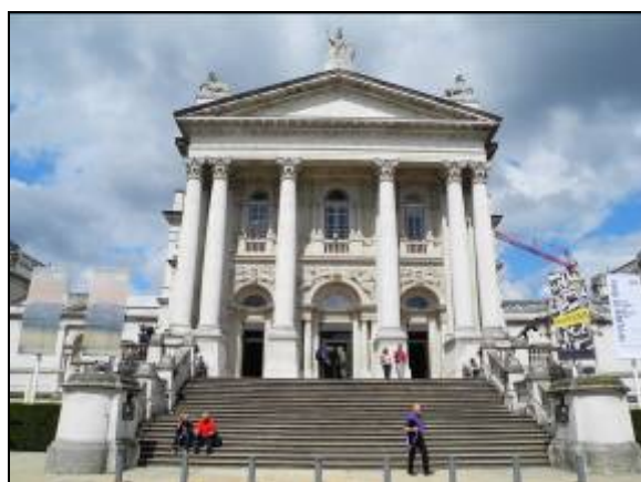
圖片三十九 泰德英國館外觀

今天為英國博物館參觀行程的最後一天，由於學員離開英國的班機時間為傍晚，所以曾老師安排的是讓學員們自由參觀。其中幾位學員去參觀的是在英國也相當知名的美術館—泰德英國館。只要蒐藏的是西元 1500 年以後至今的美術品，是在 1897 年所成立，與前幾日參觀的泰德現代館屬於同一個文化機構(圖片三十九、四十)。