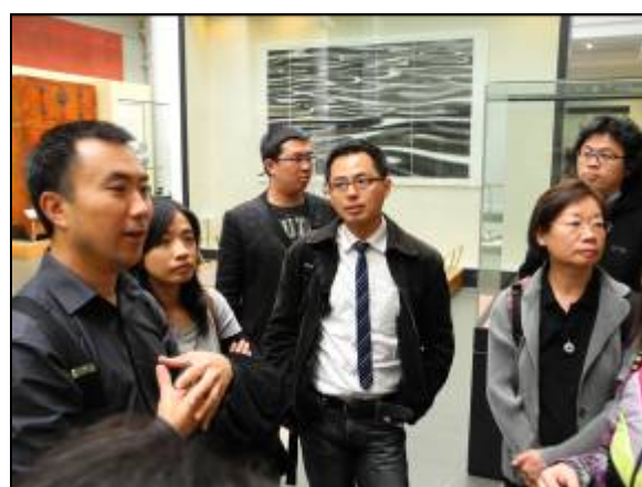
圖二十九 學員在亞洲部門上課情景