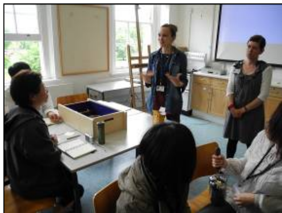
圖片三十八 館員與學員討論