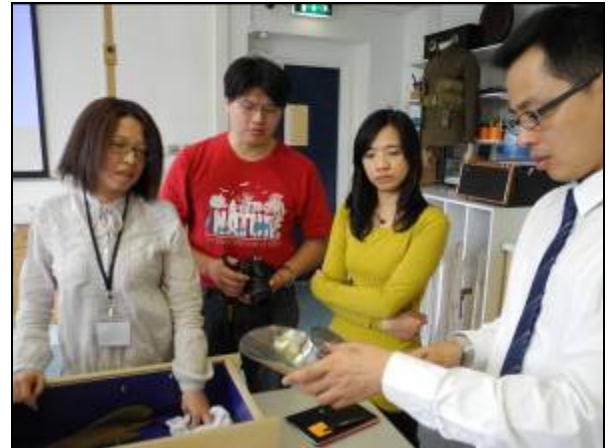
圖片三十六 學員觀看道具

接著館員就帶學員們去觀看一個以勳章為主題的展覽，主要介紹大戰期間一些立下顯赫戰功並拿到勳章的戰爭英雄，各展區還有不同的展示手法，包括漫畫式的投影、實物模型或是相關紀錄影片。館員要學員們從展覽中尋找一件展品，而且是能夠與自己選擇的道具產生關聯性，之後全體人員再帶回教室進行討論，