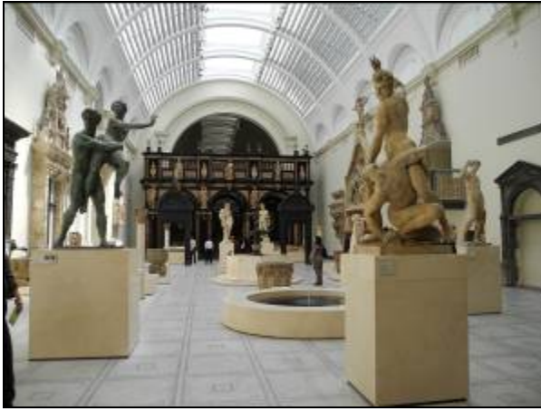
(圖十一)博物館內西洋雕像展廳