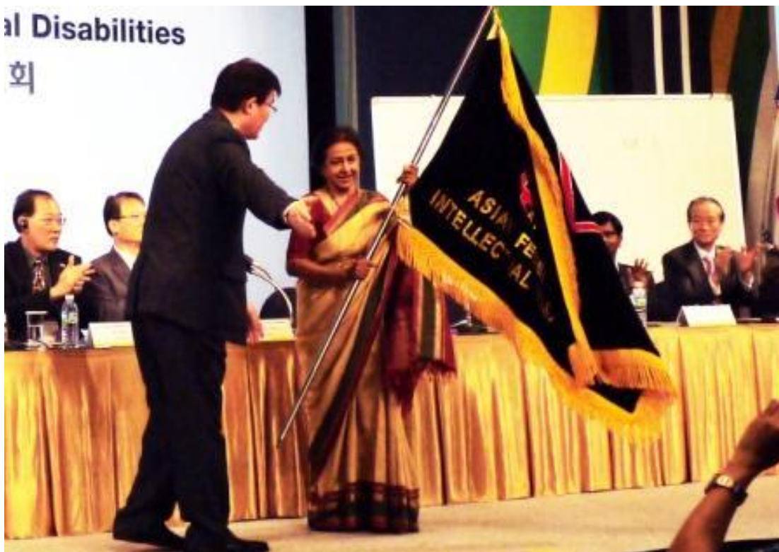
印度的 PRAMILA BALASUNDARAM 女士當選新一屆聯盟主席