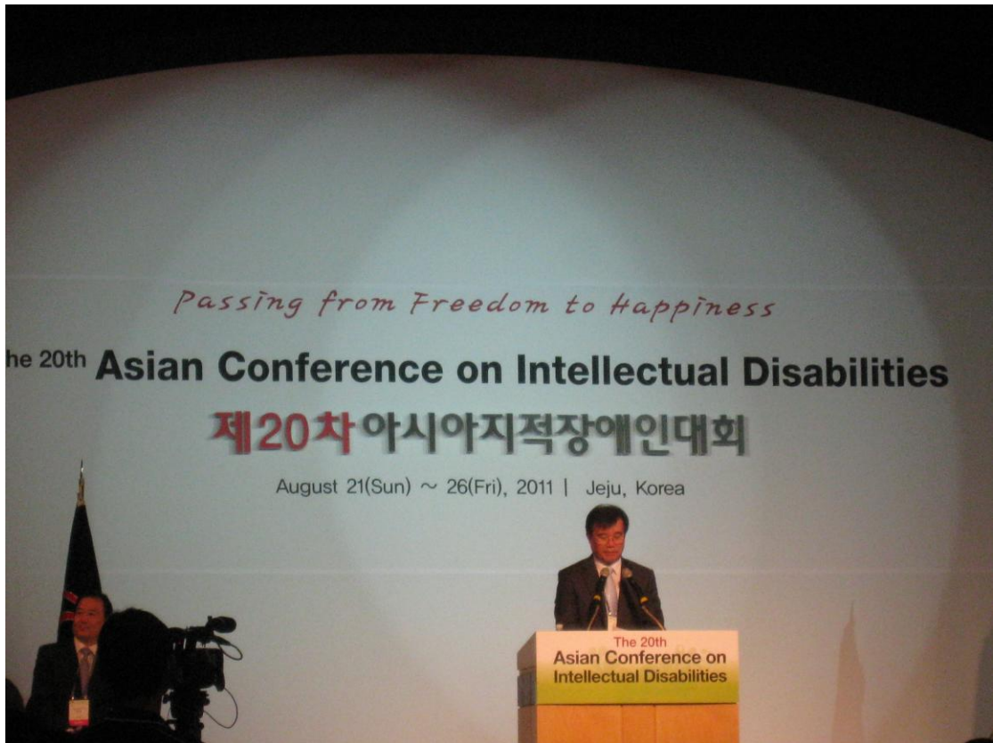
上圖：大會主席致歡迎詞