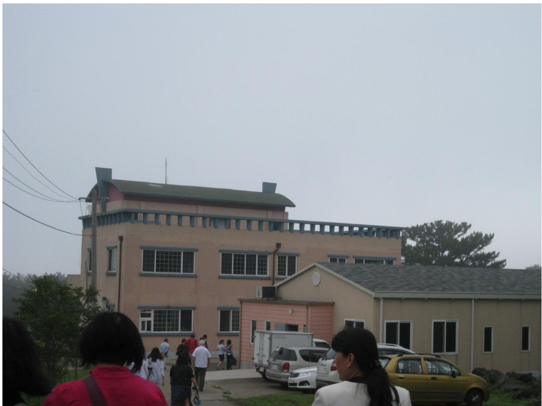
財團法人 HALLAWON 社會福利基金會之幸福屋