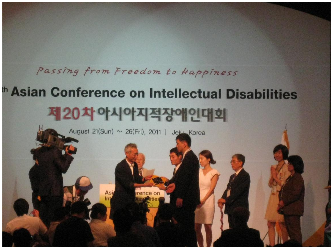
開幕典禮：表揚智能障礙者服務工作傑出貢獻人士