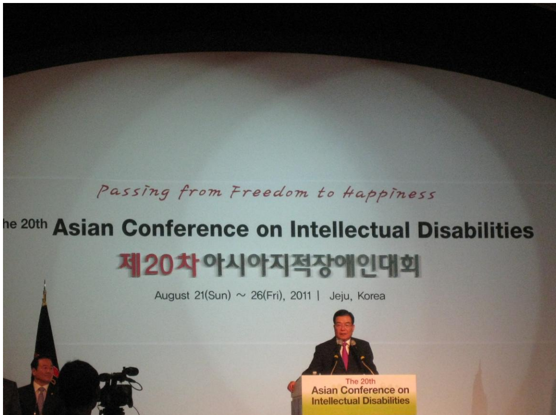
下圖：濟州特別自治區首長致詞