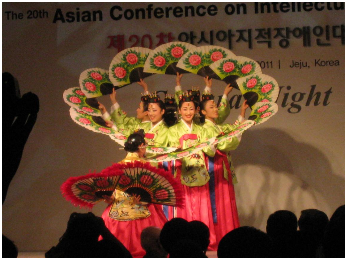
文化之夜的精彩表演