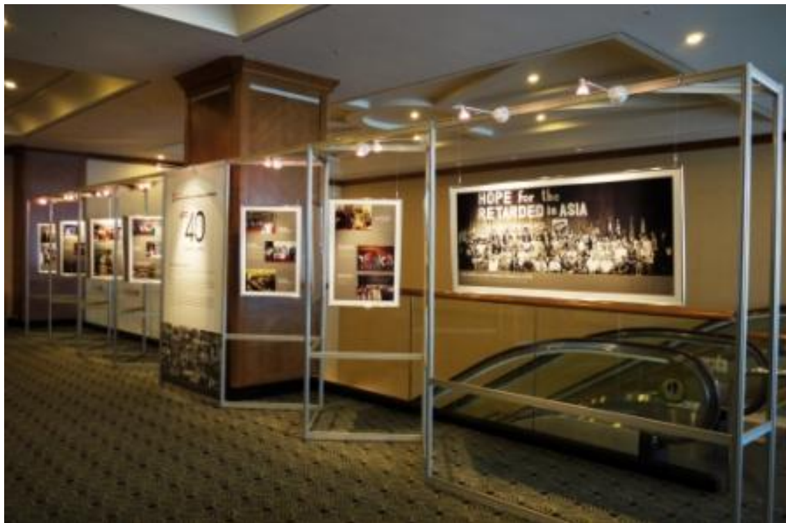
歷屆亞智盟大會辦理成果專題展覽