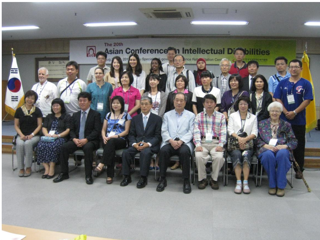
與濟州特別自治道復健中心的工作人員合影