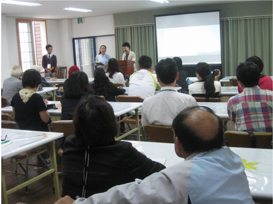
財團法人 HALLAWON 社會福利基金會主管進行機構簡報