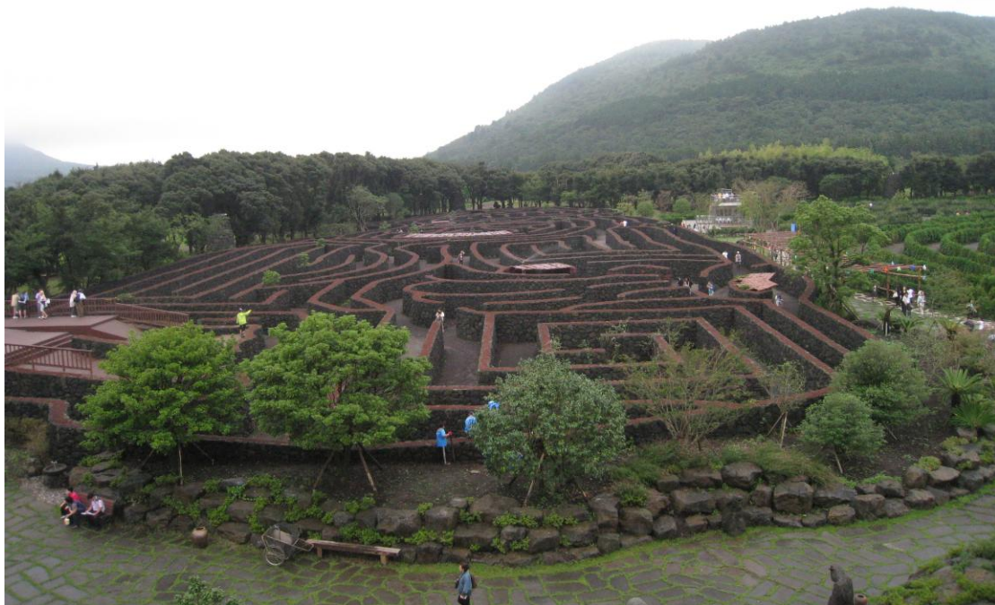
文化之旅：參觀 MAZE LAND