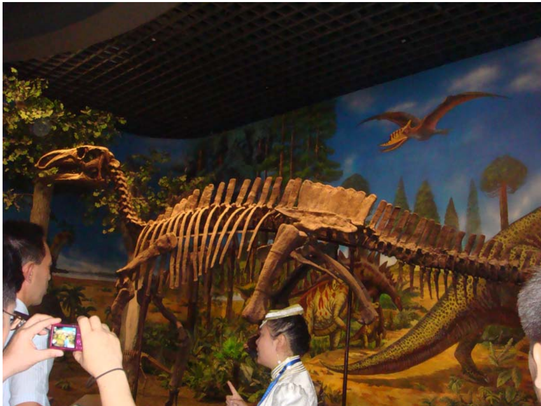
內蒙古博物院展示品恐龍全身