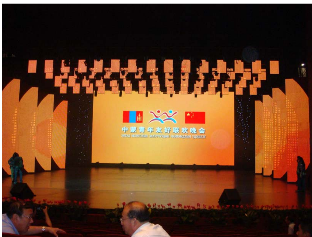
中蒙青年友好聯歡晚會彩排