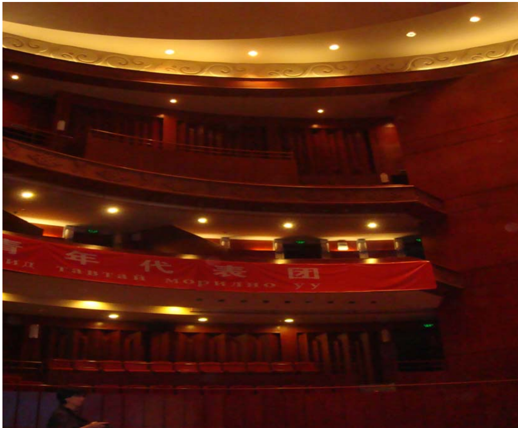
烏蘭洽特大劇院中的貴賓席