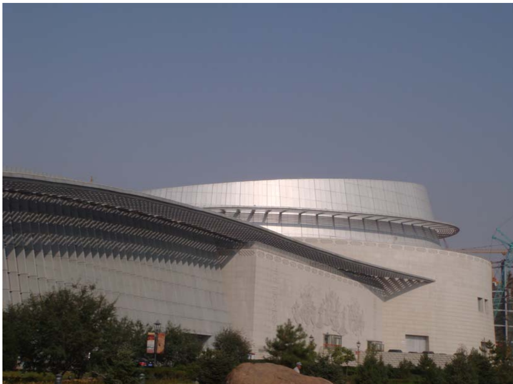
烏蘭洽大劇院側角