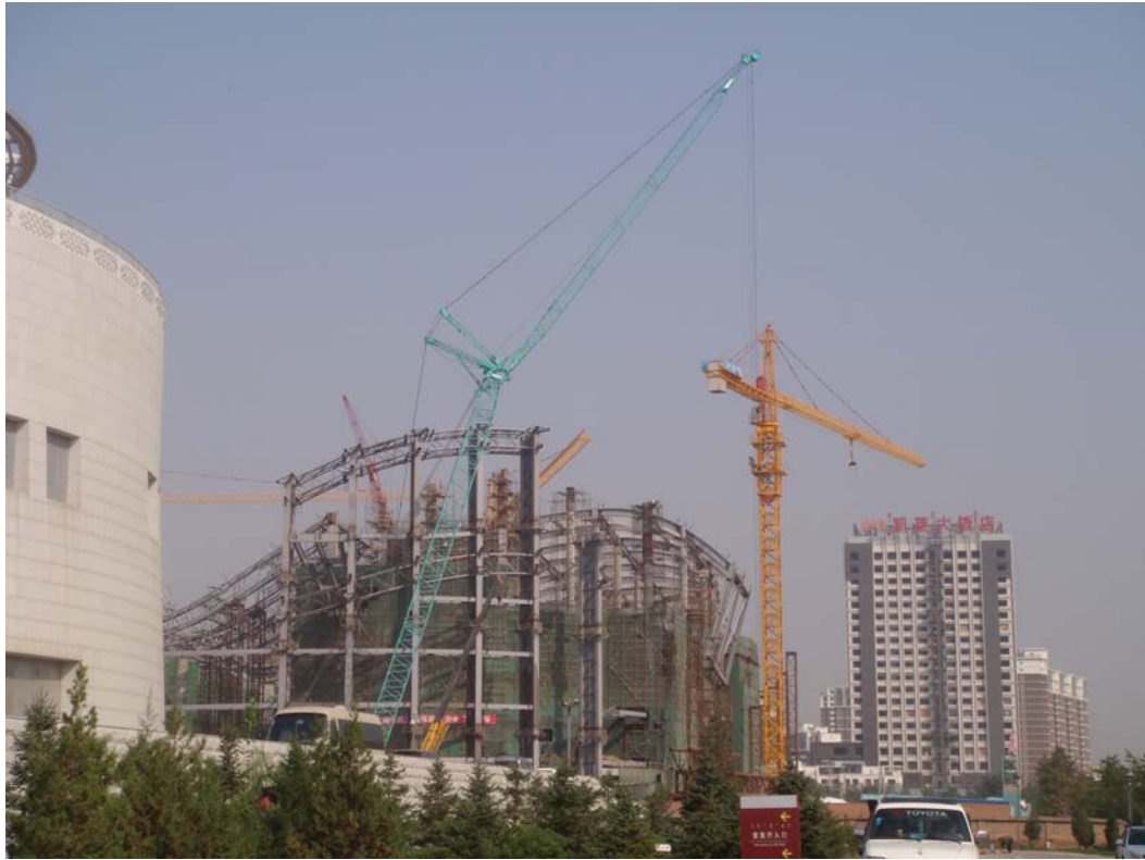
正在興建當中的內蒙古歌舞劇團辦公室