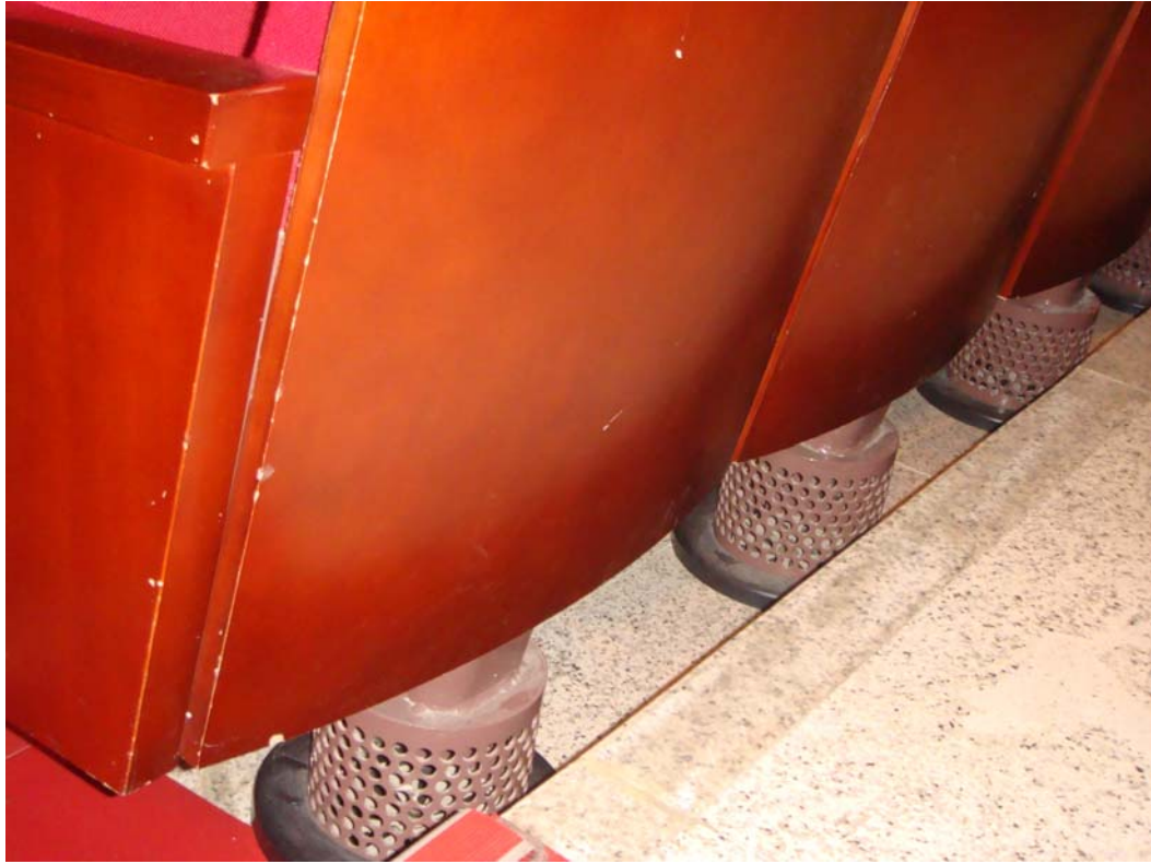
劇場座椅設備出風口