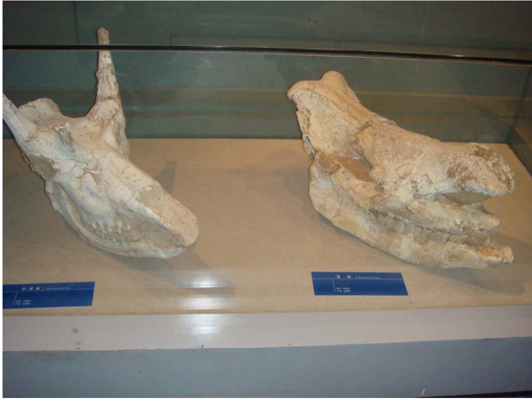
內蒙古博物院展示品恐龍頭蓋骨