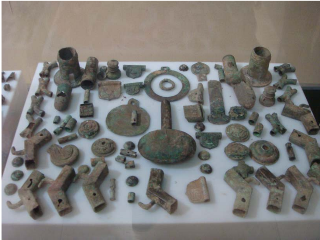
內蒙古博物院展示品遊牧民族青銅製品