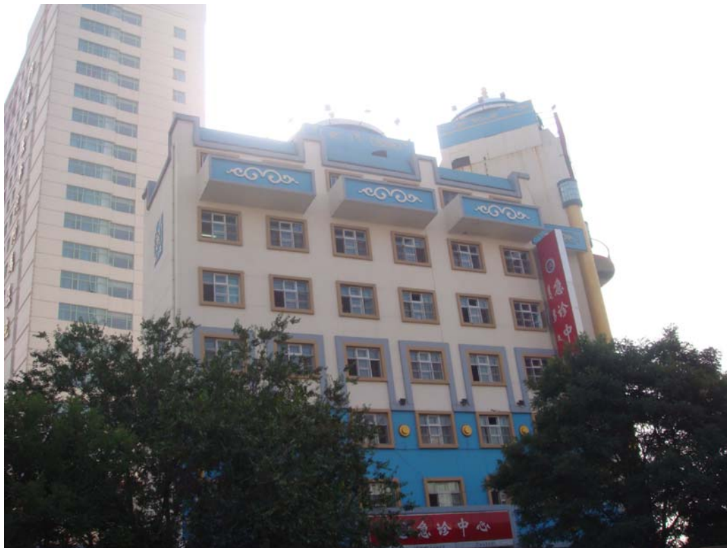
呼號浩特醫院建築