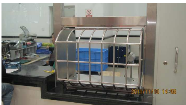
包裹櫃檯設有上下旋轉柵欄