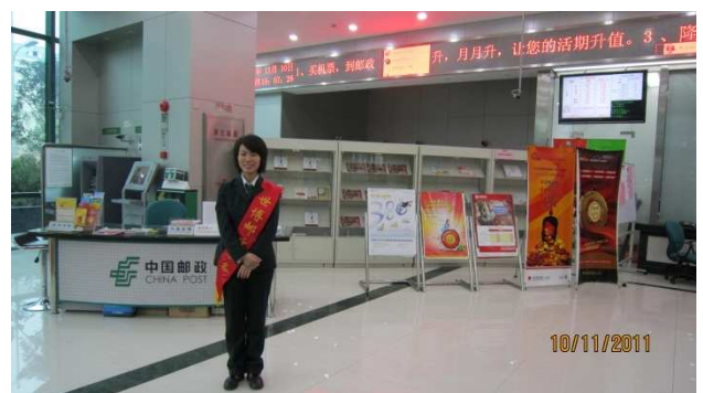
值班服務人員協助引導客戶用郵