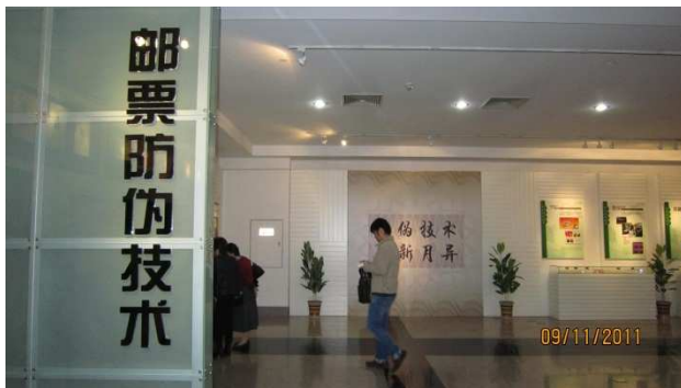
介紹各項郵票防偽技術之展覽廳