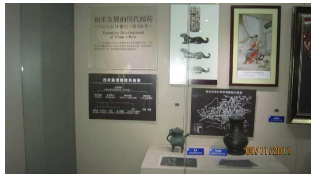
3 樓設原始通信展覽