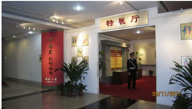
博物館 2 樓特展廳展出部分郵票設計原稿