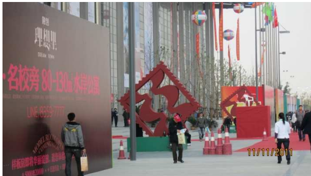
展覽中心外部布置