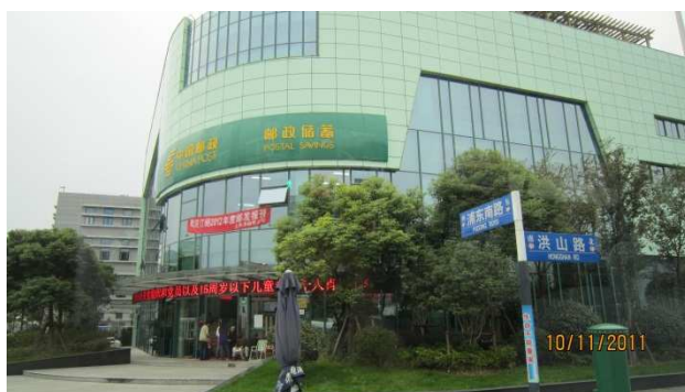
上海郵政世博支局外觀