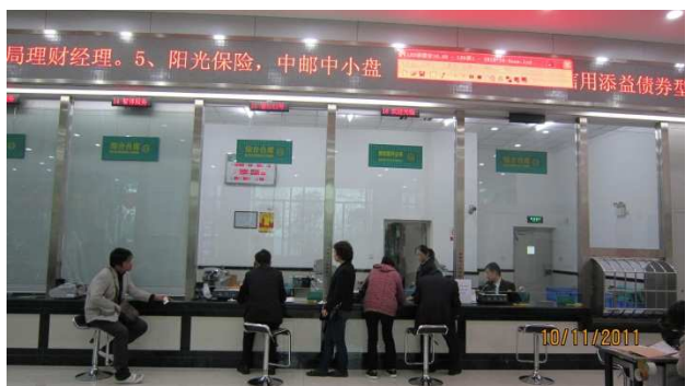
未營業窗口拉下窗簾並顯示「暫停服務」