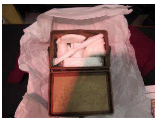
每件文物包裹無酸紙