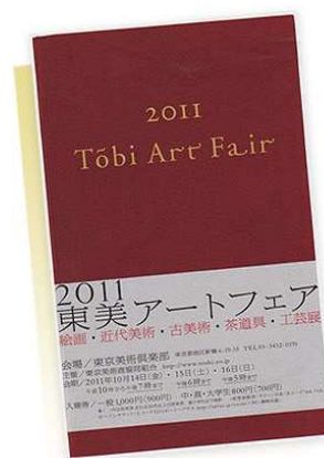
東美藝術博覽會海報

「東美」是「東京美術商協同組合」及「東京美術俱樂部」的總稱；前者是以東京為主約 500 家美術商組成的工會團體，後者是由這些美術商會員出資的公司。東美藝術博覽會，即是由歷史悠久的東京美術俱樂部，每隔兩年舉辦的大型美術商博覽會。