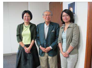
中央為林屋晴三教授

10月14日甫下飛機即刻前往拜會林屋晴三教授。此次訪問，感謝大阪市立東洋陶磁美術館名譽館長伊藤郁太郎教授的介紹下得以成行。林屋教授曾任職於東京國立博物館數十年、是日本抹茶道茶文化藝術史專家，現擔任菊池寬實記念智美術館館長。同時是陶磁器及陶磁史專家，特別是通曉日本茶道的陶磁器且著作等身。本次拜訪教授請益日本茶道文物的購藏要點及市場現況，並說明故宮南院購藏亞洲茶文化的方向。