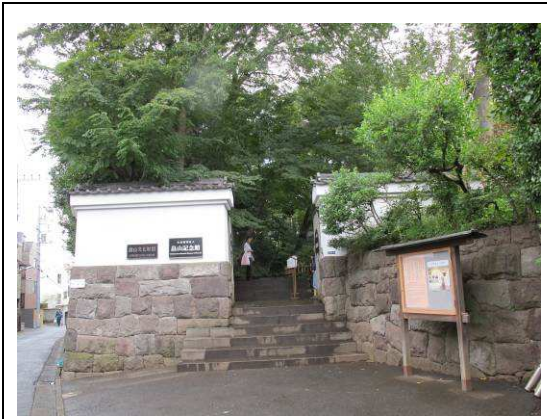
圖 3. 畠山記念館 (東京)