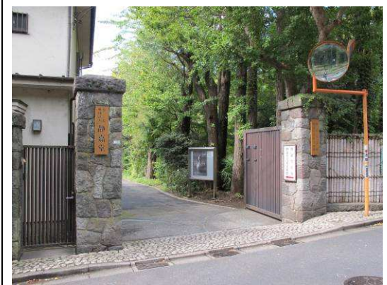
圖 5. 靜嘉堂文庫美術館 (東京)