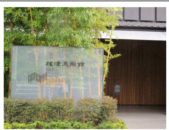
圖 4. 根津美術館 (東京)