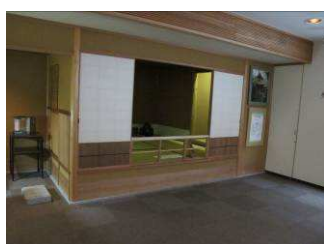
茶室（仿建「又隱」茶室）