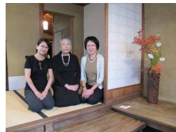
中間為花道展作者

花道創作展也正與記念館的茶道文化展相互輝映，讓來館的遊客加深對日本茶道的認識，並享受到雙重的樂趣。