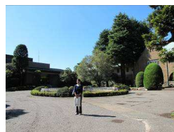
左側美術館右側靜嘉堂文庫

10 月 16 日上午驅車前往東京近郊的靜嘉堂文庫美術館。從公車站沿著山坡步行約 15 分鐘穿過樹林抵達入口處。該館主要館藏品是以日本著名三菱財團的社長的收藏為主，目前藏有 20 萬冊古籍及 6,500 件