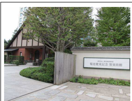
圖 1. 拜訪菊池寬實記念智美術館館長林屋晴三教授 (東京)