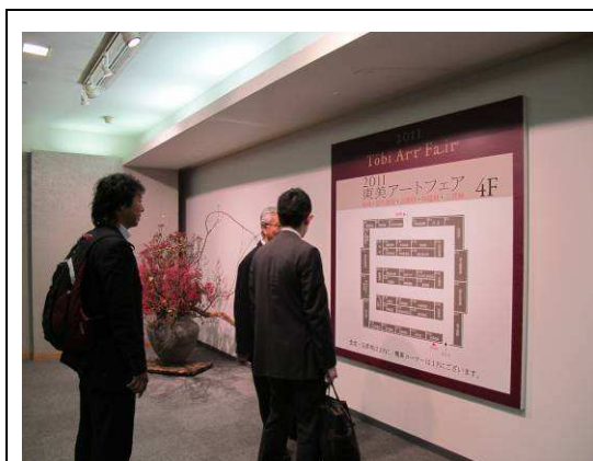
圖 2. 2011 東美藝術博覽會四樓美術商攤位地圖指南 (東京)