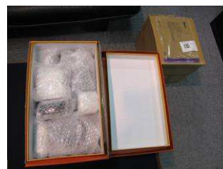
外側再進行安全包裝