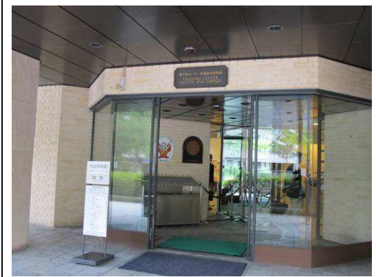
圖 7. 裏千家茶道資料館入口 (京都)