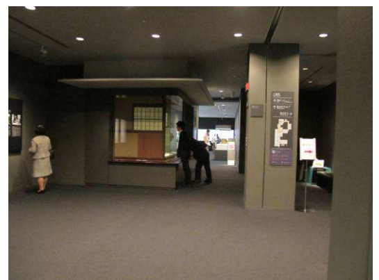
圖 6. 三井記念美術館館內 (東京)