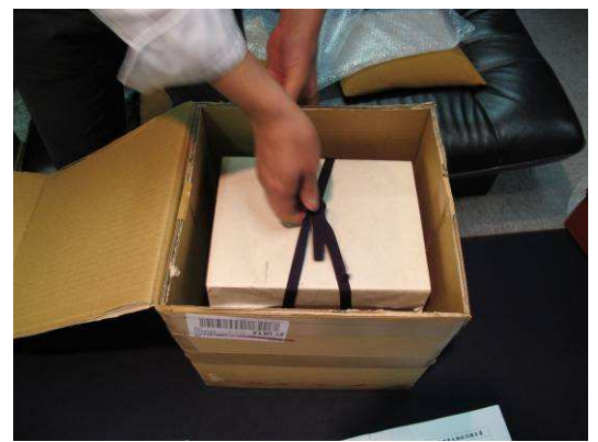
圖 8. 包裝煎茶道文物 (京都)