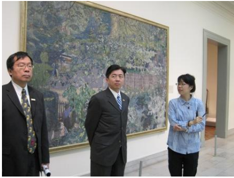
參觀芝加哥美術館。