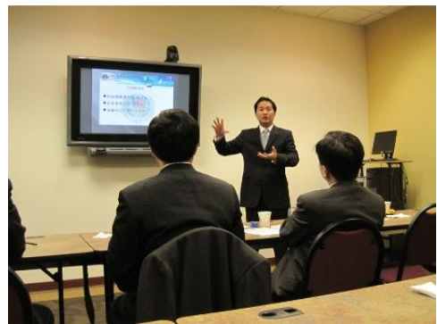
僑教中心陳主任提出臺灣書院推 動建議