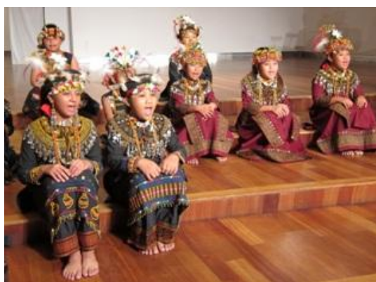
排灣族小朋友以傳統歌謠祝賀臺 灣書院的設立