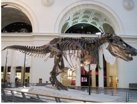
費爾自然史博物館的鎮館之寶- 暴龍蘇