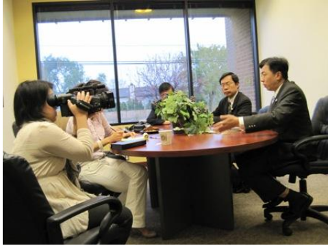
盛主委接受芝加哥華文媒體專訪。