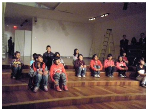
泰武國小古謠傳唱隊綵排