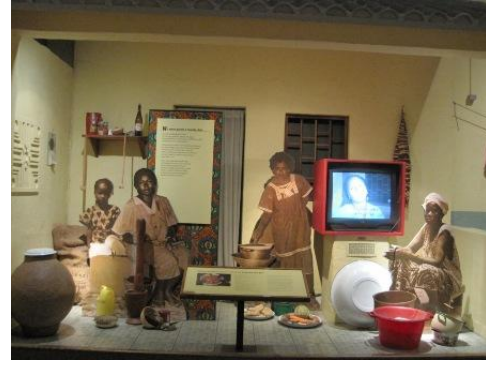
對於人類文化的展示，多以實境 模擬實境輔以影片方式，展現器 物在文化背景下的相關知識。