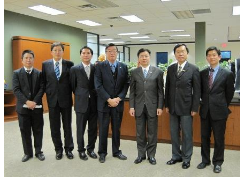
與芝加哥辦事處、僑教中心同仁合影留念。