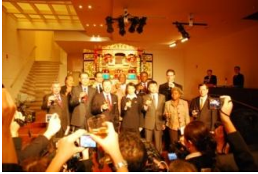
禮成，全場舉杯祝賀臺灣書院順利成功。