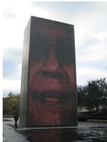
不噴水的噴水池，畫面仍然會定時的更換