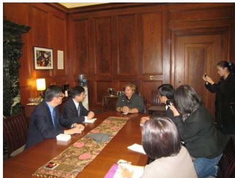
拜會芝加哥文化局