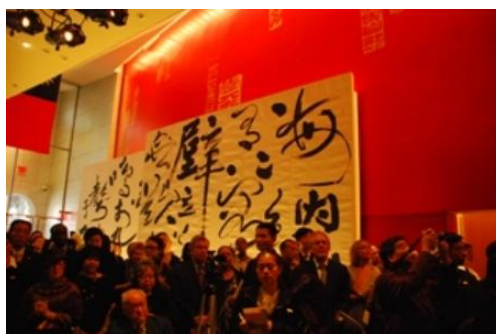
開幕當日中外貴賓雲集