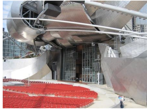
傑·普利茲克音樂廳