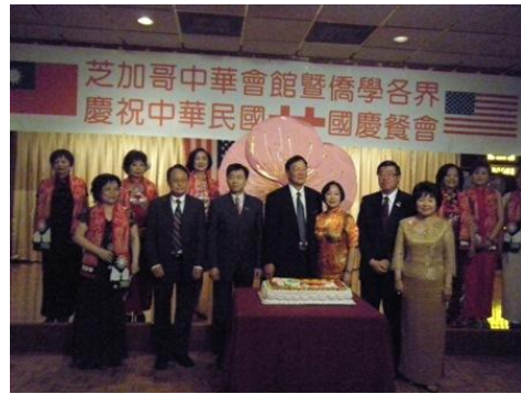
與會貴賓合影留念