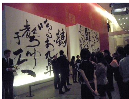
一樓大廳展有書法家董陽孜巨幅 書法作品