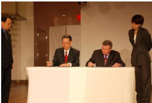
與 Scranton 大學簽訂聯絡點意向 書。