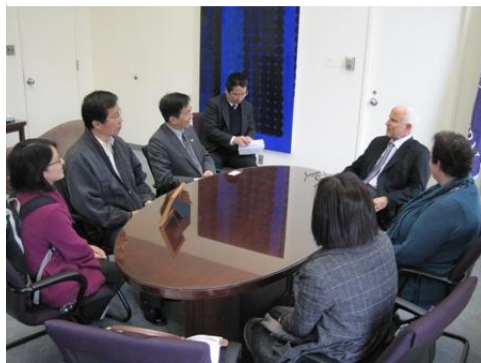
拜會西北大學校長