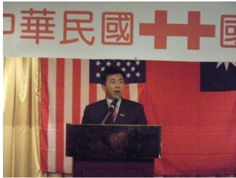
盛主委出席國慶餐會致詞。