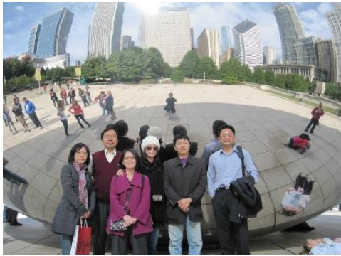
大家和「雲門」的鏡面芝加哥都市映影合照。