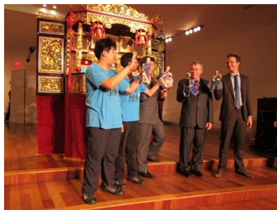
請貴賓上臺體驗操弄布偶。