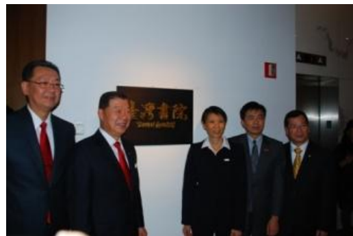
揭牌後，第一夫人參與合影。