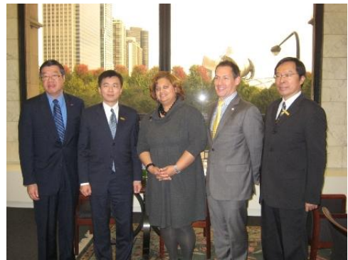
由左而右依序：申處長、盛主委、 B 局長、N 副局長、許耿修處長。