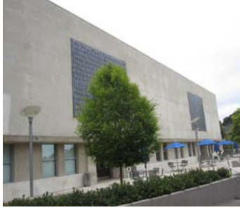
柏克萊法學院銅牌