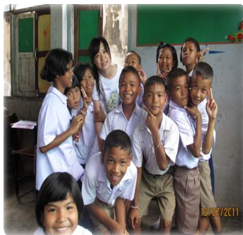
十一歲孩子在學校受教育