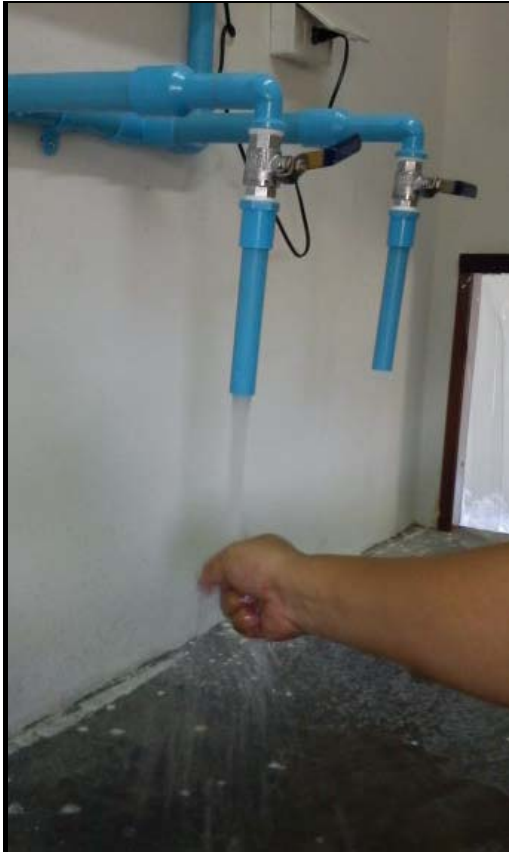
附檔二(學校的濾水設備)