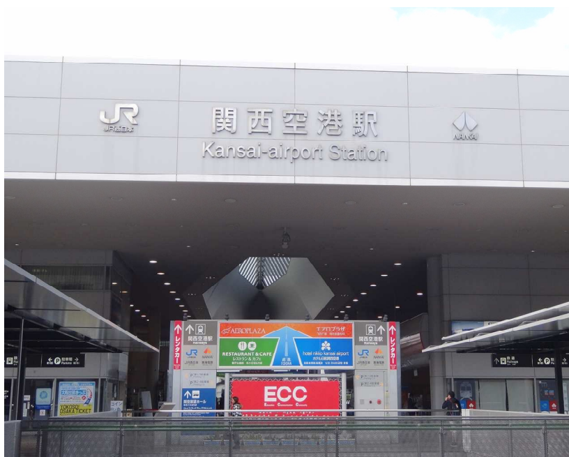
照片 1. 抵達大阪關西機場

此行作者單獨出發，10月26日自台北出發至大阪關西機場，再搭乘 JR 機場線到達梅田轉運站，換乘地鐵至研討會會場所在的飯店 Ramada Hotel。沿途英文幾乎行不通，地鐵站名亦無英文廣播，因此還是得靠漢字以及比手畫腳的方式，才總算到達；此後幾天的行程亦是如此。儘管語言的部分有障礙，但作者沒有怯步，放棄參觀日本近畿地區世界遺產與名勝的機會。會議於10月30日傍晚六點結束，作者於10月31日的傍晚搭機返台。