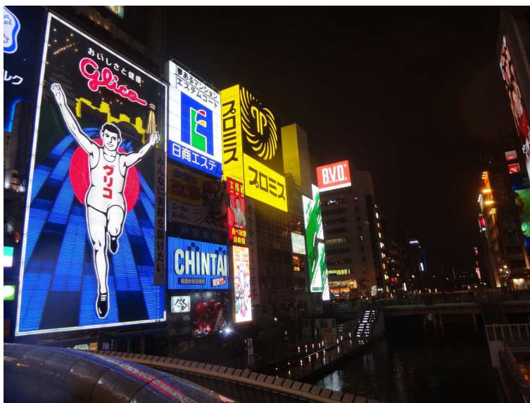
照片8.大阪市區道頓堀

究人員在國際研討會的發表機會與出席意願將會減少，此對於提升台灣研究方面的國際化與能見度影響不可謂不小。少了國際交流的機會，研究人員對於語言以及研究議題的磨練機會也相對減少，因此著實希望台灣的研究人員出國交流能得到鼓勵與資助。