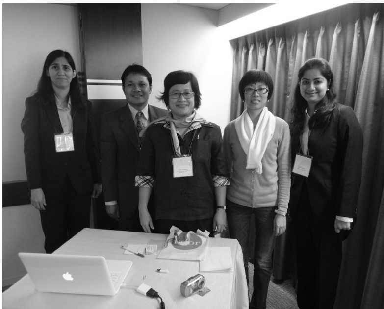
照片 7. 與不同場次的發表者合照

ACE 的口頭發表、海報發表、及演講等，會於明年一月出刊；對於 ACE 會議有興趣者，則可上相關網站 http://ace.iafor.org/ 進行查詢。後續 ACE 將把論文發表者的投影片放置網站上，而會議論文發表的場次及發表者聯絡方式亦可下載，如有興趣的讀者可寫電子郵件與作者聯絡。