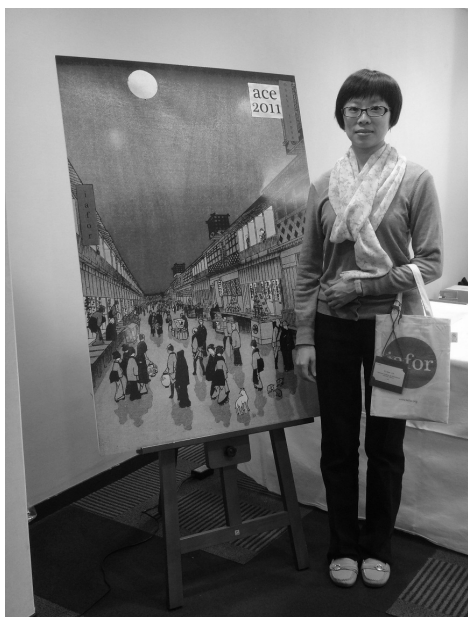
照片 3. ACE 會場

前兩屆的 ACE 研討會中，參與學者皆認為在全球化的腳步下以及本土意識的覺醒，兩相權衡下所產生的社會、經濟、文化、種族等問題，需要靠學校教育與終身學習來幫助問題的解決。因此第三屆的年會主題便擴大為 Learning and Teaching in a