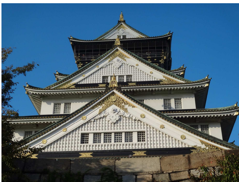
照片 2. 大阪城天守閣