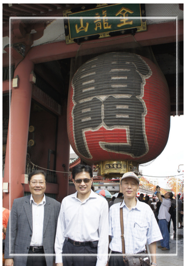
黃主委(中)與鍾總幹事(左)、謝副會長(右)在雷門前合影留念。

每一本介紹東京觀光景點的書上，都少不了印著「雷門」的大紅燈籠，這就是淺草觀音寺的入口，從雷門走向觀音寺，必經人潮洶湧的「仲見世通」，各式各樣的小販，賣著日本風味土產及小物；在這裡深吸一口氣，同時可聞到現烤仙貝的醬油香氣、人形燒的香甜氣味，以及裊裊升起的線香氣息。