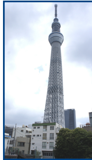
東京新地標「東京天空樹（Tokyo Sky Tree）」標高 634 公尺，預定於 2012 年 5 月 22 日開放參觀。

日本預定於 2011 年 7 月 24 日終止類比電視廣播的播送，換句話說，電視將全面數位化；而爲了降低東京都心內高樓大廈林立造成之電波傳輸障礙，且因應類比廣播終止之後，需要一座高度 600 公尺等級的高塔作爲地面數位電視（digital，地上デジタル放送）的電波發射站，因此量身打造了「東京天空樹」；甚至在大型災難降臨，導致有線傳輸中斷時，數位無線電波也可取而代之，發揮防災功效。黃主委在實際了解「東京天空樹」的功能後表示，我國也將在明年達成電視數位化播出，日本的作法值得作爲國內發展的參考。