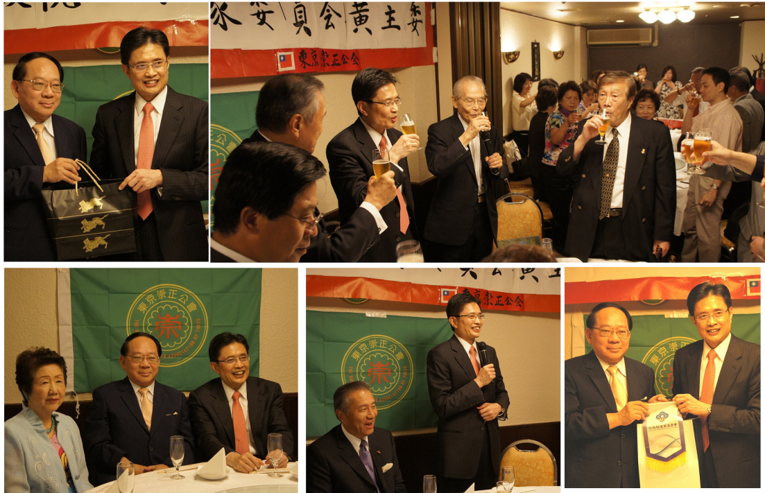
黃主委親自參加東京崇正公會交流大會，駐日代表馮寄台大使也到場共襄盛舉，兩位久未見面的老朋友相會，十分開心。黃主委也與東京崇正公會劉茂榮會長互換禮物，表達關心之情。