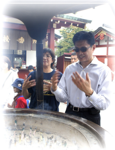
黃主委將淺草觀音寺香爐的香煙揮向身上，象徵將受到保佑。

根據統計，淺草觀音寺每年湧入近 4,000 萬名遊客，是日本地區寺院、神社參拜人數最多的地方。表參道入口處「雷門」左右分別設置「風神」與「雷神」，正式名稱爲「風神雷門」，是遊客必經景點。通過仲見世通後，還有一道左右設有「仁王（金剛力士）像」的「寶藏門」，舊時也稱「仁王門」；再向內走，則可抵達淺草觀音寺本堂。