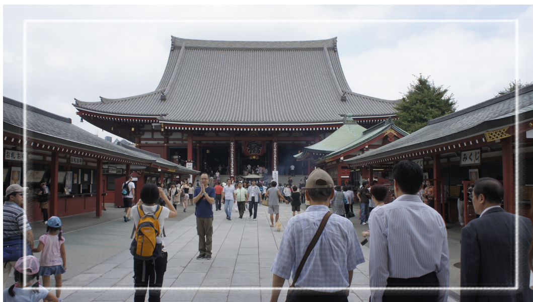
走進仁王門，便可見聳立的淺草觀音寺本堂，以及往來不絕的香客與觀光客。

淺草觀音寺首次於文獻出現，可追溯至鎌倉時代的《吾妻鏡》；近世則為德川家的祈願寺，更是關東少數的觀音靈場，參拜者眾。江戶時代後半，境內「仲間世」地區開始出現商店與芝居小屋，亦有賣藝人集中，成為當時庶民的娛樂中心。直至近代，淺草依然是平民的繁華街，娛樂場所非常發達。