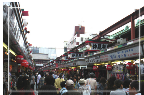
「仲見世通」利用字體及型態一致的招牌，以及具日本特色的紅色燈籠，使得環境整潔明亮。