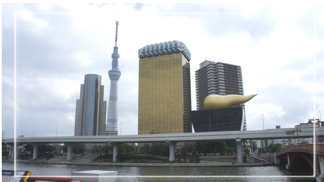
從東京汽船碼頭朝隅田川攝影，圖中高聳入雲的建築即為「東京天空樹」，而右側金光閃閃的建築則為知名啤酒廠朝日（ASAHI）啤酒總社。

近年來，在行政院客委會持續不斷的努力下，客語已逐漸在台灣扎根；正如同黃主委所言：「沒有語言，就沒有文化；沒有文化，族群就會滅絕了」，看見海外客家鄉親如此盡心為客語傳承努力奮鬥，我們深受感動，也將盡全力支持海外僑團推展客家事務，期盼下次見面，無論是兒童、青少年，或是事業有成的傑出鄉親，都能以「恁久好無」互相問候，以母語讓心更貼近。