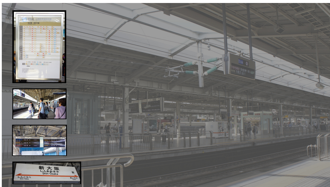
預定搭乘 9 時發車的新幹線 NOZOMI 號，本會黃主委及隨行人員於 9/18 早上八時許即在陳荊芳會長陪同下抵達新大阪站新幹線月台。