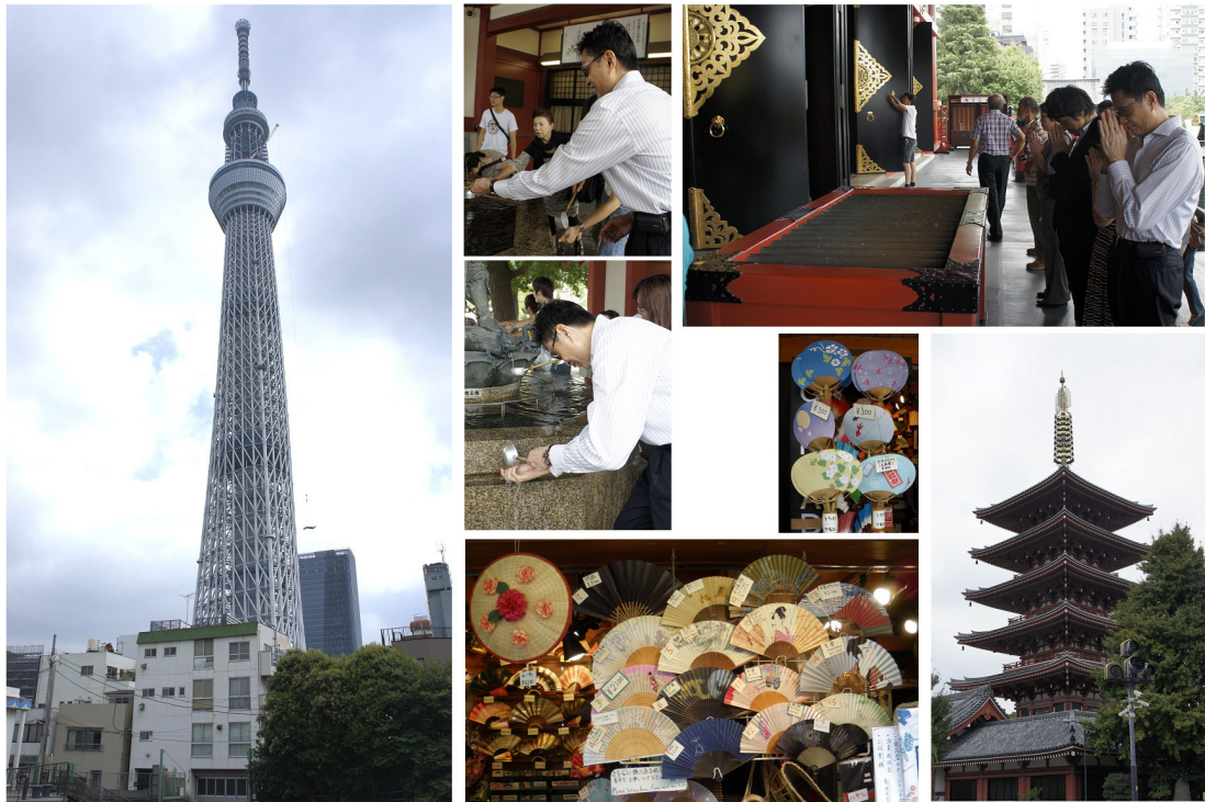
利用搭機前的空檔，黃主委走訪東京新地標「東京天空樹」以及富有古意的淺草觀音寺，展現出現代與傳統對比鮮明的日本文化。