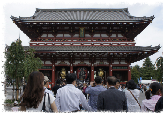
淺草觀音寺是日本地區各神社、寺廟參拜人數最多的地方。

目前本會依客家基本法，推動 69 個客家文化重點發展區打造「一客庄、一特色」，應可參考淺草觀音寺之模式，通盤考量產業、文化、美食及觀光景點等面向，以整體規畫打造客庄新印象，營造多元豐富文化之客庄環境，吸引遊客湧入，感受客家、體驗客家，進而繁榮客庄產業，帶動文化觀光。