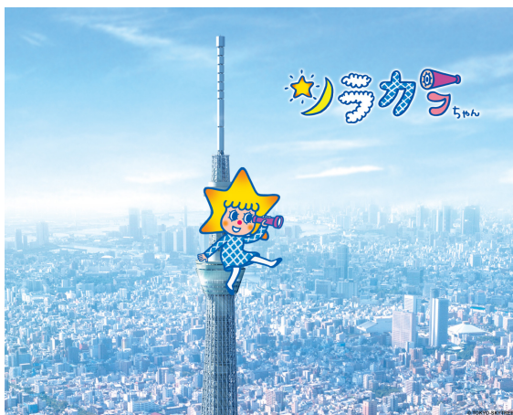
圖中坐在「東京天空樹」上的即爲虛擬代言人 Sorakara，充滿童趣的畫風，相當引人注目。

從「東京天空樹」的經營策略，讓我們想到，「六堆客家文化園區」即將於今(100)年 10 月 22 日開園，「苗栗銅鑼客家文化園區」也將於年底竣工，預定明年上半年開園；兩大國家級「客家文化園區」陸續和民眾見面，本會或許可參考「東京天空樹」操作模式，利用設計獨特、且具紀念價值的周邊商品，搭配相關媒體宣傳，吸引民眾前往參觀，一探客家文化的神秘面紗。