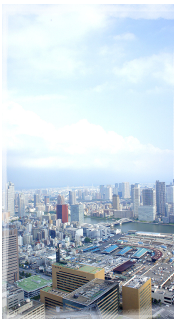
由日本汐留高樓向下拍攝的景色，井然有序的規劃，令人印象深刻。

除積極參與海外客僑活動，本會更應辦理各項人才培訓，吸引海外客家鄉親回台感受客家魅力。目前已辦理美食、歌謠、青年等各項培訓，在國際間頗受好評，未來可持續朝各面向發展，俾使學員成為海外客家種子，發揚台灣客家精神。