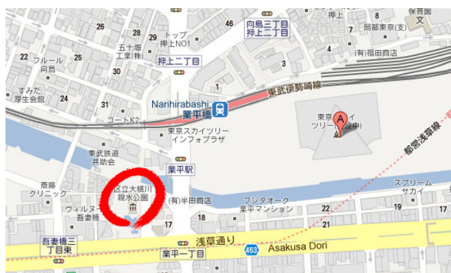
圖中A地即爲「東京天空樹」所在位置，而紅圈標示地則爲一親水公園，是遠眺「東京天空樹」十分知名的地點。

「東京天空樹」於2009年10月16日變更建造計畫，將高度提升至634公尺，因「634」在日語的發音，與東京於明治維新以前所屬的令制國——武藏國的發音相近(むさし，mu-sa-shi)。興建完成後，將超越中國廣州的廣州塔（600公尺），成爲全世界最高的自立式電波塔。