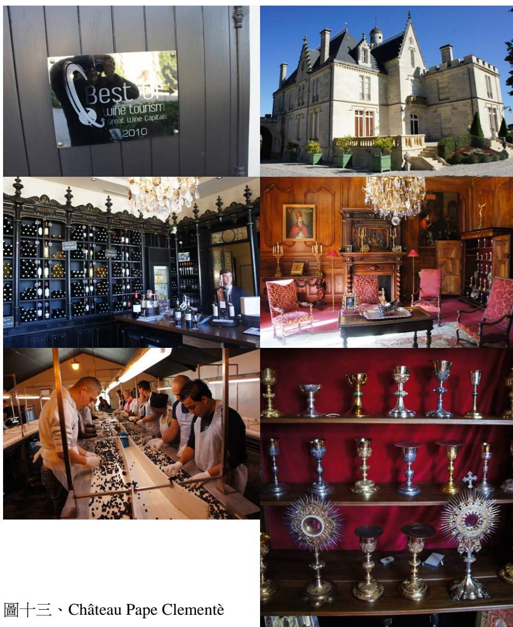
圖十三、Château Pape Clementè

獲選為 2010 年最佳酒莊導覽的 Château Pape Clementè，主要的賣點再於當初世界大戰時教皇曾經在此避難，因此城堡中留有許多相關的事物。其擁有者在全世界三十多個地方都擁有酒莊。他將原來為藥局所在的建築物改裝成專門供遊客品酒的販賣部，由帥哥侍酒師及美女解說員進行解說，同批參加導覽的外國人再試喝後買了不少酒。其酒體較為紮實但稍嫌甜美細緻不足。