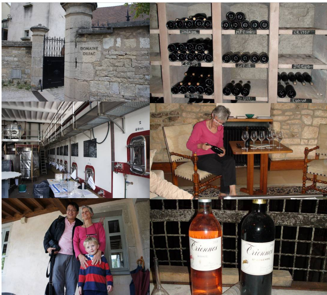
圖七、Domaine Dujac 酒莊

由美國媳婦 Dujac 夫人導入的新式經營理念，正極力收購葡萄園以擴充規模的 Domaine Dujac，其酒廠雖然規模不大，但一瓶酒動輒五千臺幣以上，價格不斐。Dujac 夫人詳細的介紹了當地的葡萄酒分級評鑑制度與執行結果並接受提問，還親切的帶領我到酒窖參觀，並到他家裡客廳進行試飲。Domaine Dujac 在釀酒時詳細記錄了每個步驟，且每一年製作的葡萄酒都會留下數罐樣品以作為試驗比較，可自行檢討釀酒方式是否合宜，天候及年份所帶來的影響等，這點和臺灣認真的茶農並無不同。其產品特色為酒體架構完整且甜美，是一般使用黑皮諾品種所無法釀出的口感，給人近似美國酒的華麗甜美感覺。但因為把酒都批給酒商販售而未自行販賣，想帶一些好酒回臺亦不可得。