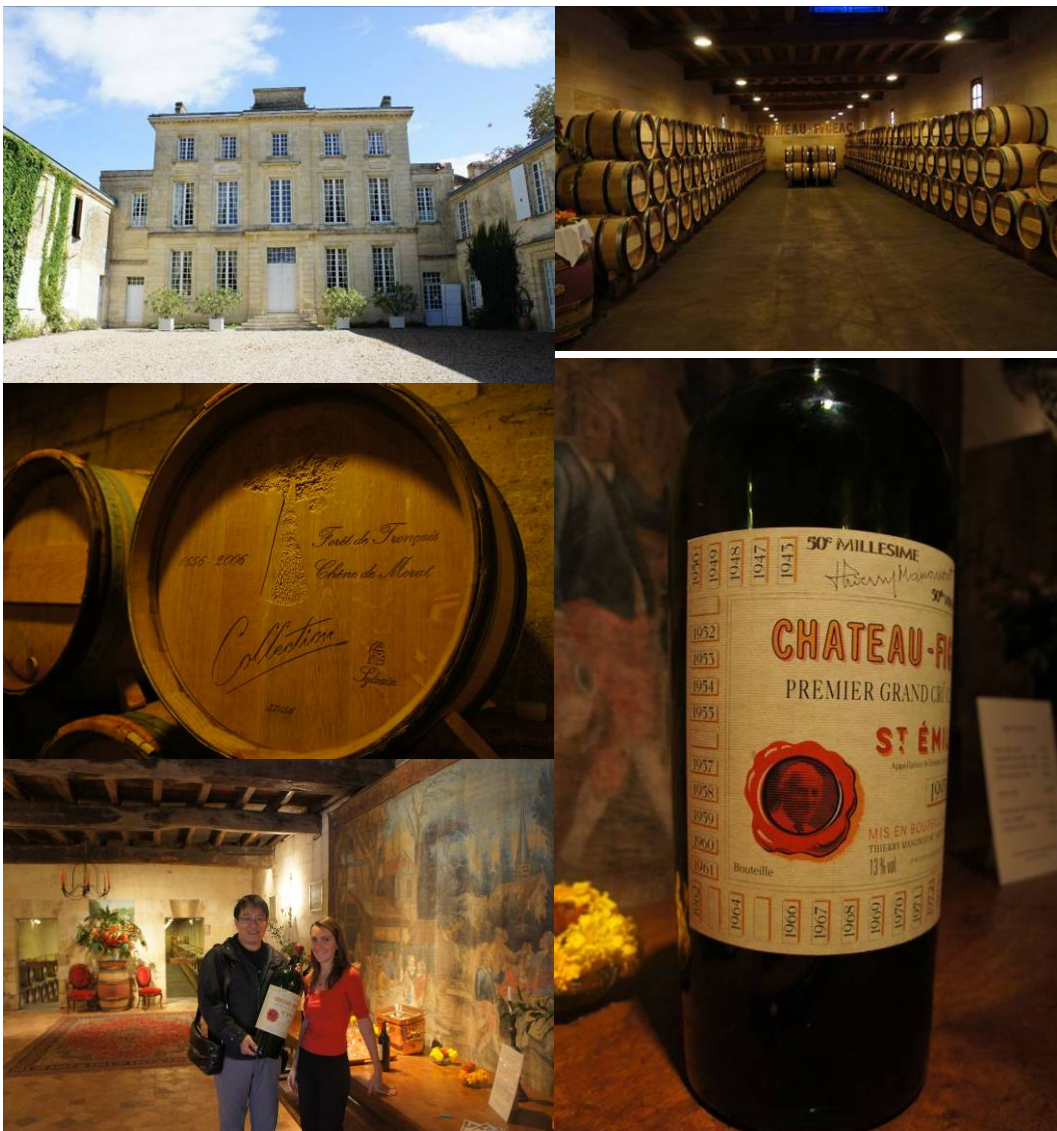
圖十、Chateau Figeac 酒莊

同樣位在波爾多的右岸，Chateau Figeac 比 Chateau Troplong Mondot 要更早就列級一等特級酒莊等級 B，在中國大陸也頗有人氣，已有「飛爵堡」的諧音名稱，並且有簡體中文的介紹簡章文宣。Chateau Figeac 對於葡萄品質的管控相當嚴格，每年都使用新的橡木桶，有的時候年份不好（氣候不佳）就不會生產該酒莊的一軍酒。釀酒的葡萄品種除了梅洛之外，還加上了卡本內-佛朗這個品種以提高香氣，並且因常更換新的橡木桶，酒喝起來的口感較為柔軟而香氣十足。Chateau Figeac 也販賣自家的葡萄酒，不過數量跟種類較少，感覺上大部分仍是批給酒商販賣。