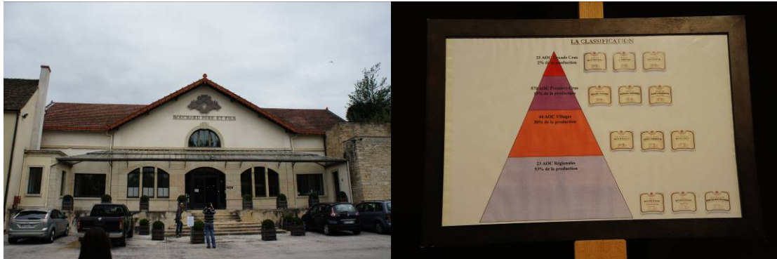
圖八、Bouchard Père & Fils 酒莊

在勃根地少數具有大型城堡的酒商，雙頭豬的家徽令人印象深刻，該城堡為其賣點，參加導覽的旅客絡繹不絕。酒莊內販賣部金碧輝煌，牆上有許多和葡萄酒有關的人物故事紀錄，並詳細列出所販賣的酒由那個葡萄園採摘，列在什麼等級，可以讓消費者一目了然。然商業氣息濃厚，對於一些非其商品相關的提問均不太願意回答。