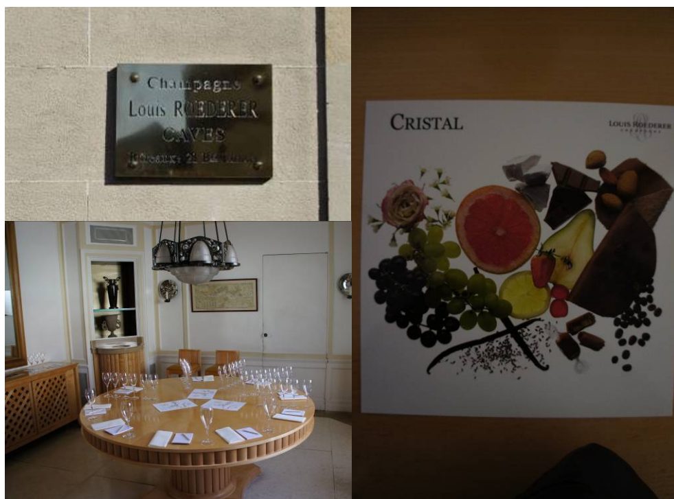
圖一、Louis Roederer 酒莊

創立於西元 1776 年，是香檳區眾多生產香檳的酒莊中相當知名的一個酒莊，1876 年受到俄國沙皇亞歷山大二世的委託，釀造一款帝王專用的高級香檳。當時以透明的水晶酒瓶盛裝。現在這款香檳一般民眾也喝得到，高級香檳 Cristal（水晶）之名眾所皆知，但價格不斐。其酒廠內陳列了許多過去所使用的製酒器具，儼然一個小型的香檳酒博物館。大廳天花板由許多許多水晶燈所構成，光彩奪目氣勢非凡。在大廳旁邊設有可供參訪者試飲品酒的品評室，桌面上擺設了香檳杯與記錄用紙，牆面上掛了該廠從過去到現在的繪畫剪影與水晶香檳的照片。另外一點令人印象深刻的是，該廠針對水晶香檳的特有風味，以水果、香料等實物之照片來加以表現，可以讓參訪者快速瞭解水晶香檳的品質特色，此種表現方式值得學習。