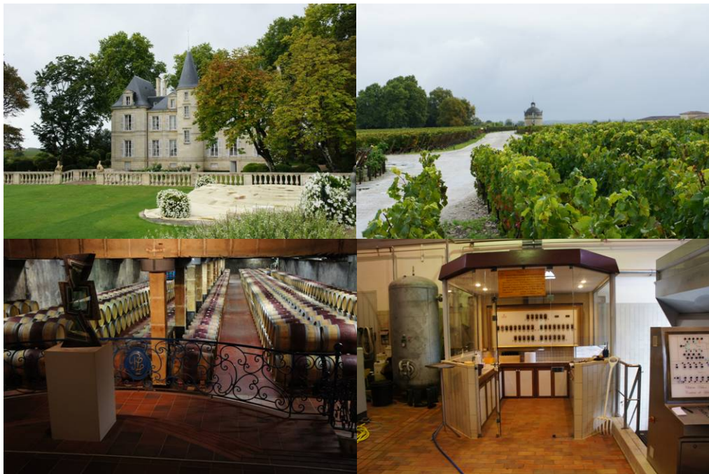
圖十一、Pichon Longueville Comtesse de Lalande 酒莊

酒莊的位置就在波爾多左岸一級酒莊拉圖堡的附近，兩家酒莊葡萄園比鄰而居的 Pichon Longueville Comtesse de Lalande 為二級酒莊，身為 Pichon 家族的一員，擁有富麗堂皇的酒莊庭園與現代化的釀酒設備。其產品酒體結構完整，有久放的潛力。波爾多左岸的酒莊規模往往較大，有詳細的導覽活動及自行販賣自家產品，價格雖比臺灣便宜，但二級酒莊的價格依舊不低。