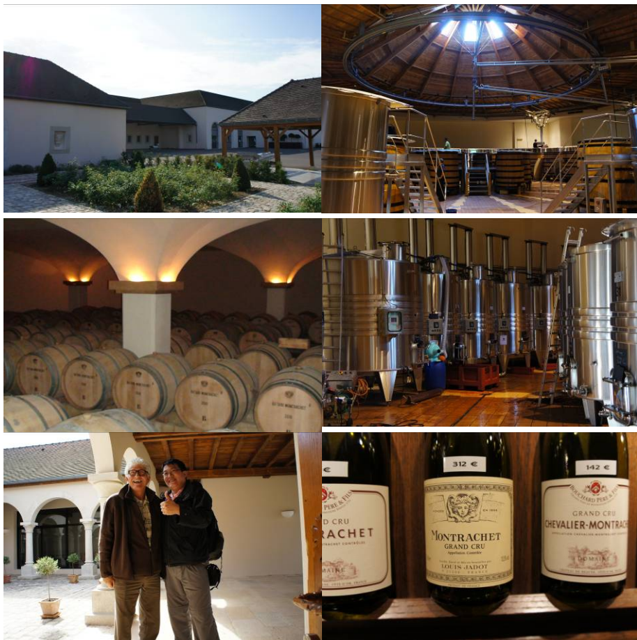
圖六、Maison Louis Jadot