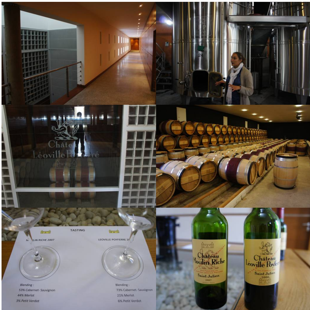
圖十四、Château Léoville Poyferré 酒莊

噴火狼的家徽令人印象深刻，同樣是波爾多二級酒莊，Château Léoville Poyferré 在解說員親切的導覽下，讓我無論在採收製造，設備參觀方面都覺得收穫良多。擁有像是情報組織基地般安全感的酒窖以及詳盡豐富的文宣資料可供索取，無一不讓我覺得不虛此行。仔細一問才知道原來導覽員學過中文，日後將會被派到中國大陸去進行推廣，所以對我們也十分親切。酒質甜美而豐富令人驚艷，且相較於在臺灣買有令人動心的價格，要人不買都難。