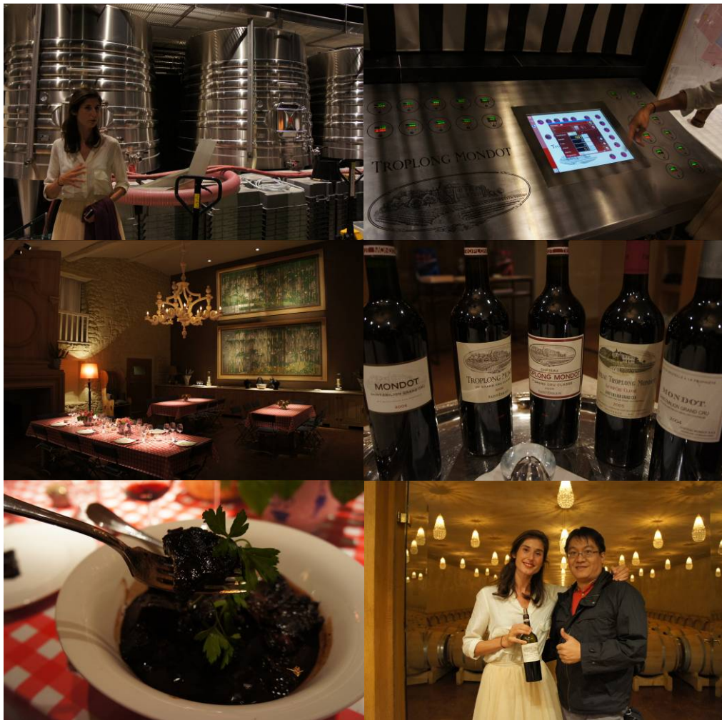
圖九、Chateau Troplong Mondot 酒莊

法國波爾多的料理：紅酒燉牛肉，一邊品嚐著 Chateau Troplong Mondot 所生產的美酒，真的是一大享受。不同於波爾多左岸以卡本內葡萄品種為主所釀成的酒體結構紮實單寧充足的酒款，波爾多右岸多以梅洛此品種為主，因此較為甜美宜人。Chateau Troplong Mondot 的酒在甜美之中仍可體會到完整的結構性與層次感，絕不是一款單為了討人喜歡所釀的甜美酒款。可惜同樣的酒也是交給酒商販賣，酒莊自己並不對外販售自己生產的酒。