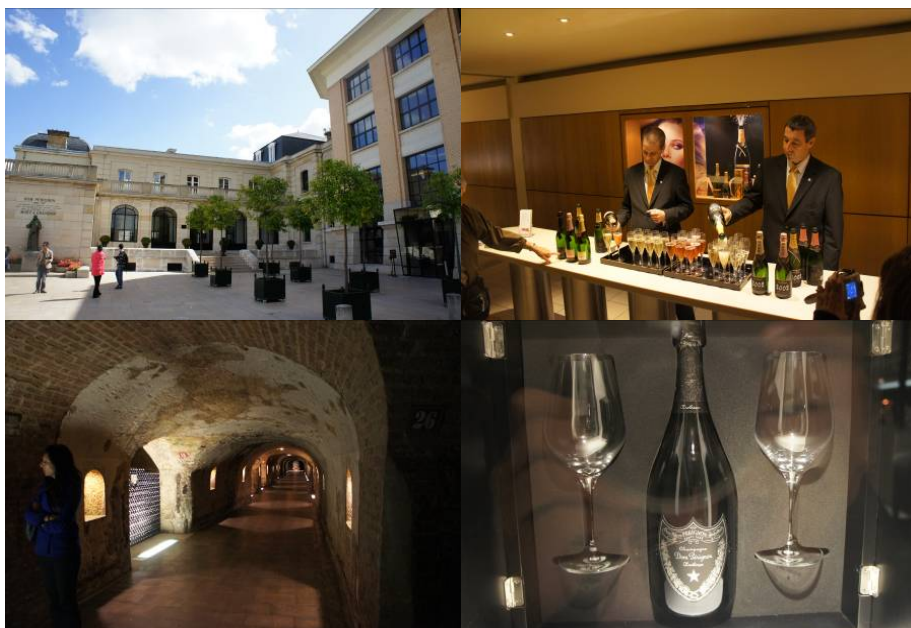
圖四、Moët & Chandon 酒莊

生產堪稱香檳的代名詞：世界知名度最高的香檳王（Dom Perignon）的酒廠，傳說在 1668 年某家修道院的修道士 Dom Perignon，將未發酵完的葡萄酒塞上軟木塞繼續放置，無意中形成了氣泡酒，經過不斷研究後確立了保存氣泡的方式。而 Moët & Chandon 酒莊在 1797 年買下了該修道院的葡萄園，並讓香檳正式問世。當時的顧客都是王宮貴族，因此香檳王的名聲立刻傳遍各地。現在由 LV 集團所買下，更加強其行銷，導覽介紹有中日英法等各國語言，除了推出香檳王的各式限量產品，也提供較平價的香檳供消費者購買。