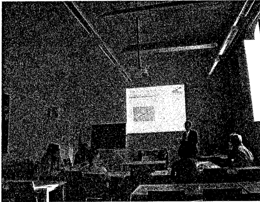
圖一 本報告報告人發表文章

此次研討會在兩天內共分為六個場次進行，本報告報告人於9月30日下午針對「Spatial Dynamics of Industry Cluster: The Case of Taiwanese Businessmen's Investment in China」一文之研究成果進行報告，其他詳細內容請見本文後所附議程表。除了研討會中主題論文發表與討論之外，剛就任維也納大學副校長的Weigelin Schwiedrzik教授(前任語言與文化學院院長)，也共同參與討論未來的合作方式與經費來源等問題。