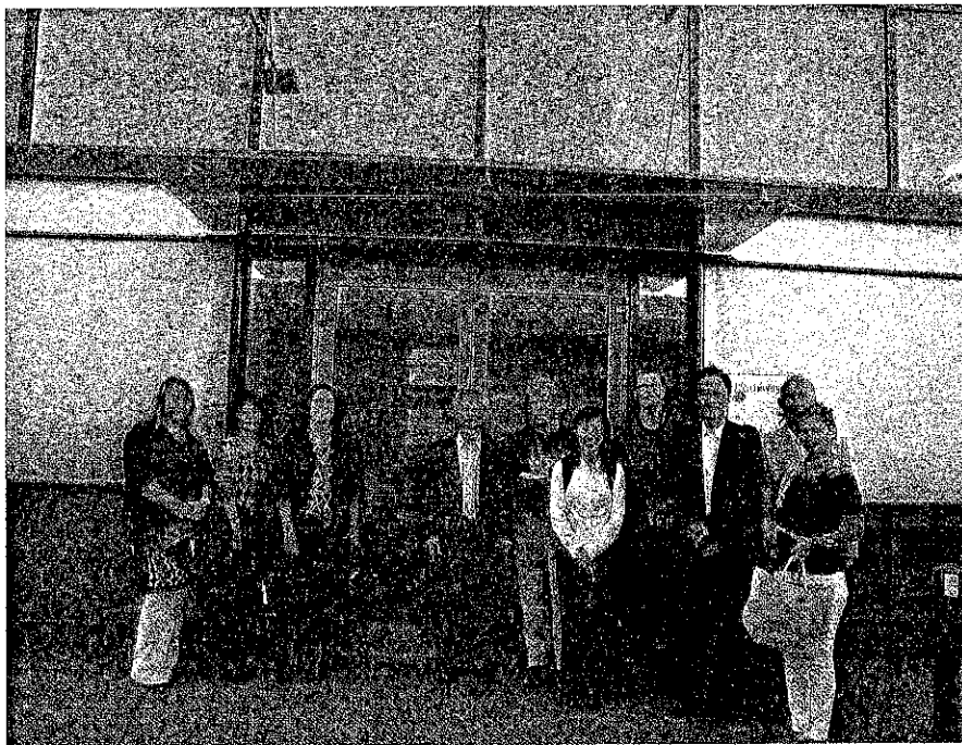
圖二 政大臺灣研究中心與參加會議成員