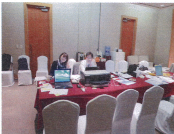
【委員會主辦國秘書處辦公室】