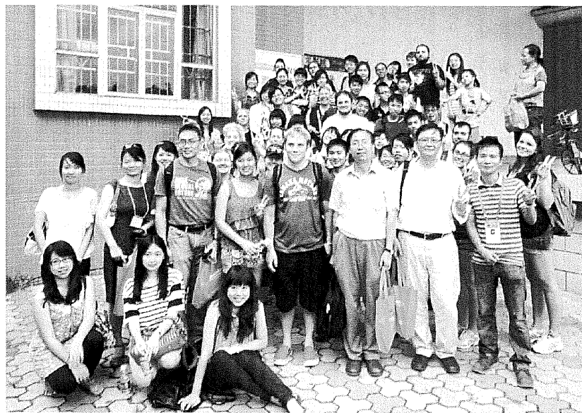
兩岸四地以及美國同學於廣州社工機構實地考察