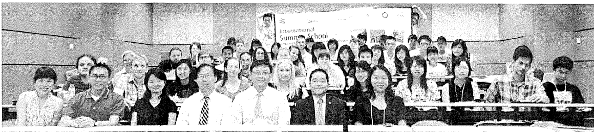
政大、美國 Bridgewater State University、香港教育學院師生於開幕儀式合影