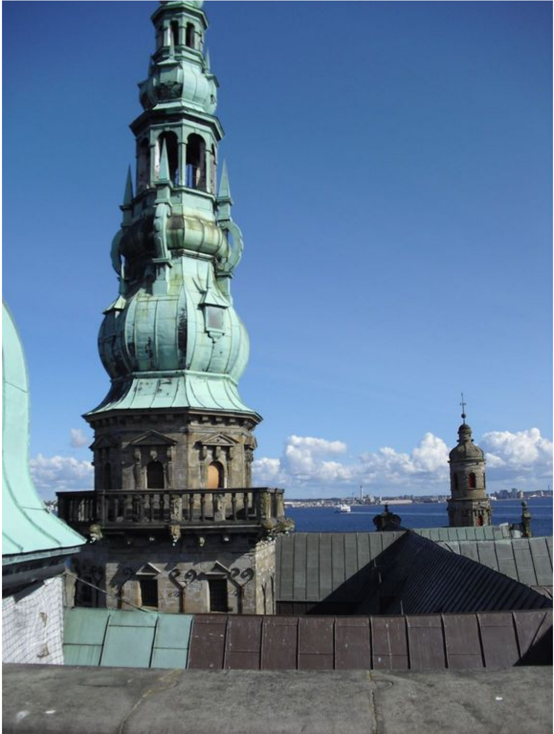
克倫堡頂的塔樓，不遠處海峽彼端的陸地即是瑞典國土—赫爾辛堡