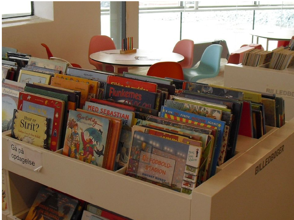
童書繪本琳琳瑯瑯滿目