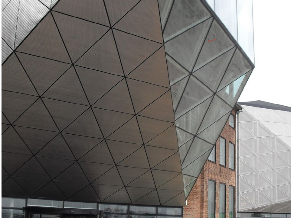
藝文中心外觀，現代前衛的造型

赫爾辛格 Helsingor 在哪裡?她是丹麥西蘭島北端的一個小城,距哥本哈根 30 分鐘車程,人口僅約 3 萬 5 千人,相當臺北市大安區 1/9 人口,台北市 1/75 人口。可是她的藝文中心,真的就像誠品書店、臺北市美術館跟 IKEA 傢俱的綜合體。