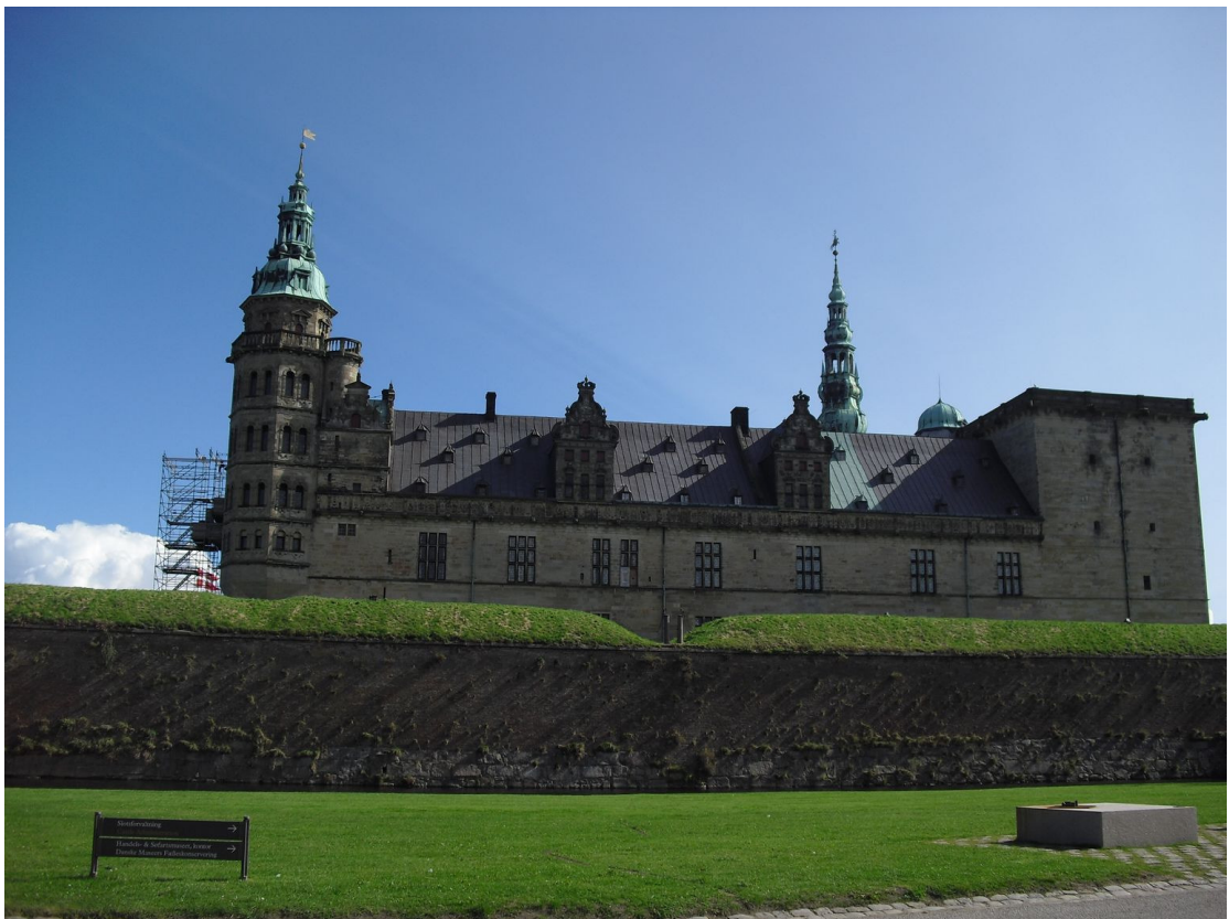
克倫堡外觀，左方鷹架係年度維修工程，右方為 1585 年克倫堡初期模型