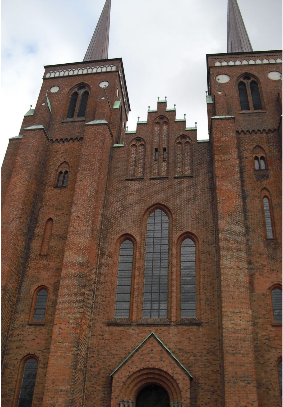
羅斯基德大教堂簡單雄偉的建築造型，讓人感動不已…