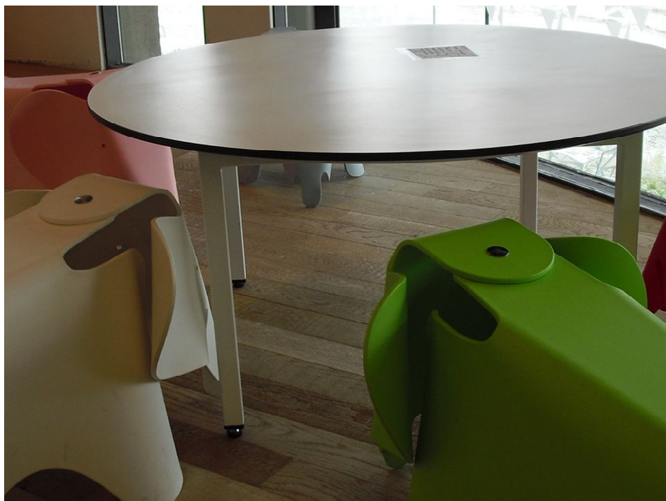
傢俱坐椅兼具舒適與美感