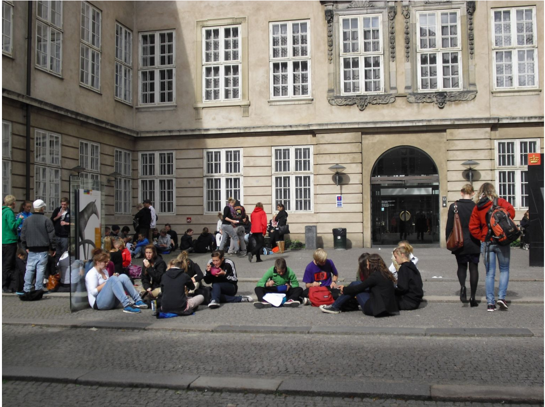
丹麥國家博物館外席地而坐的青少年學生