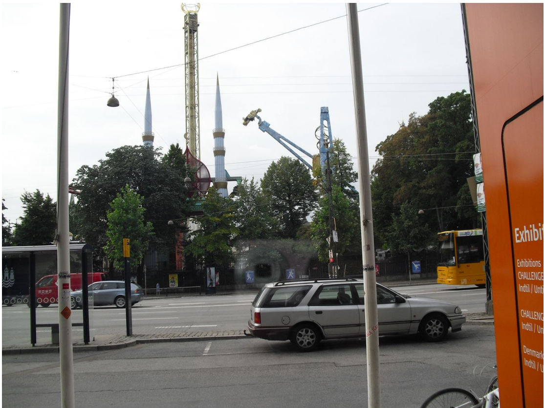
丹麥設計中心對面就是 TIVOLI 遊樂園，或許創意也是遊戲??