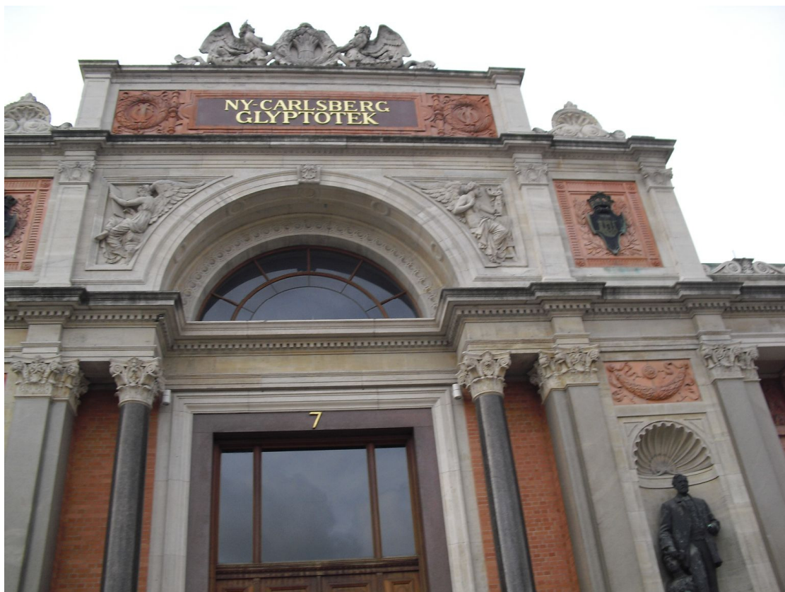
嘉士伯美術館外觀，位於安徒生大道 7 號

訪客一進入美術館大門，很自然被美麗的中庭吸引，裡面種有高大的棕櫚樹和亞熱帶植物，加上建築內部空間寬敞，自然採光明亮，讓來自世界各地的訪客產生由喧囂塵世進入藝術殿堂的夢幻美感。在館內豐富多采的展品中，既有古代藝術品，也有現代藝術品。古代藝術品包括從公元前三千多年古埃及時代到五世紀古羅馬末期不同時期的雕塑品。在現代藝術品，人們可以欣賞到十九世紀以前丹麥和法國的油畫和雕塑。特別是其中有大量的莫內、高更、塞尚與梵谷等偉大藝術家的珍品，讓人流連忘返。