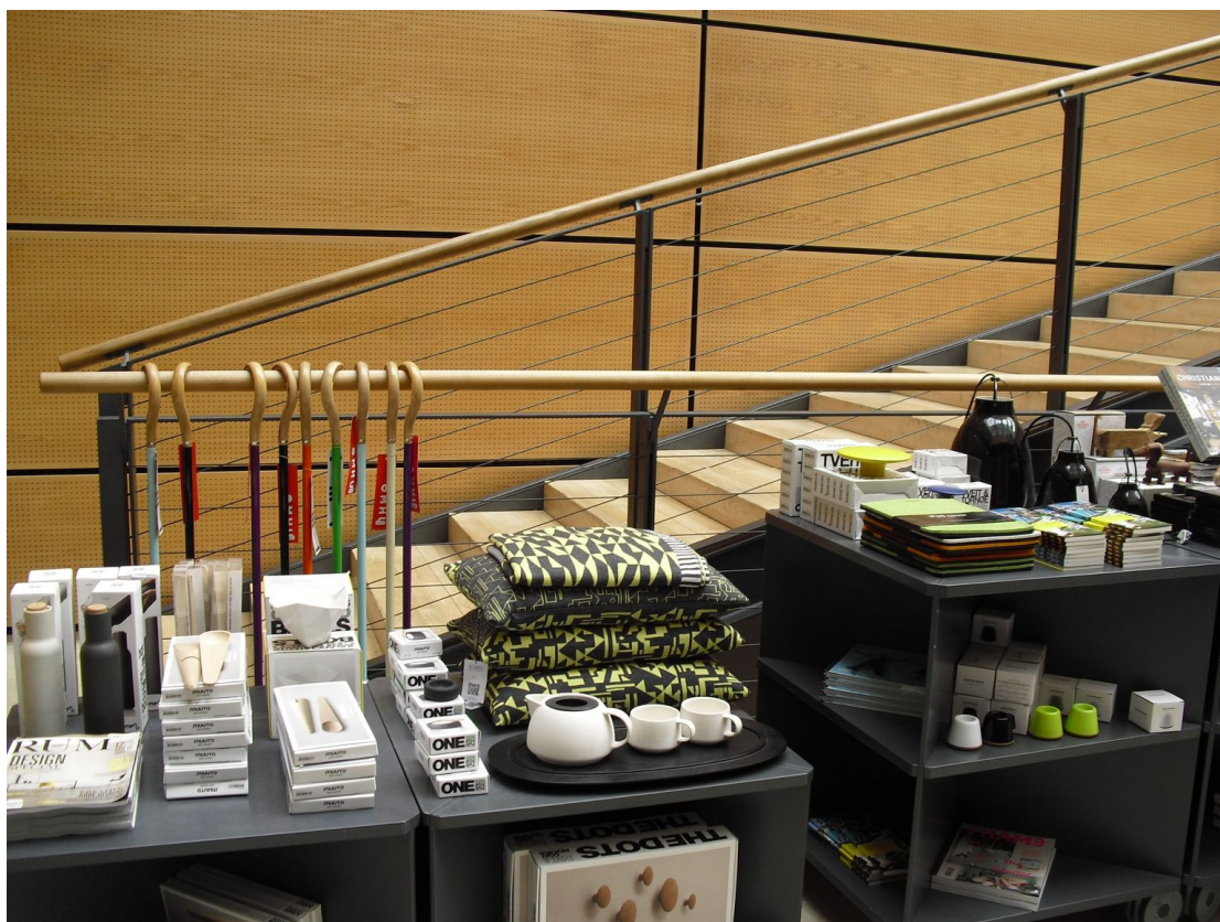
丹麥設計中心展售丹麥設計師的作品

丹麥設計中心建物內部僅兩層，彈性分為大大小小展覽區，讓參觀者就像走在設計師的創意裡，十分自在。設計中心每年大約有 15~20 個大小展覽，展覽主題不限於丹麥當地的設計師，也經常展出國外新潮設計作品。一樓展場旁的紀念品店有許多英文、丹麥文的設計書籍、雜誌和商品，另設有咖啡廳提供輕食、簡餐和咖啡等