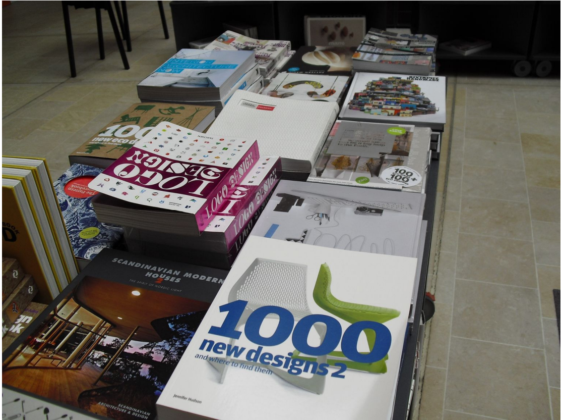
丹麥設計中心陳列的各式各樣設計用工具書