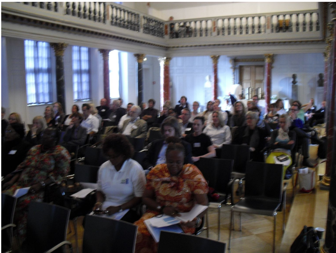
出席 2011 年會的各國代表，會場在丹麥國家博物館的會議廳