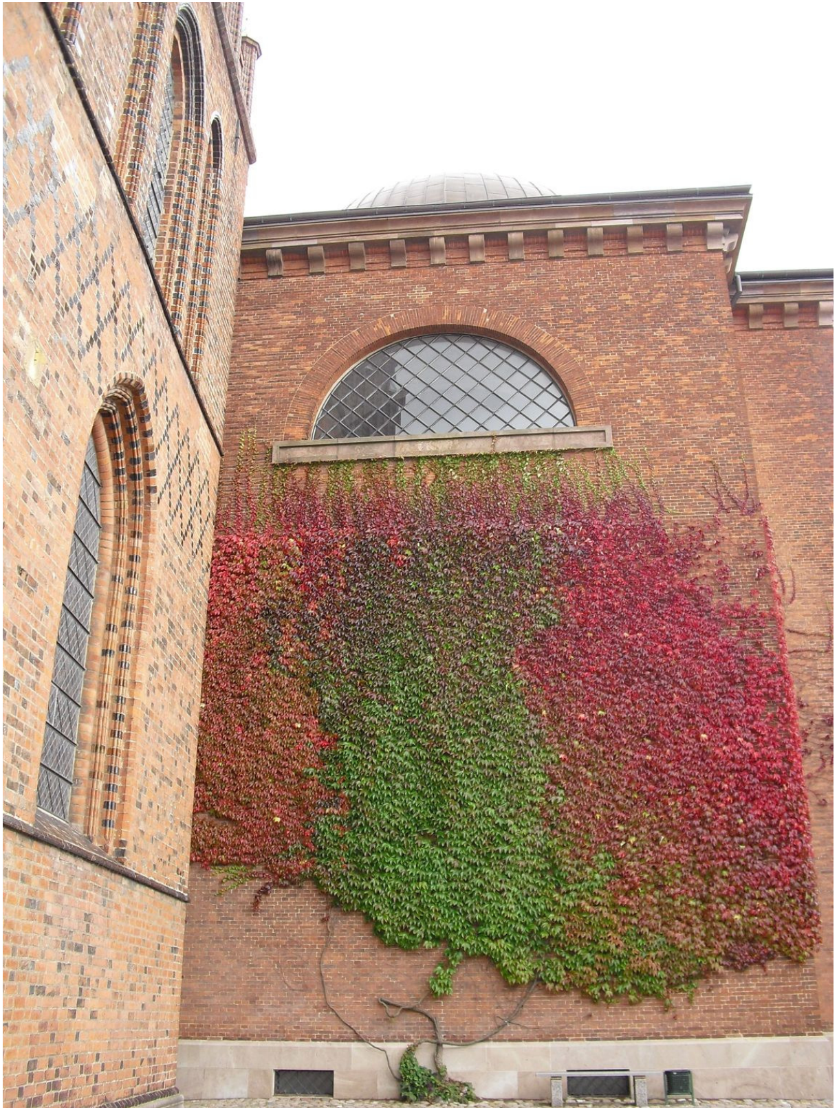
羅斯基德大教堂磚牆上的蔓生植物隨風搖擺形成特殊美麗畫面