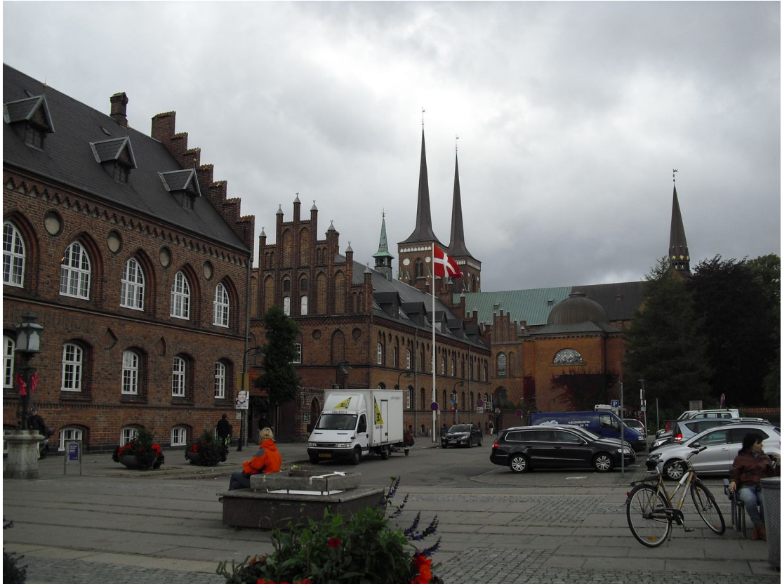
羅斯基德大教堂廣場及週邊創造出優雅舒適的氛圍