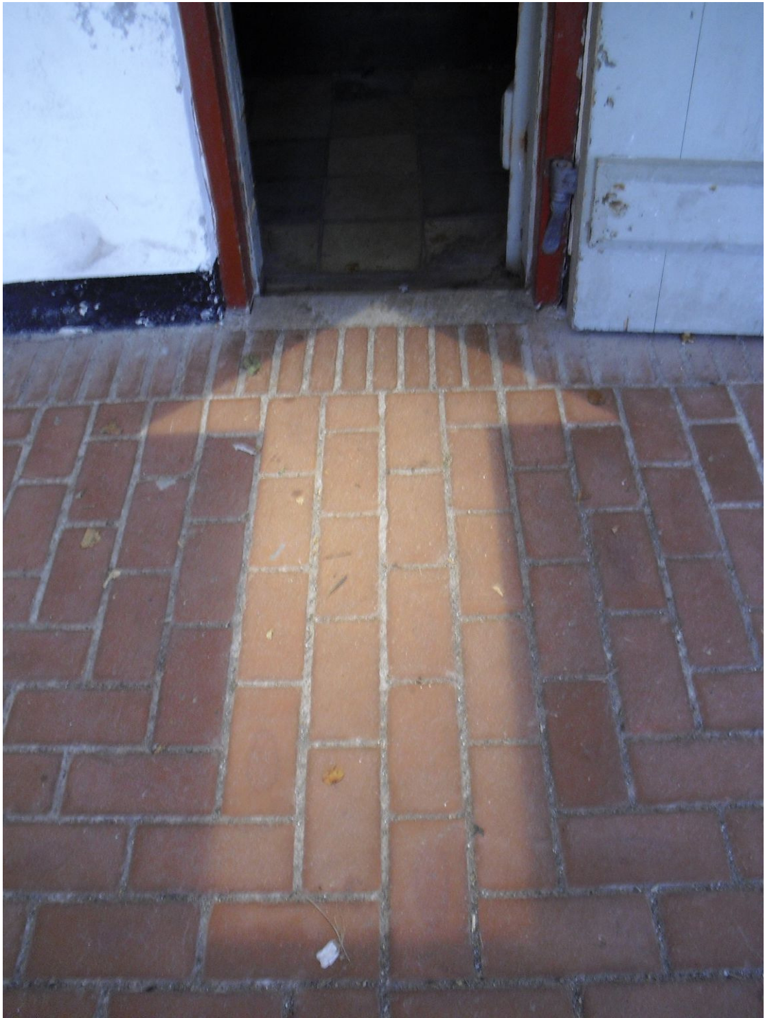
克倫堡古老地窖門外用燈光投射出箭頭指引參觀動線