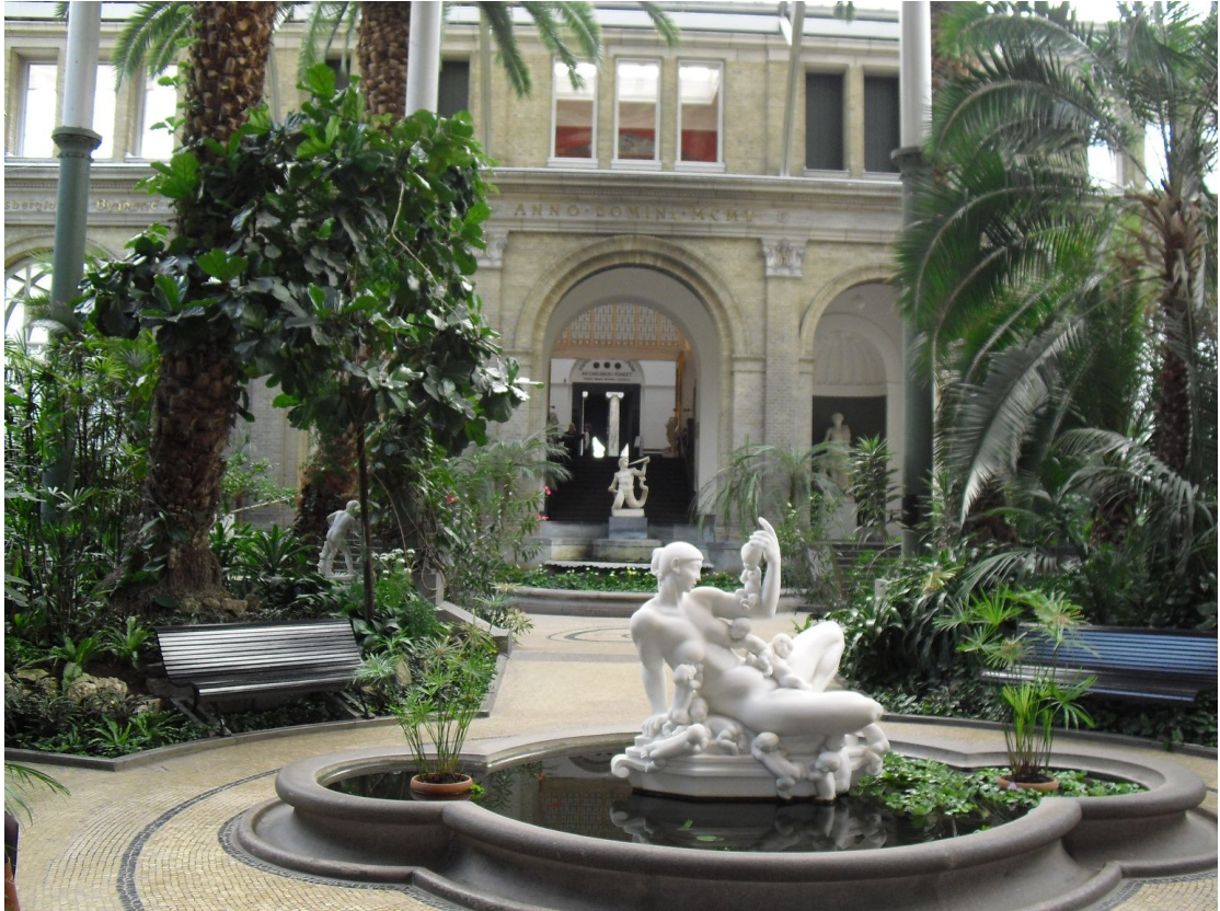
嘉士伯美術館中庭有如亞熱帶花園，搭配優美的人像雕塑