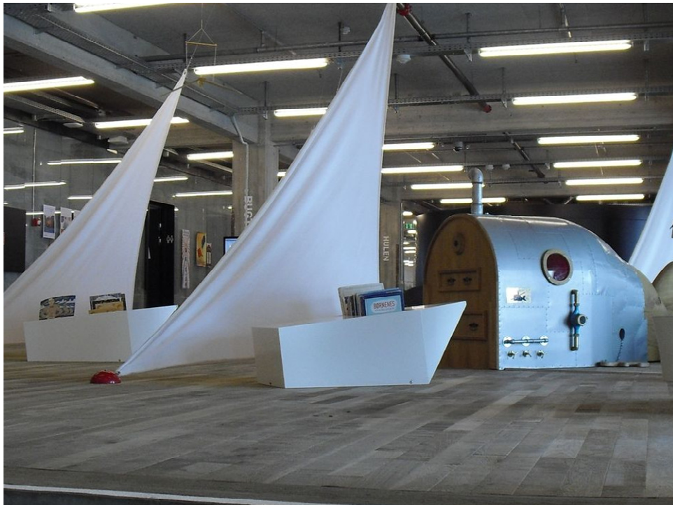
一進大門是兒童圖書館，然後不是書架，而是兒童遊戲區…