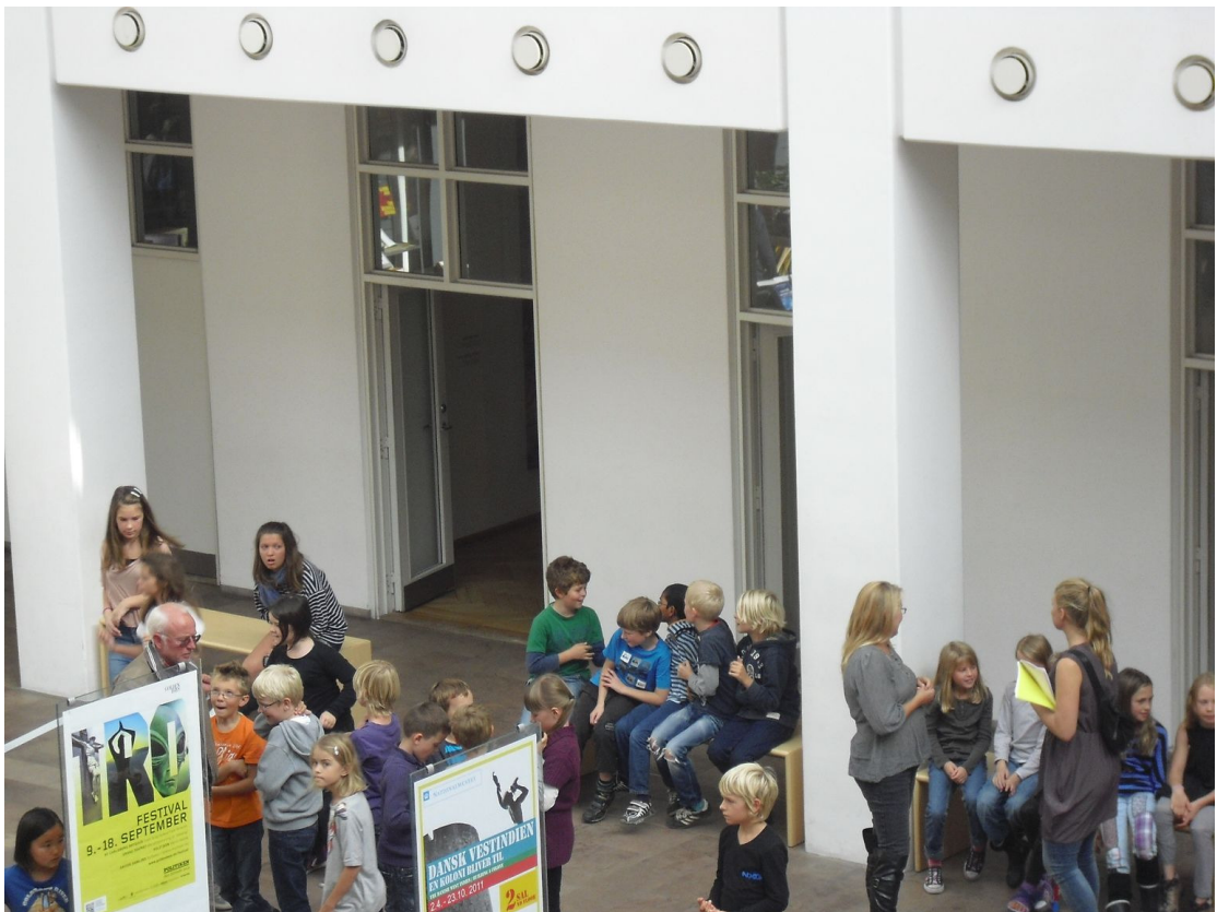
丹麥國家博物館內參觀的國小學童