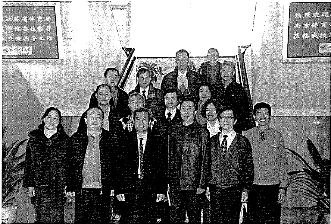
參訪北京體育大學全體團員合影（上圖），參觀該校奧林匹克陳列室（下圖）