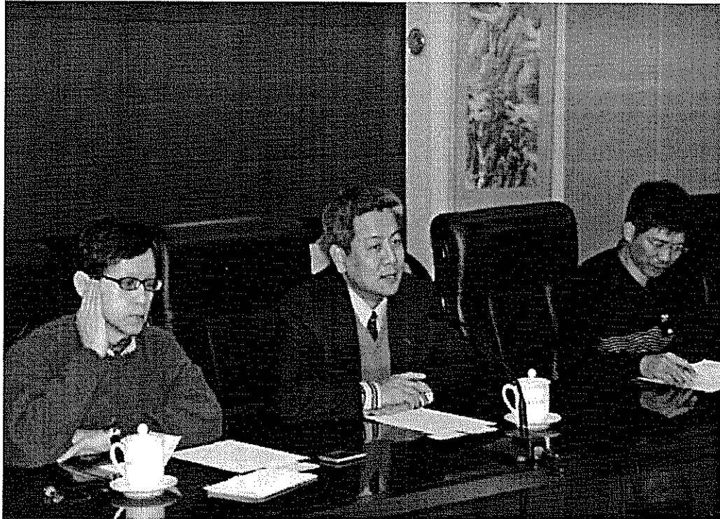
本參訪團拜訪大陸國家體育總局體育文化發展中心(下圖)並參與座談會(下圖)