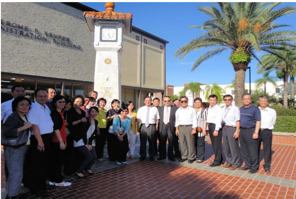
吳部長訪團於佛羅里達理工學院內行政院退輔會贈送之鐘樓前合影