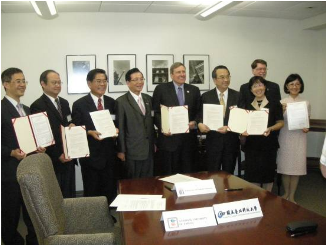
100年8月30日台美雙方校長簽約後與吳部長合影留念