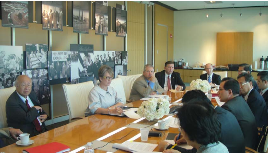
100年8月30日吳部長與阿肯色州教育廳及高等教育廳主管官員會談之二