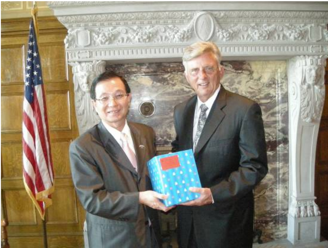
100年8月30日吳部長與阿肯色州 Mike Beebe 州長會談後互贈禮物