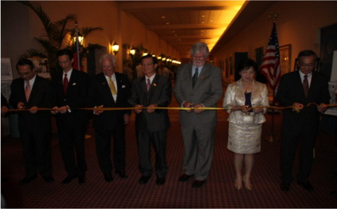
建國百年新聞影像特展剪綵