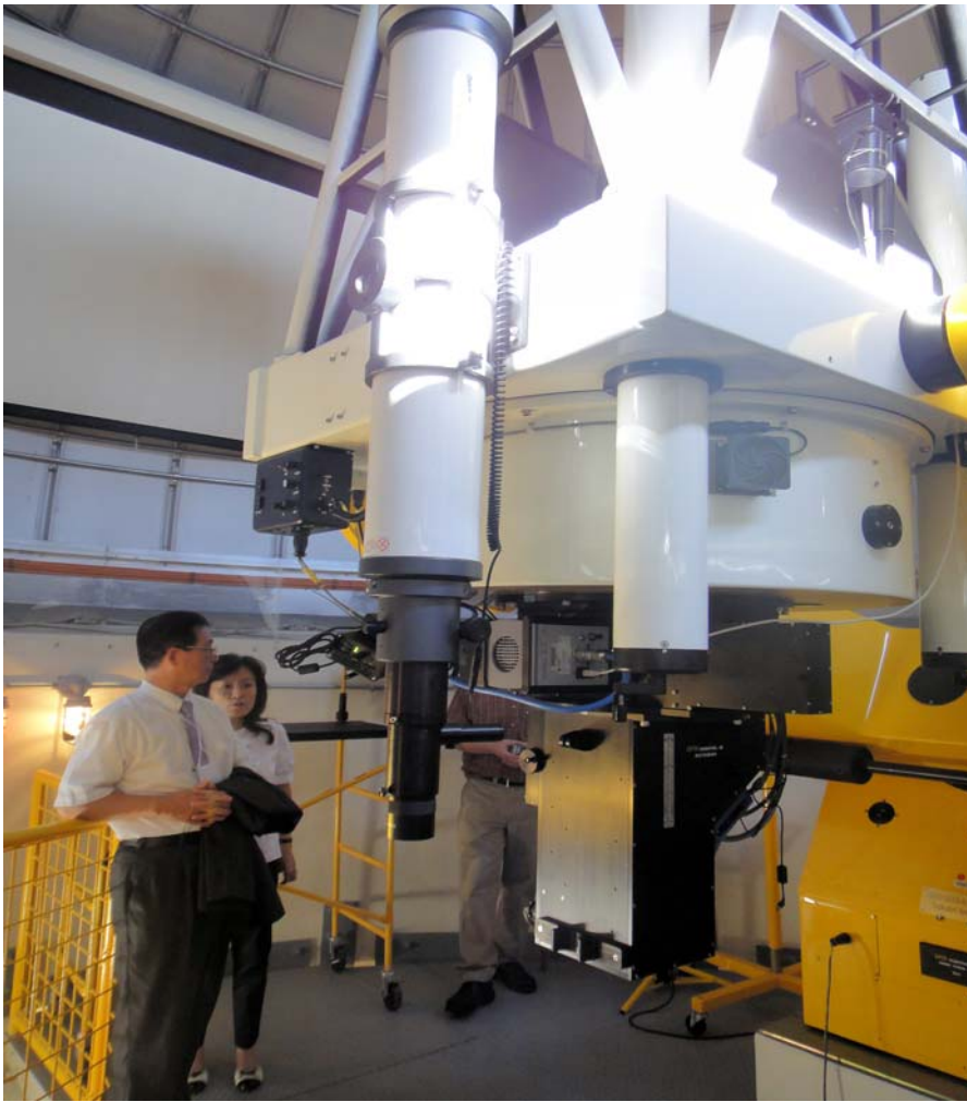
吳部長參觀 FIT 航空觀測站的奧爾特加望遠鏡（Olin Observatory Ortega Telescope）