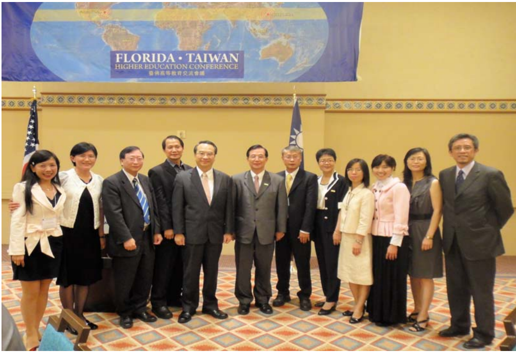
部長及林處長與美洲地區文化組長等合影