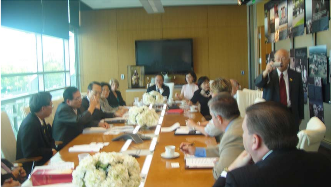
100年8月30日吳部長與阿肯色州教育廳及高等教育廳主管官員會談