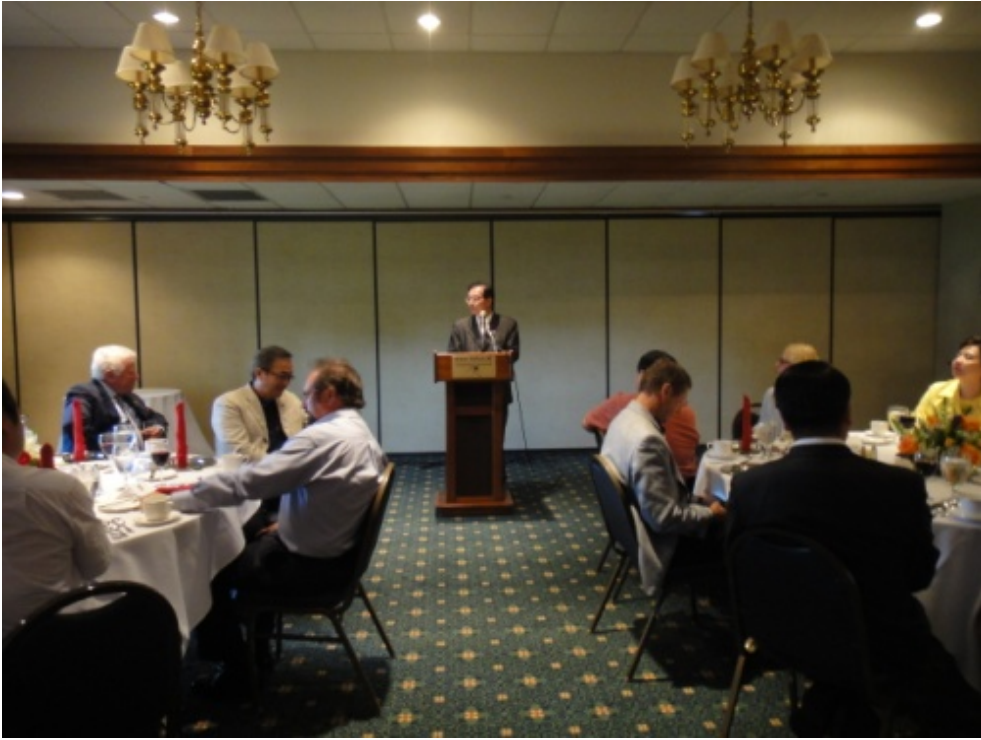
佛羅里達理工學院歡迎晚宴部長致詞