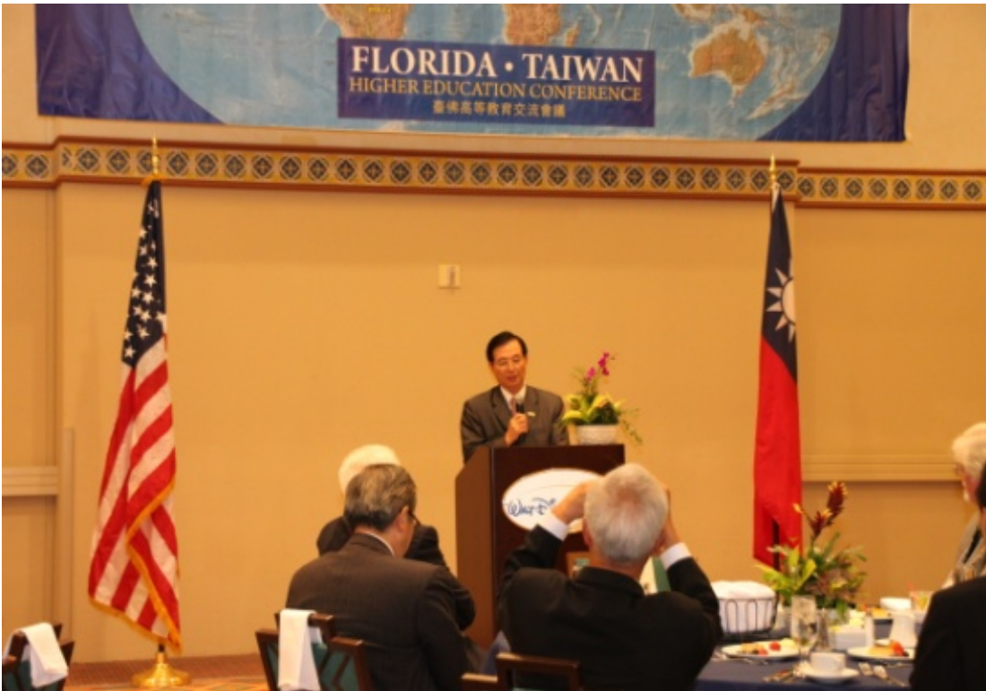
吳部長於駐邁阿密辦事處牟處長晚宴致詞