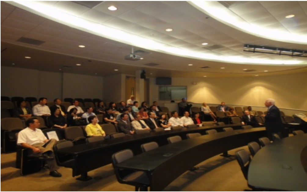
佛羅里達理工學院校長歡迎訪團