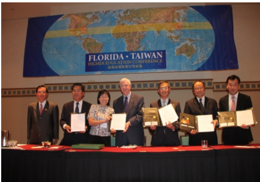
吳部長主持國立臺南大學、國立臺北科技大學、國立屏東科技大學、崑山科技大學、龍華科技大學與中佛羅里達大學（UCF）簽約儀式