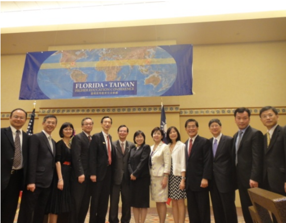
臺灣代表團與駐邁阿密處長合影