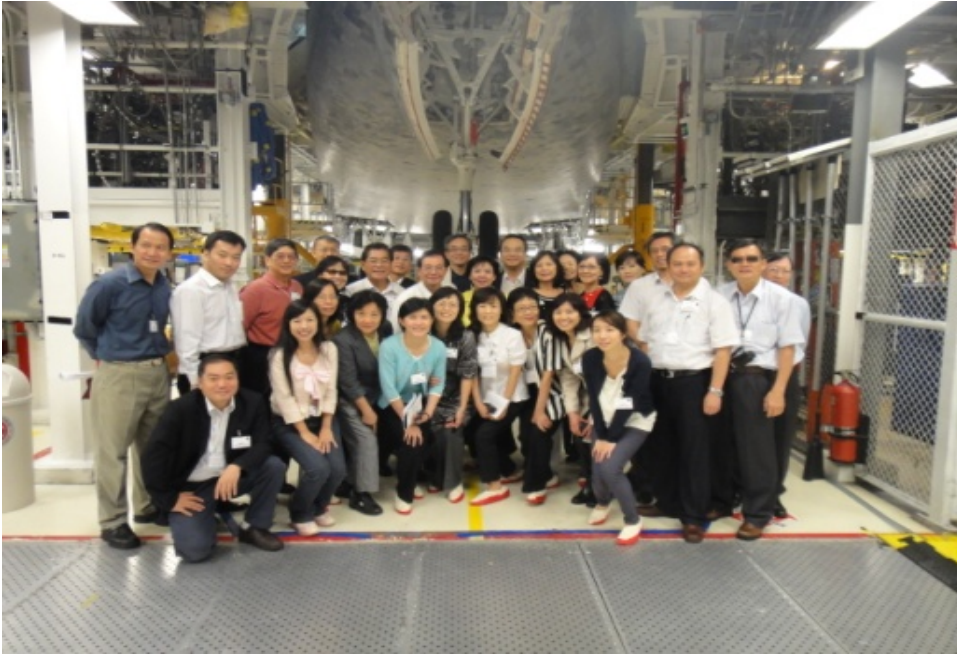
甘迺迪太空中心合影