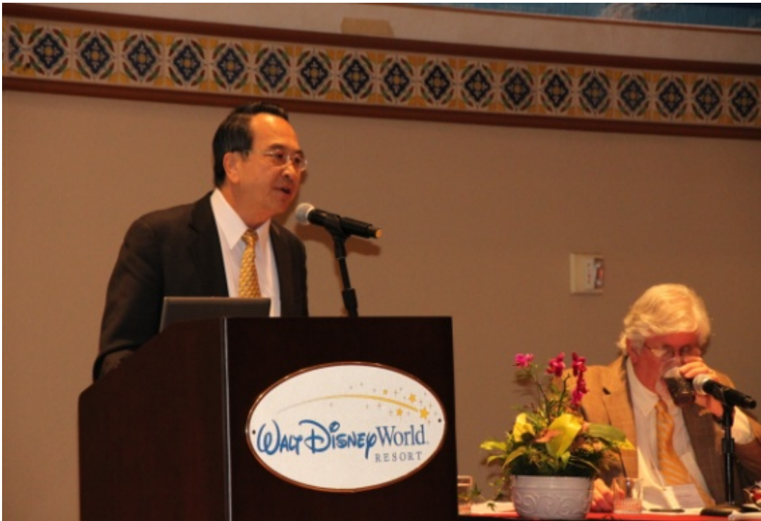
林處長交通專題演講