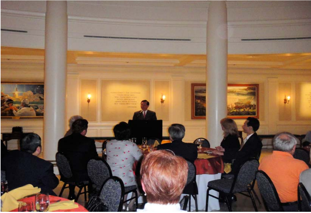
部長於第三屆臺佛高教會議晚宴致詞