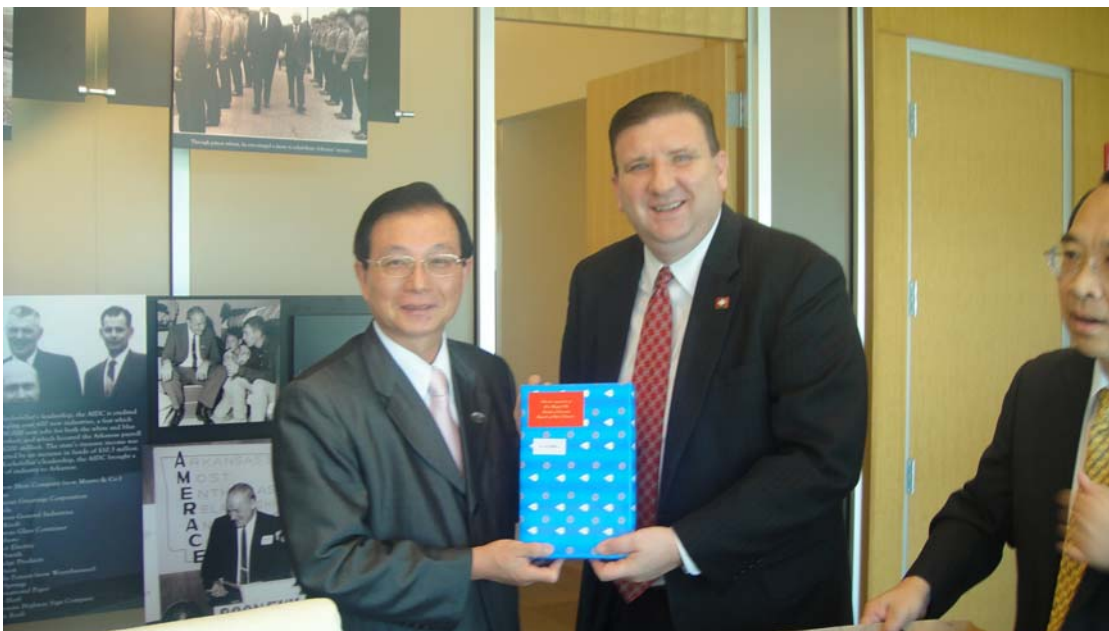
100年8月30日吳部長致贈阿肯色州高等教育廳 Shane Broadway 代理廳長禮物