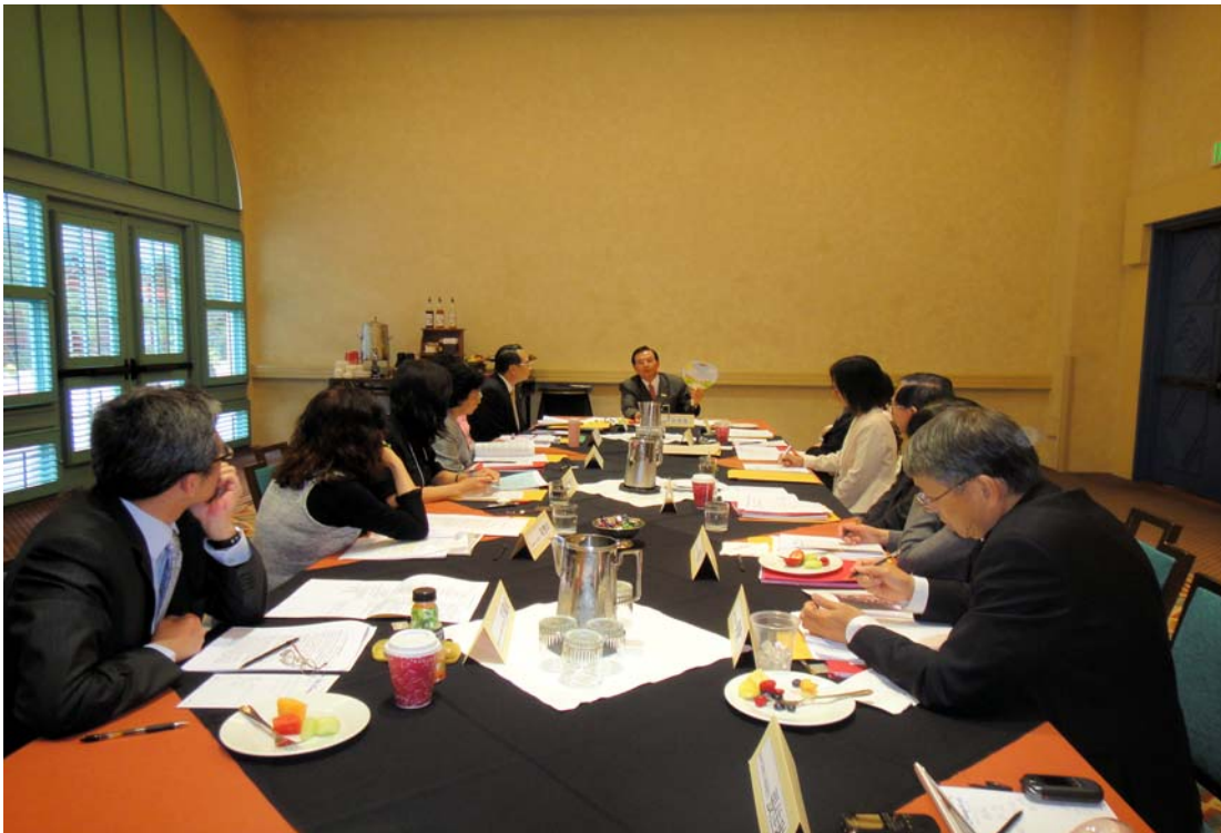
部長主持 100 年美洲地區文化組長會議