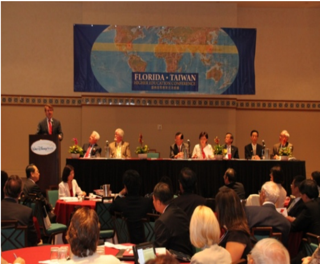
美國國會議員 Daniel Webster 開幕致詞