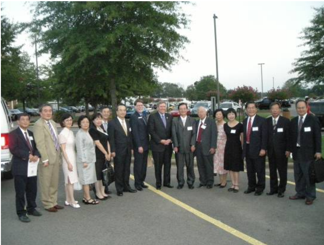
100年8月30日吳部長及代表團團員與中央阿肯色大學校長等校園合影