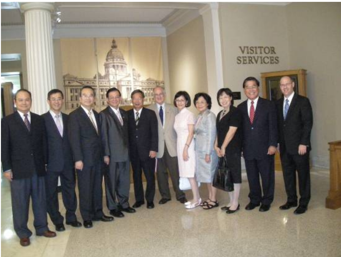
100年8月30日吳部長與代表團團員參訪阿肯色州國會山莊