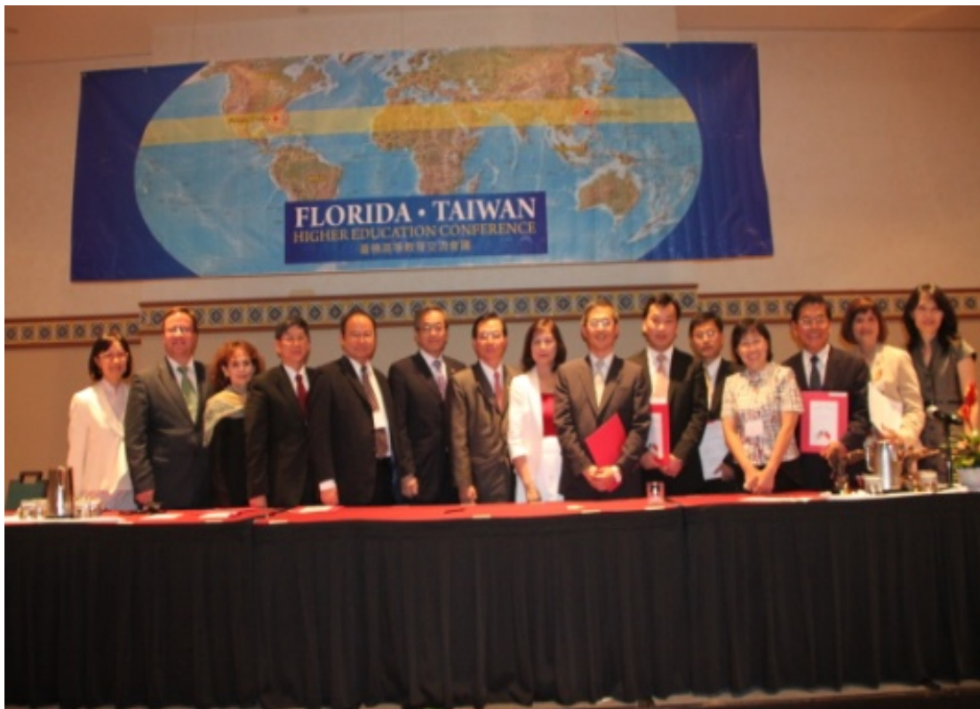
臺佛雙方簽約學校合影