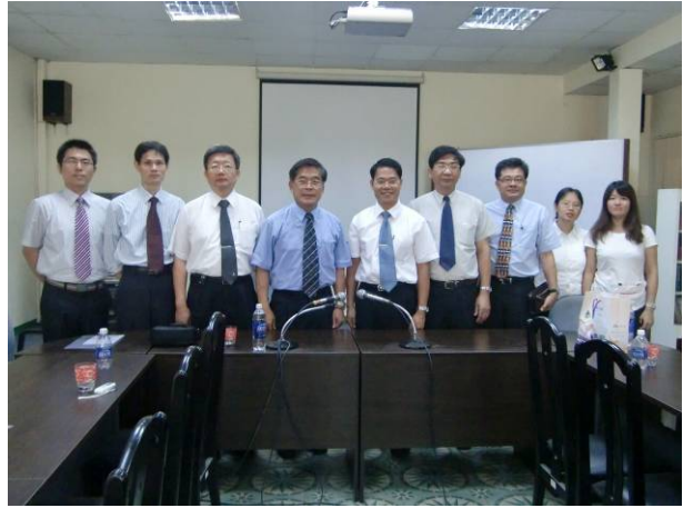
全體參訪成員大合照