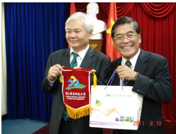
古校長代表本校敬贈法藍瓷及錦旗予胡志明市越南國家大學校長(左)及副校長(右)