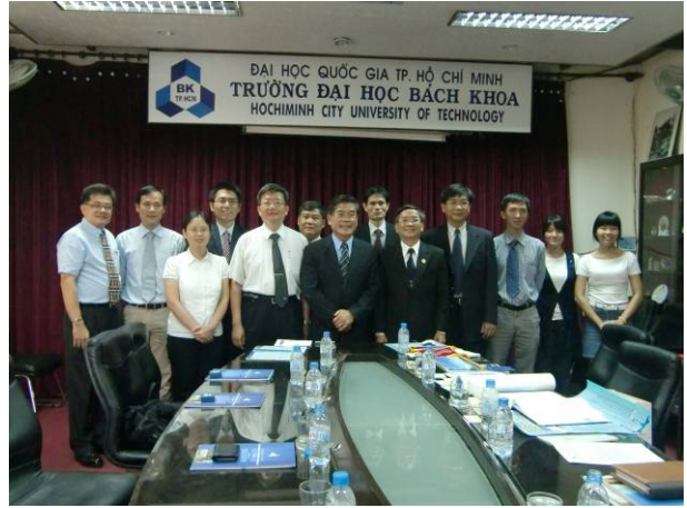
全體參訪成員大合照