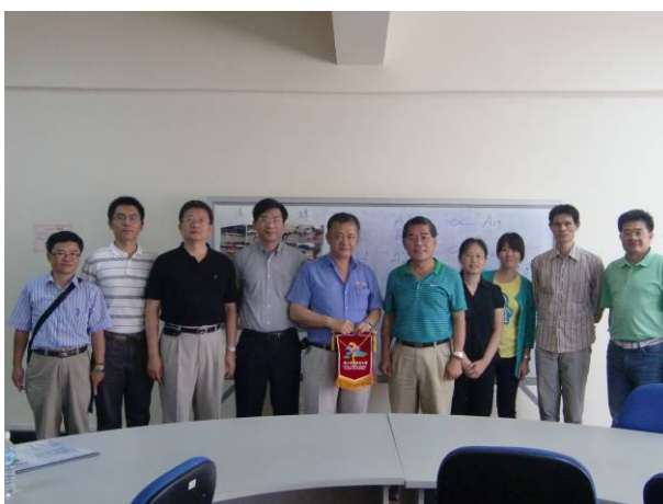
全體參訪成員大合照