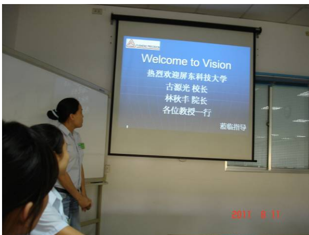
越南新加坡工業區越盛股份有限公司簡報