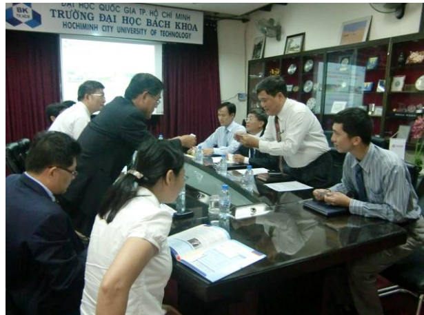
古校長帶領參訪團成員與胡志明市越南百科大學交換名片