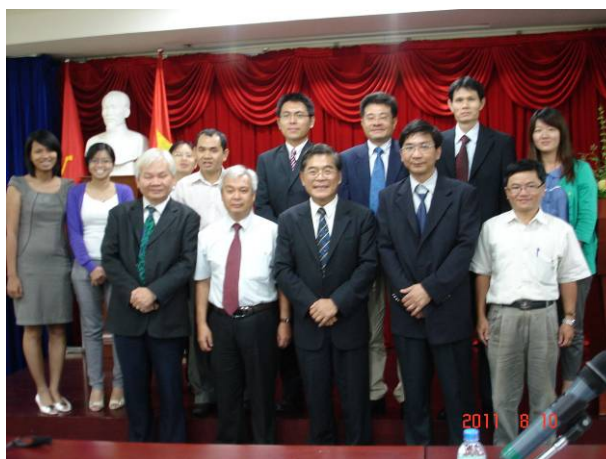
古校長敬邀胡志明市越南國家大學校參加 2011 ICGT 國際研討會(左) 全體參訪成員大合照(右)