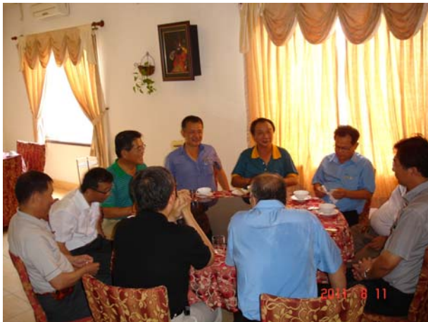
與越南當地台商共進午餐