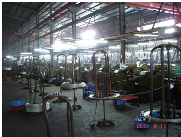
同安工業區 CO-WIN 公司陳木麒總經理代領本校參訪團參觀螺絲生產線