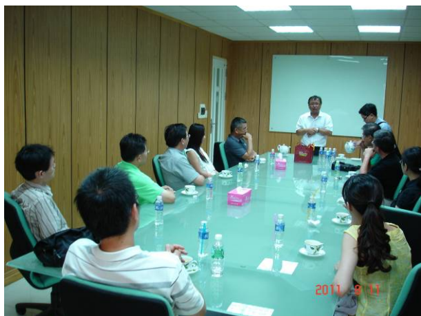
越南新加坡工業區 KING WIN 公司簡報