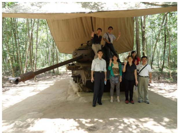
全體參訪成員大合照