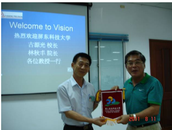
古校長代表本校敬贈錦旗