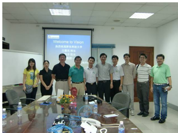
全體參訪成員大合照