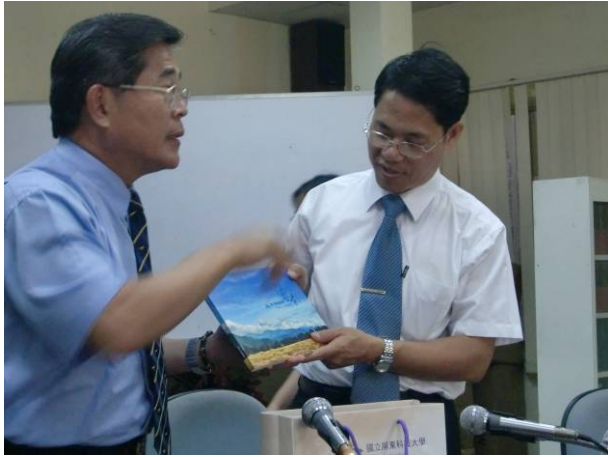
古校長代表本校敬贈校剪影及簡介