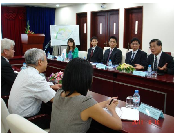
本校參訪人員與胡志明市越南國家大學校長和副校長交換名片，並且商談校際合作事宜