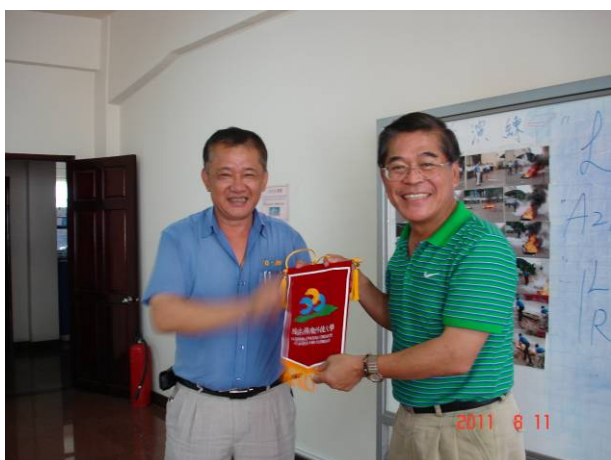
古校長代表本校敬贈錦旗