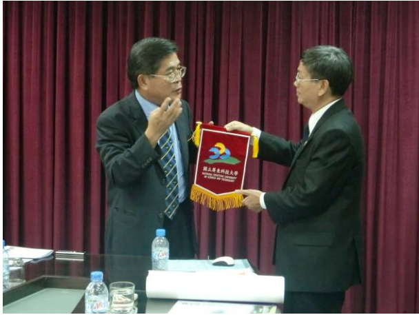
古校長代表本校敬贈錦旗