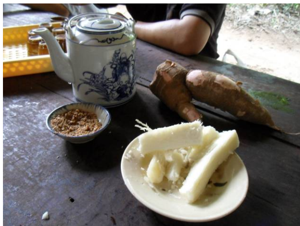
體驗越戰風味餐(地薯)