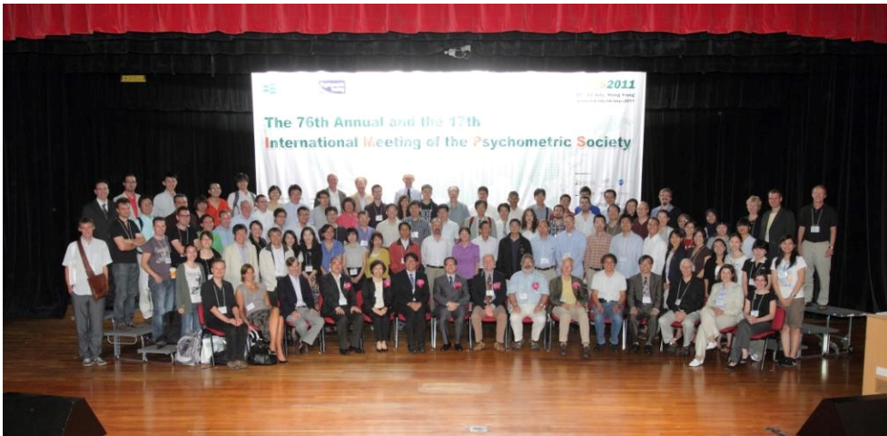
照片 1：IMPS 2011 與會人員大合照與註冊處留影

The 76 th Annual and the 17 th International Meeting of the Psychometric Society 是在 7 月 19 日至 7 月 22 日期間展開，會議地點為地理位置、語言文化皆與台灣相近的香港，本人於 7 月 21 日上午即搭乘長榮航空班機抵達香港國際機場。此次會議，口頭發表一篇論文，時間被安排在 7 月 21 日，除了論文發表之外，並積極參與聆聽專題演講、研究相關領域之論文發表與資料收集。