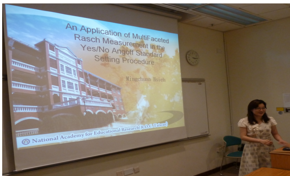
照片 3：IMPS20111 標準設定發表會場與其他來自各地學者