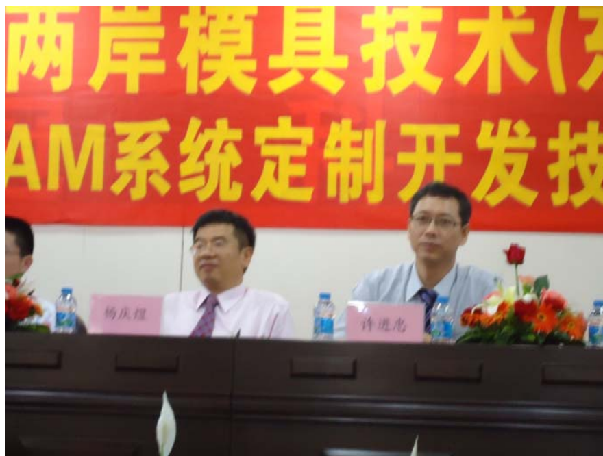
圖 4 參加圓桌模具論壇實況