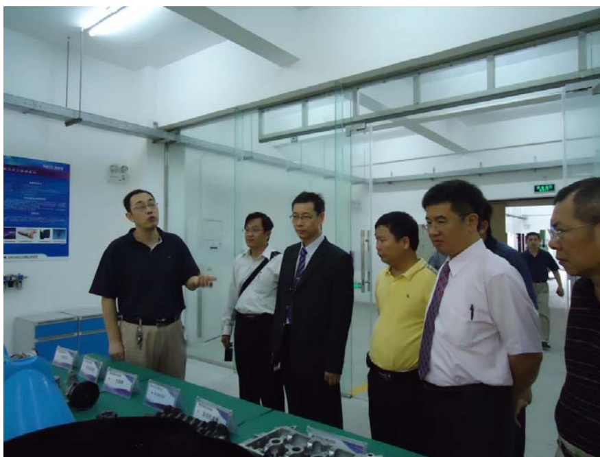
圖 1 參訪華中科技大學東莞公業研究院