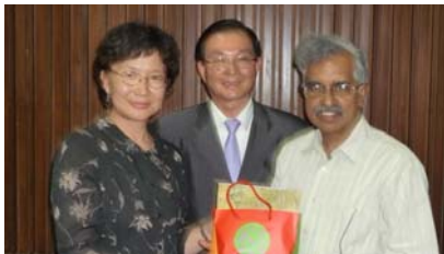
參訪印度理工學院-2