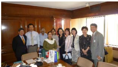
拜訪印度大學協會-1