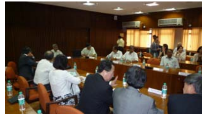
參訪印度理工學院-1