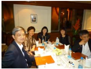
參訪印度農業大學聯盟-2