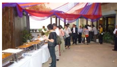
拜訪駐印度大使館-4