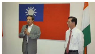
拜訪駐印度大使館-2