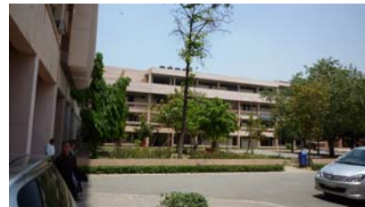
印度理工學院校園-1