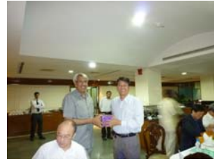
參訪印度農業大學聯盟-1