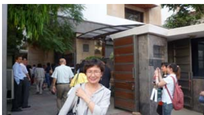
拜訪駐印度大使館-1