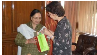
拜訪印度大學協會-2