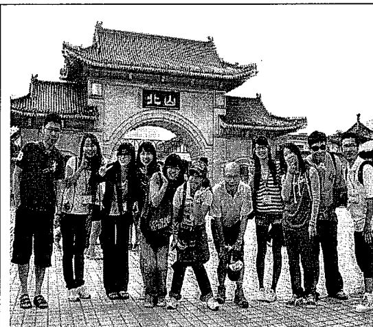
參觀吉林北山關帝廟及藥王廟