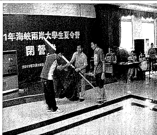
2011 海峽兩岸大學生夏令營閉營