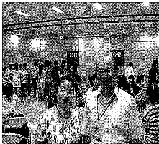
2011 海峽兩岸大學生夏令營承辦人合影