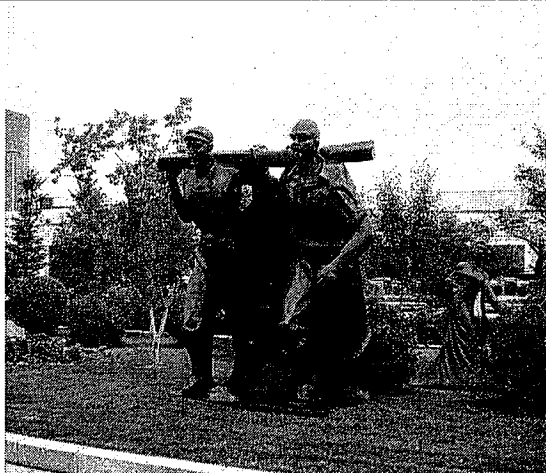
參觀長春國際雕塑公園