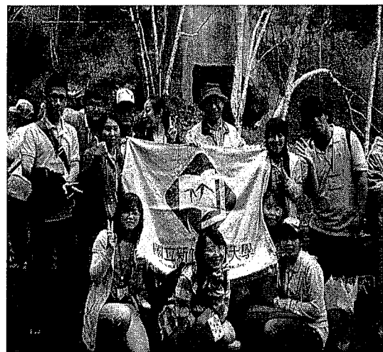
長白山地下森林合影