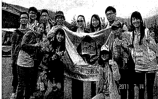
轉搭長白山森林接駁車廣場合影