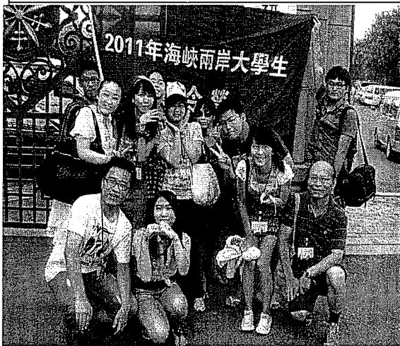
與東北師大同組學生合影