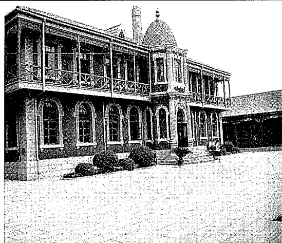
參觀偽滿清皇宮博物院