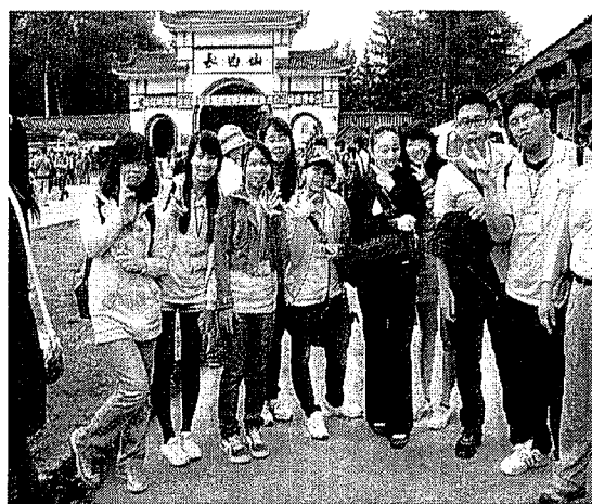
進入長白山入口合影