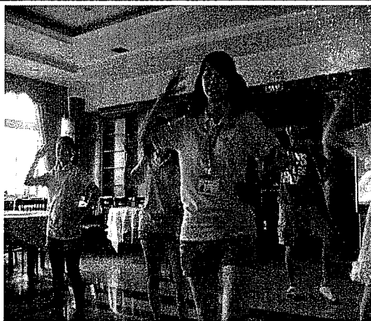
本校學生在晚會中舞蹈表演