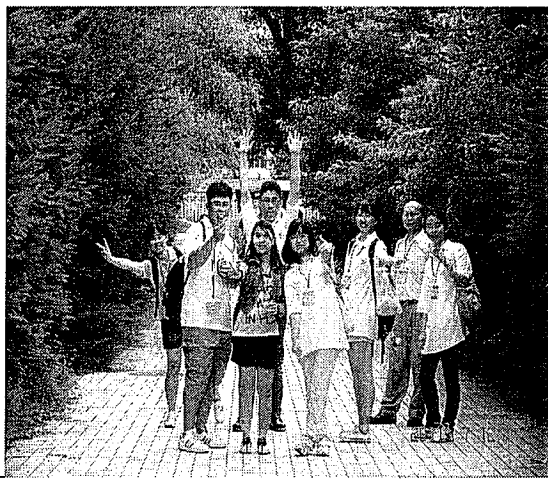
充滿綠意東北師大校園