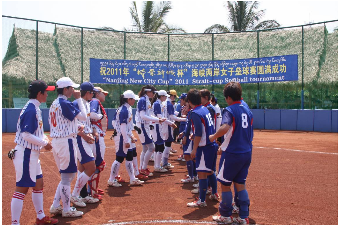
雙方賽前交換紀念品