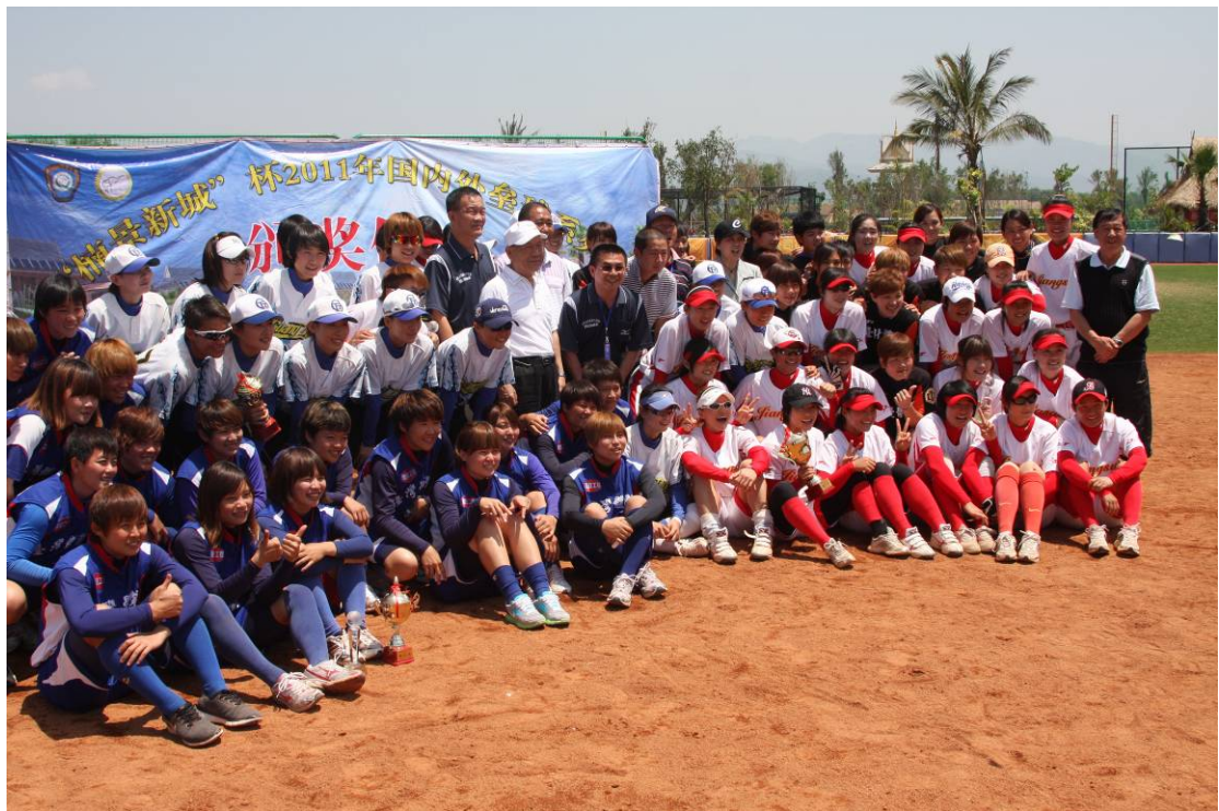
全體參賽隊伍合影留念