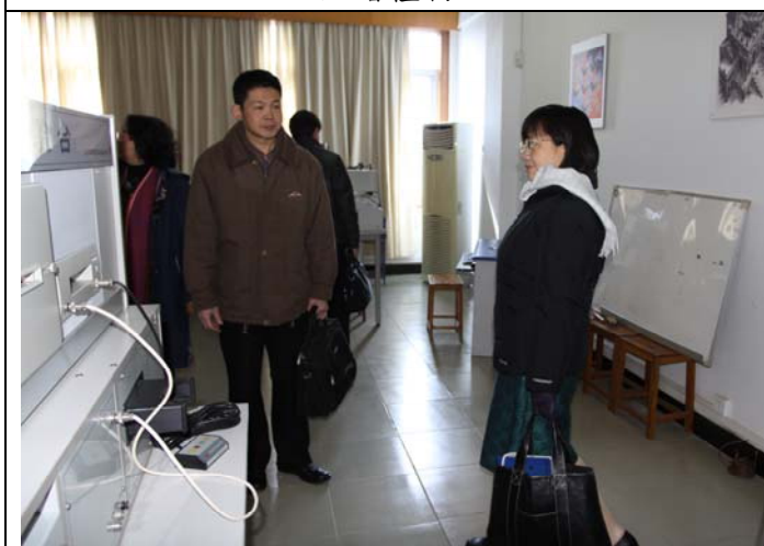
參訪育才校區的設施