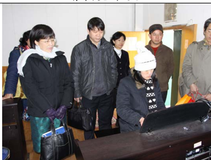
育才校區的學生表演