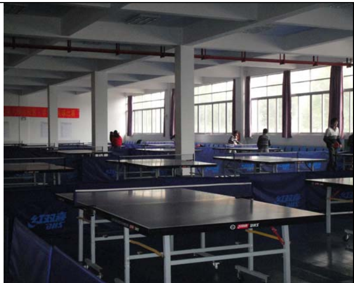
燕山校區體育設施