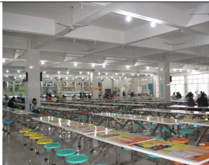
燕山校區學生餐廳