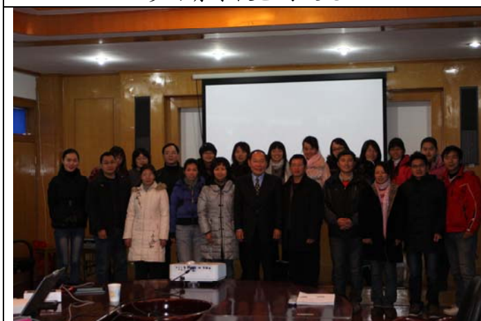
與教育科學院技術系師生交流後合影