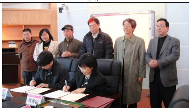
本校校長黃秀霜與廣西師大教育科學院院長孫杰遠進行簽約