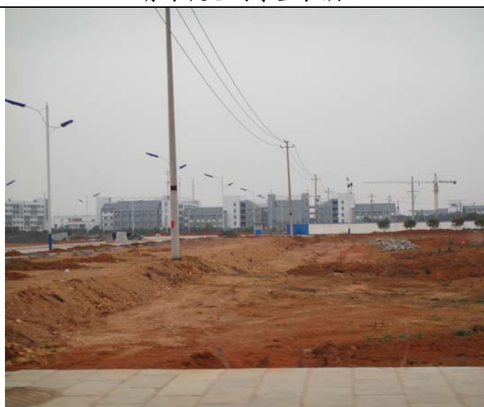
開發中的燕山校區