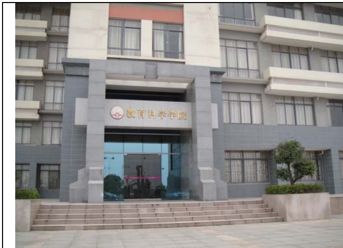
燕山校區教育科學院大樓