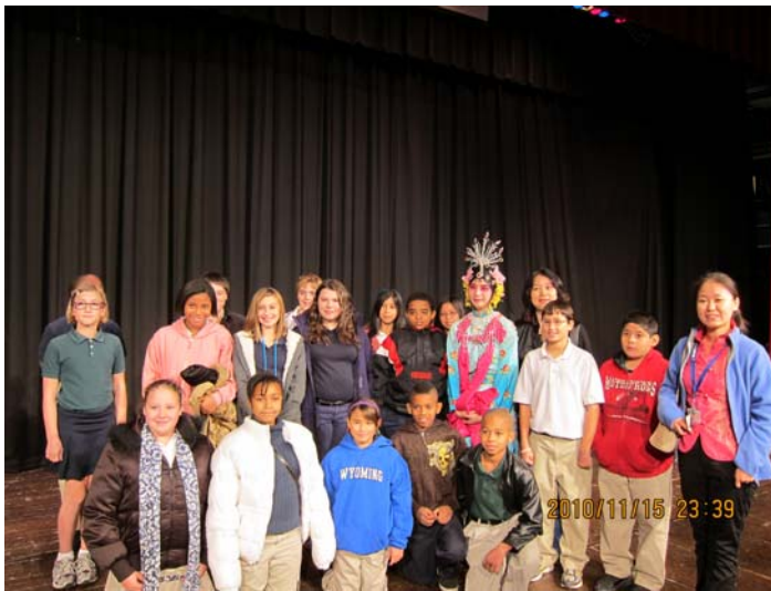
Performances at Bridgeport School 《天女散花》