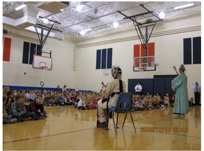
Performances at Marshall Elementary 《拾玉鐲》