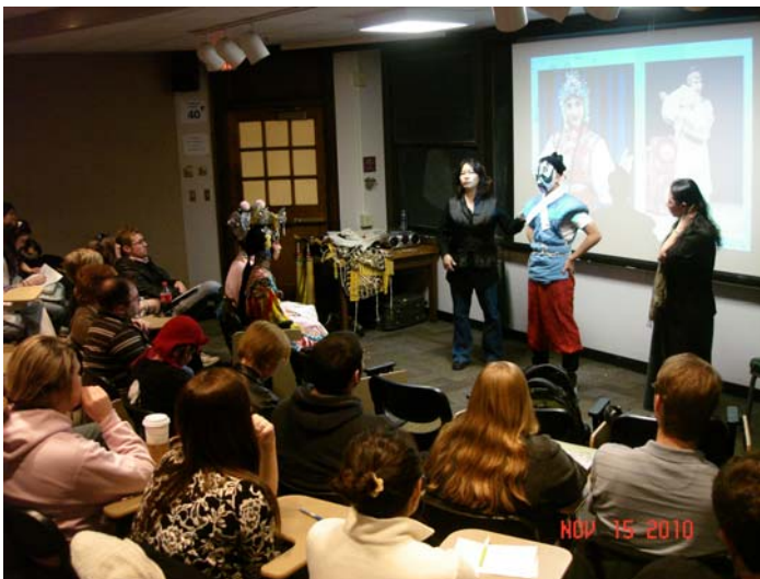
Presentation for MU classroom visit 《霸王別姬》