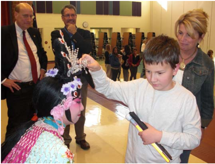
為美國身障及視障學生演出，並做接觸體驗。 《天女散花》