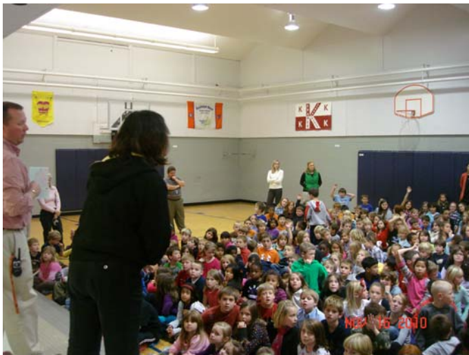
performances at Kramer Elementary 張旭南老師主持表演教學工作坊