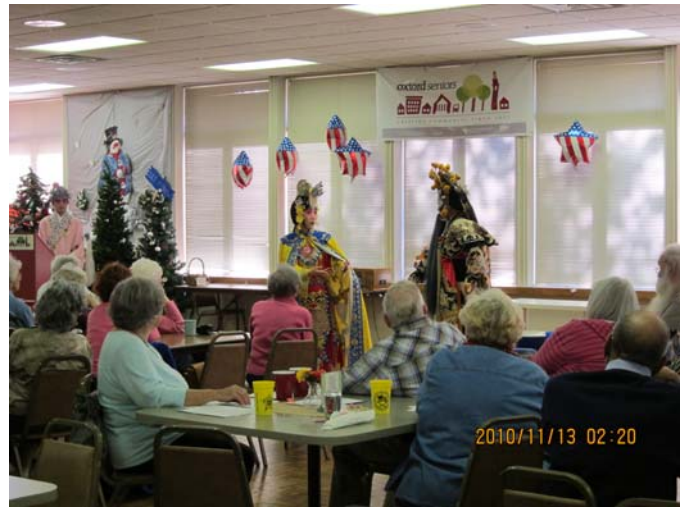
Oxford Senior Center 老人安養中心演出 《霸王別姬》