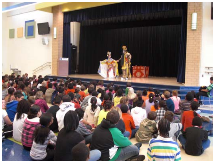
◎Performance & Workshop for Linden 《霸王別姬》