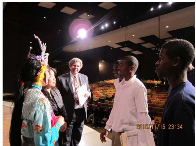
Performances at Bridgeport School 《天女散花》