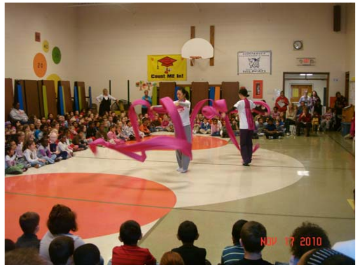
Winterset Elem. School 表演示範工作坊