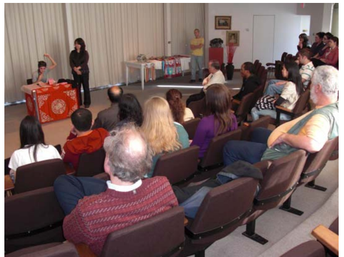
Pre-show Lecture at Art Museum Performance for the public at ART Museum 專場：《天女散花》、《貴妃醉酒》