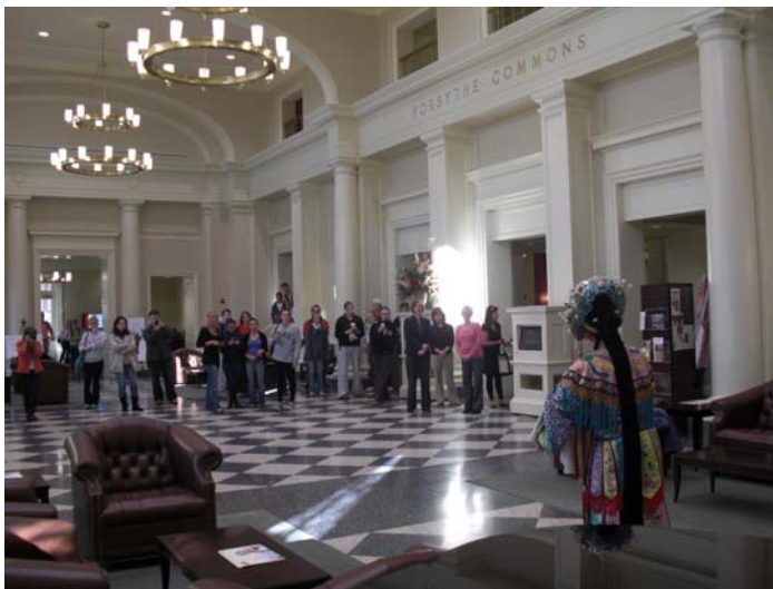
Performance & Workshop Farmer School of Business 《貴妃醉酒》