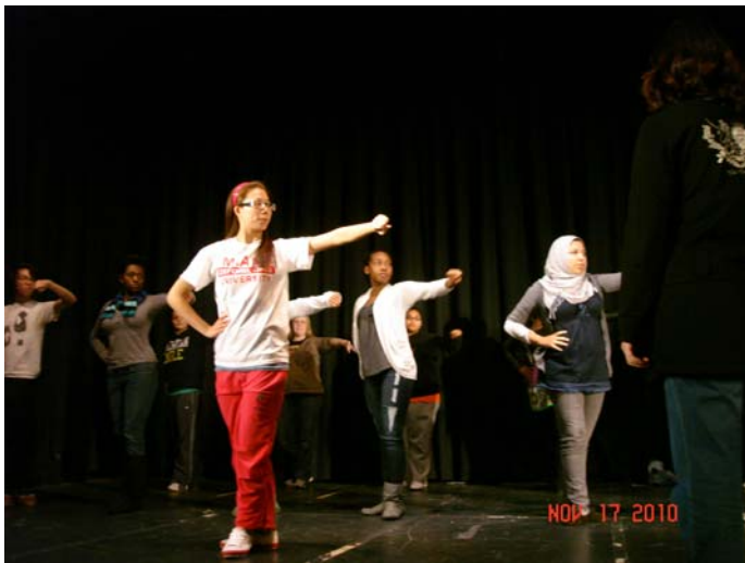
Workshop for with Drama Club at Centennial High School 表演教學工作坊