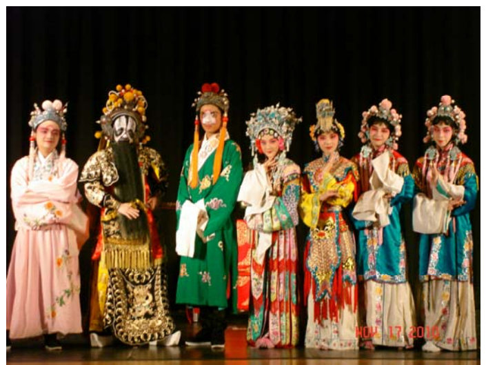
Performance for the public at Centennial High School 《天女散花》《霸王別姬》《貴妃醉酒》謝 幕照