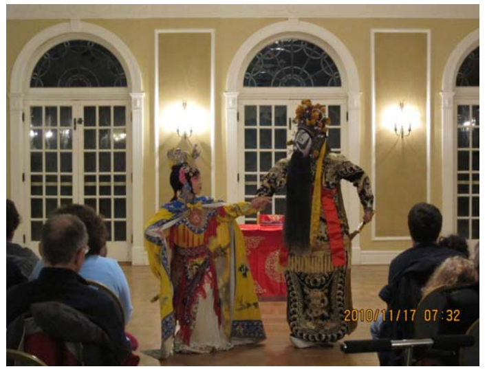
performances at Oxford Community Center 《拾玉鐲》、《霸王別姬》