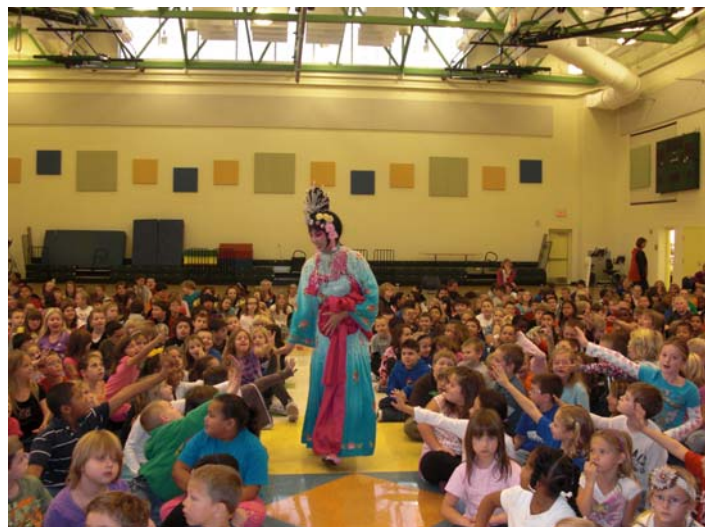
◎Performance & Workshop for Fairwood 《天女散花》