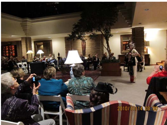
Performances at PYRAMID HILL 專場：《拾玉鐲》、《天女散花》、《霸王別姬》