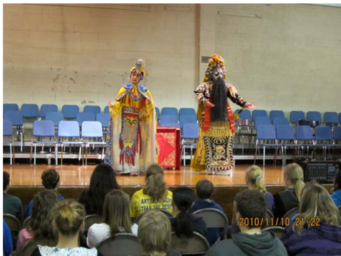
◎Performance & Workshop for Hamilton School 《霸王別姬》