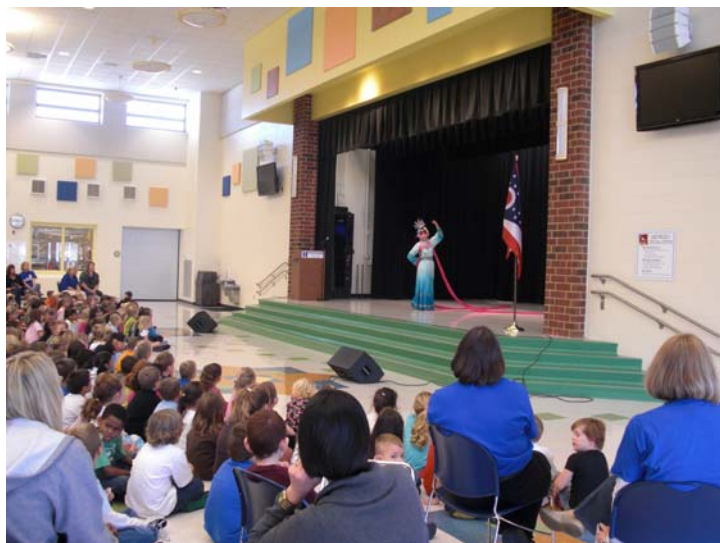
◎Performance & Workshop for Fairwood 《天女散花》