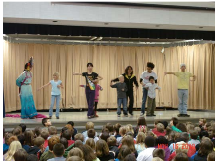
performances at Kramer Elementary 《天女散花》和表演教學工作坊