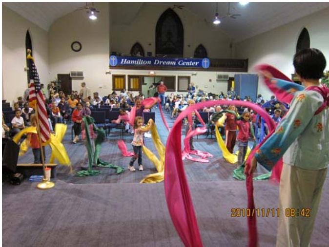
Workshop for Hamilton Dream Center 為失怙兒童進行表演工作坊