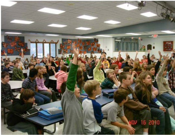
Talawanda Middle School at Oxford 《天女散花》