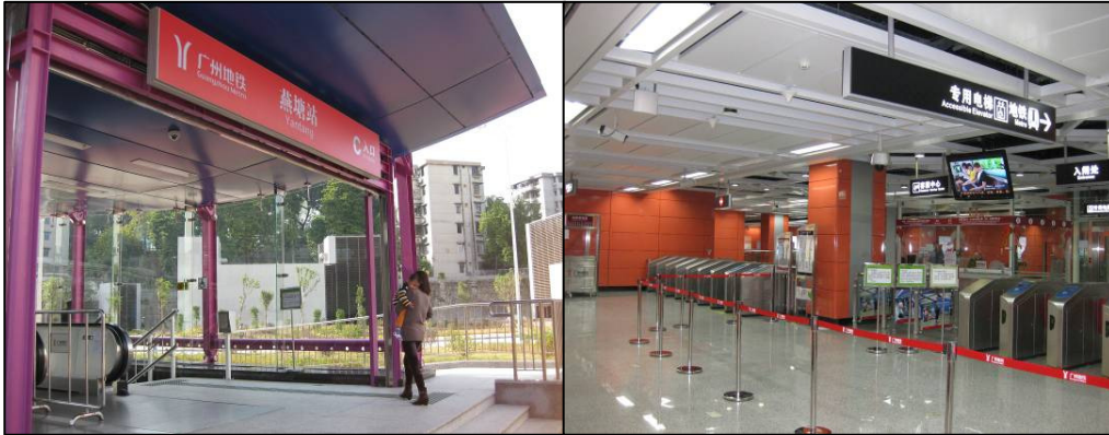
圖 3-5 廣州地鐵燕塘站