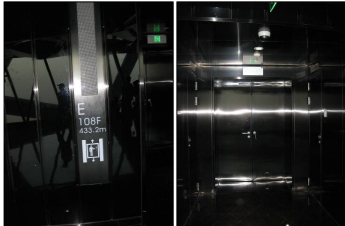
圖 3-16 108 樓標高與安全門

“高層建築防火主要靠的還是自救，一旦發生火災，等待外來撲救將是一個大難題。”如果消防管道沒水，那只能從底層鋪設連接水帶一直到起火的樓層實施滅火，而目前廣州輸出壓力最強的 UD 消防車，單車透過水帶連接可以最高將水送到 203.7m 46 層高的位置，兩部車聯合供水可達到 226m 的高度。而在供水過程中，由於水帶承受壓力以及高度有限，所以當失火樓層太高接水帶勢將沒辦法滅火。為預防“火災缺水”現象，增強自救能力，據新電視塔介紹，廣州新電視塔在標高-10m 地下建有一個 40m 3 的消防蓄水池，並配備兩台消防幫浦，防止其中一台故障；另外還在 16 層、40 層和 63 層高處分別設 10 m 3 蓄水池，在 88 層高處也設置一個 5 m 3 的蓄水池，整個消防管道採用壓力循環，確保水源充足，一旦發生火災可隨時立即滅火。