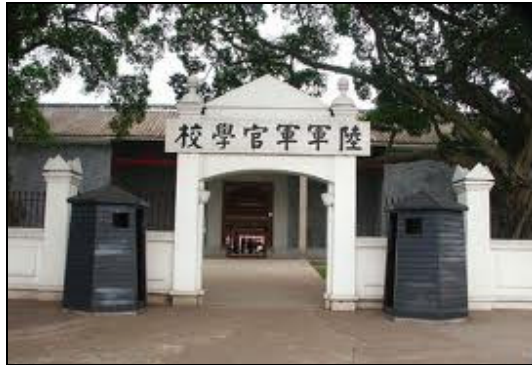
圖 3-18 黃埔軍校大門

孫中山、廖仲愷、周恩來及教授、教練、管理、軍需、軍醫各部的辦公室和教室、師生的飯堂、寢室等。2005 年，又投入 1400 多萬元進行全面修繕。1988 年被大陸列為第三批全國重點文物保護單位。