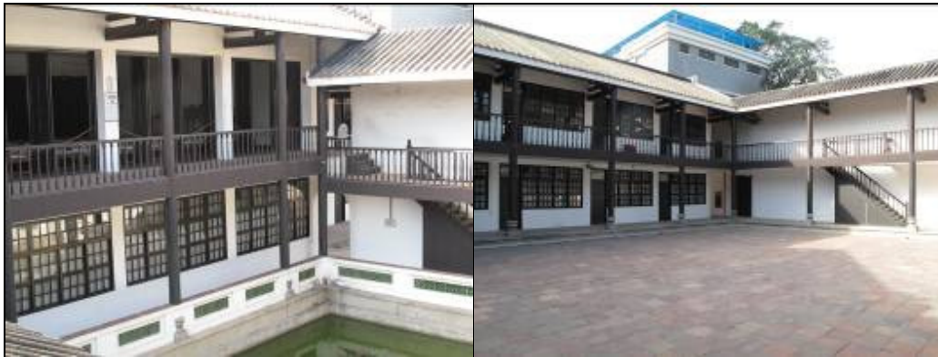
圖 3-19 黃埔軍校建築一角