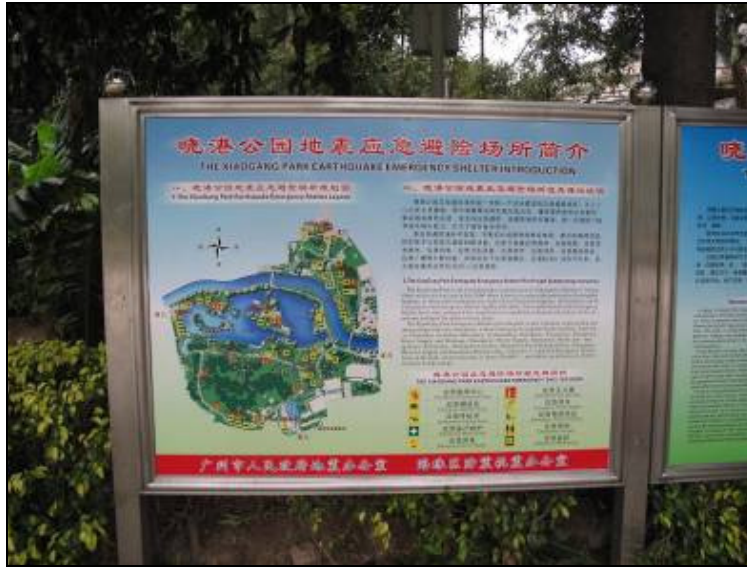
圖 3-32 防災公園規劃圖