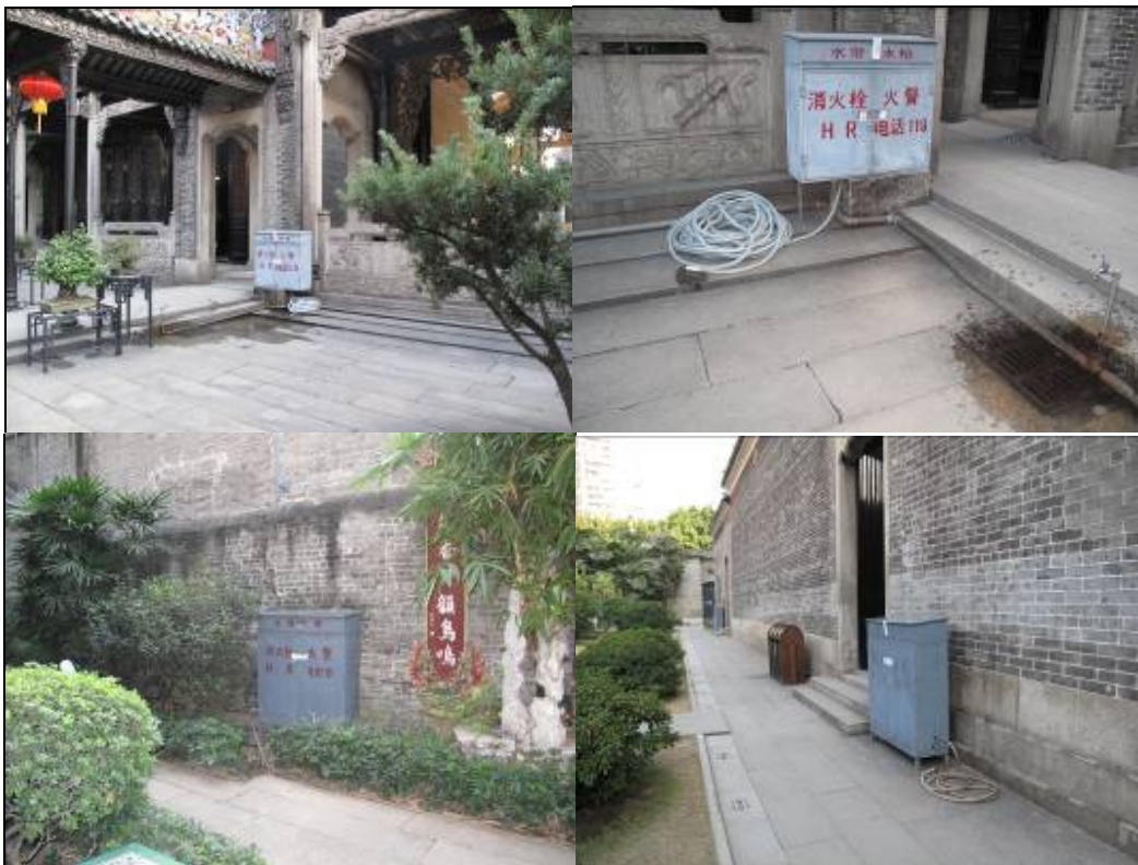
圖 3-28 消防栓裝設處