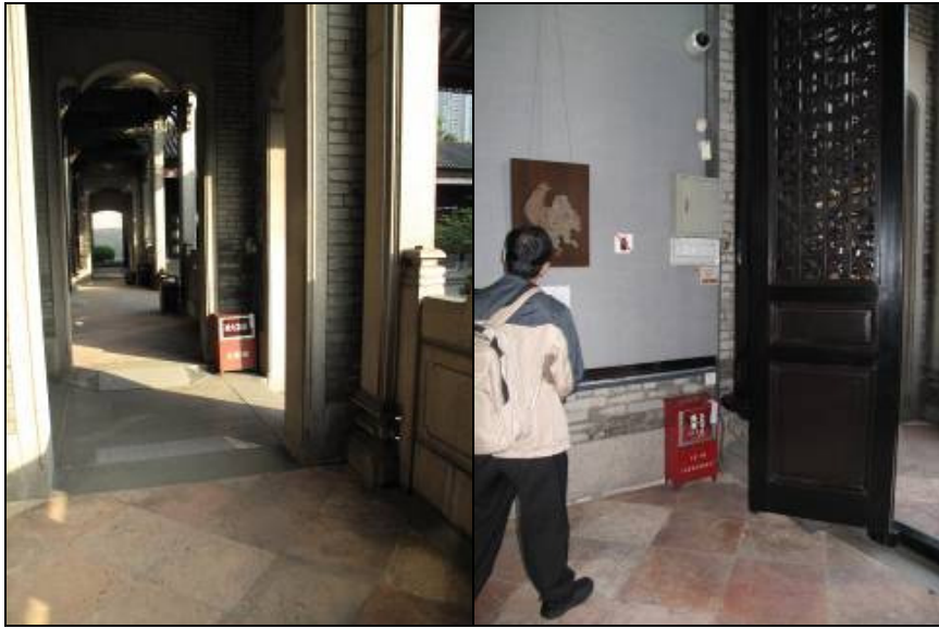
圖 3-27 滅火器設置位置