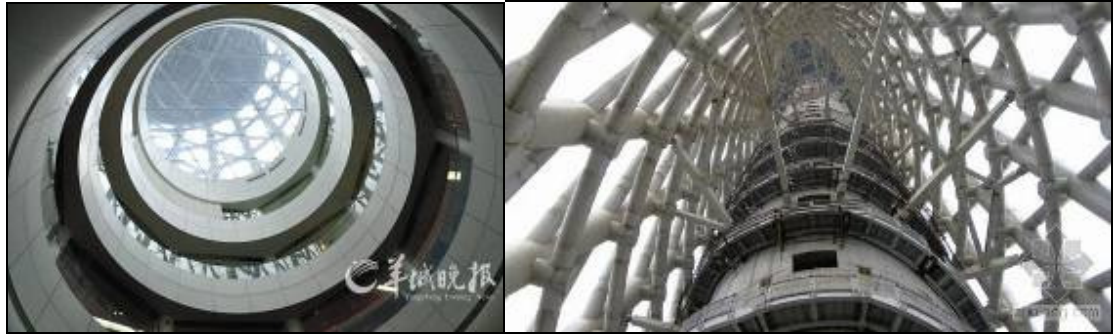
圖 3-13 由塔內筒向上觀與內外筒間