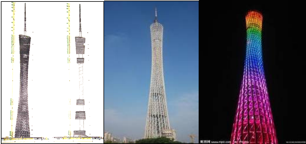
圖 3-11 建築架構

廣州新電視塔塔體架構包括一個鋼構架外筒，一個橢圓形混凝土核心筒以及連接這兩者的鋼構架樓面，外部鋼架和核心筒之間的空間除空中雲梯之外是空的。鋼構架的桅杆天線直接建於核心筒頂部。鋼構架外筒的最高點標高為 462.8m。鋼構架外筒用圓形鋼管製造，立柱填充鋼筋混凝土，以形成具有相當強度和剛度的組合構件。環和斜撐沒有填充混凝土。鋼架構外筒示意圖如圖 3-12，鋼構架外筒構件全部外露。