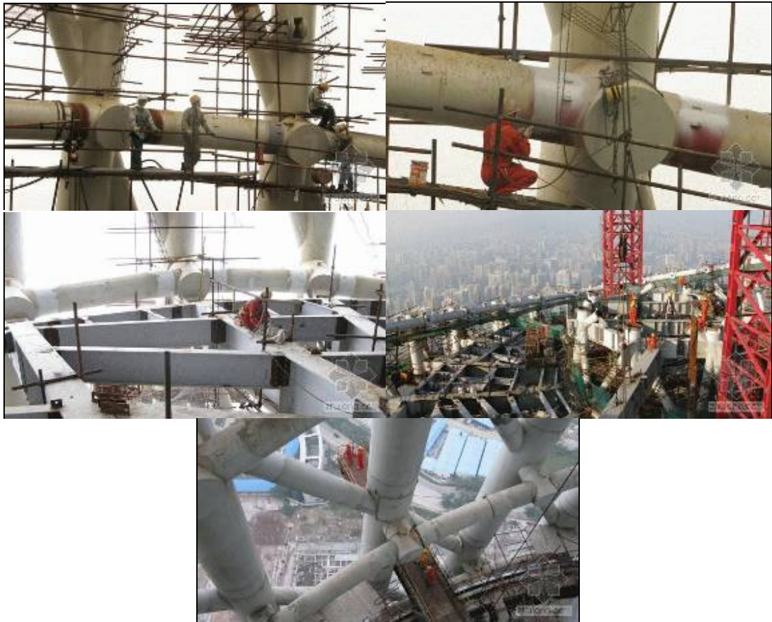
圖 3-15 鋼構架施工

鋼構架的外筒是構架主要的抗側力構件，包括三種類型的桿件：立柱、環和斜撐。外筒共 24 根柱，由地下二層柱定位點沿直線至塔體頂部相應的柱定位點，全部為鋼管混凝土組合柱，柱截面尺寸由底部的鋼管直徑 2.0m 逐漸減小到頂部的 1.2m。斜撐與鋼管混凝土柱的連接採用剛性連接形式。外筒的環梁共有 46 組，環梁材料為鋼管，環梁截面尺寸均為 800mm，採用曲線形式，環梁與鋼管混凝土柱透過節點連接。廣場以上的樓面主梁支撐在核心筒和外部筒體柱上，採用 H 型鋼。樓面次梁採用軋製型鋼。主梁與核心筒和外部筒體柱的連接形式，以及主梁與次梁的連接形式均採用鉸接。