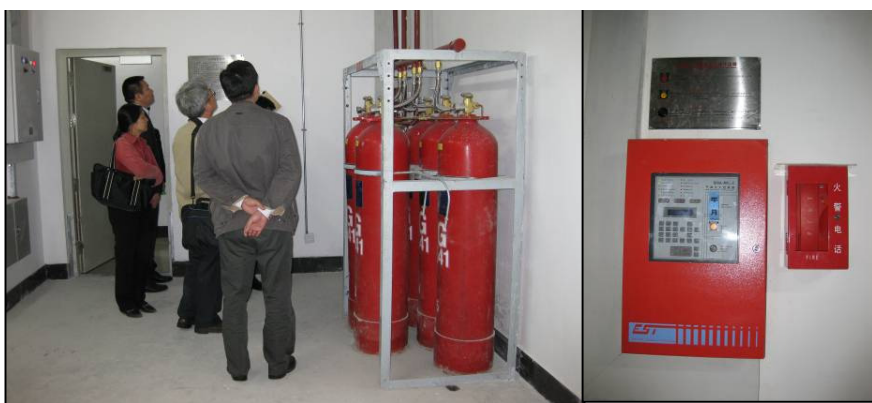
圖 3-7 環保型氣體滅火器(左)與控制器(右)