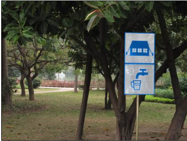
圖 3-34 防災公園中帳棚搭建區以及水源