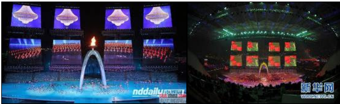
圖 3-9 第 16 屆亞洲運動會開幕式

海心沙體育場預計於 2010 年 12 月 15 日開放，在此之前因辦理亞運管制，本次考察經由廣州消防協會協助，廣州市消防總隊同意及安排下，在廣州消防協會副會長張培端陪同下進入參觀，為準備亞運廣州市消防總隊在開幕前於此體育場舉行了滅火與疏散演練(圖 3-10)，共設定了八個小型火災事故的應急處置，包括大型電