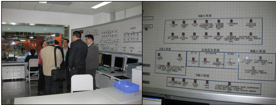
圖 3-6 地鐵車站控制室