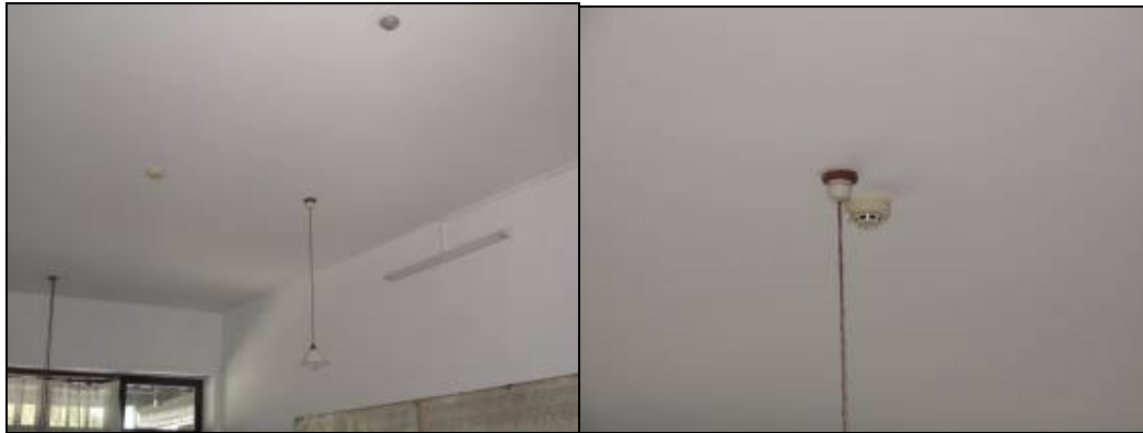
圖 3-22 室內天花板裝設偵煙器