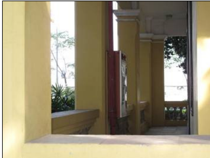
圖 3-24 孫中山故居消防栓裝設處