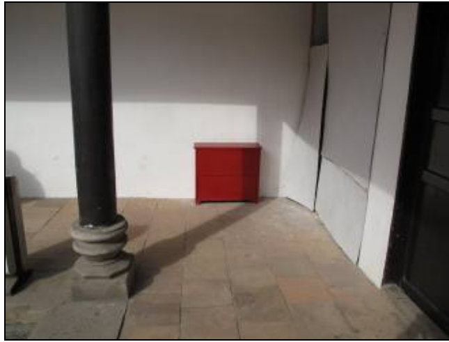
圖 3-20 滅火器設於轉角處