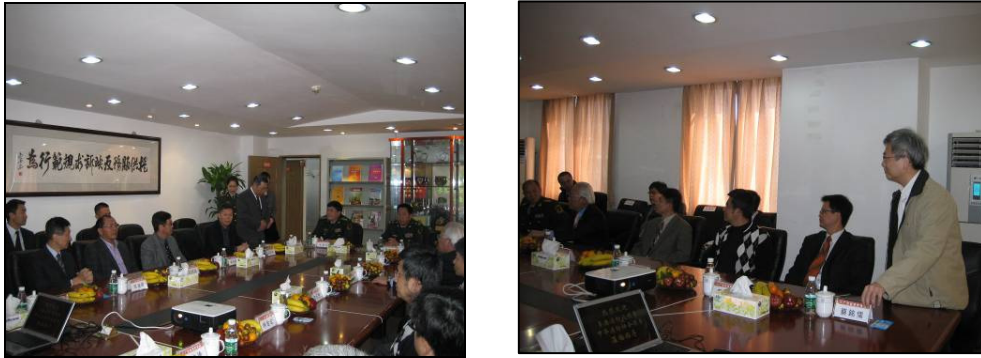
圖 3-3 廣州消防協會接待會議