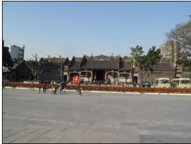
圖 3-25 陳家書院正面

法既有簡練粗放、又有精雕細琢，上下呼應、相得益彰。2002 年被列入羊城(廣州市別稱)八景，名為「古祠留芳」。