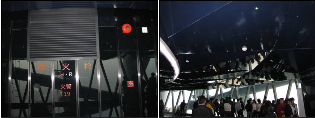
圖 3-17 108 樓消防設備