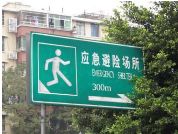
圖 3-30 廣州市防災公園主要道路路口指標

求，至少能安置週邊居民近 3 萬人應急避難，為本次參訪的重點區域，相關參訪照片如圖 3-30 至 3-34 所示，園區中可見緊急避難場所標示，清楚標示各種緊急避難時的各類場所。