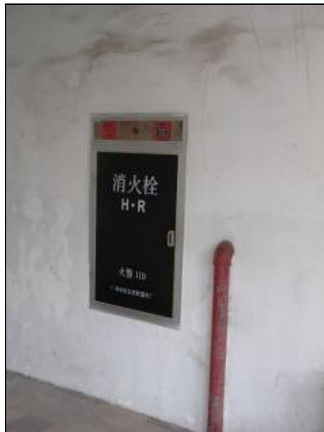
圖 3-21 牆壁內嵌消防栓