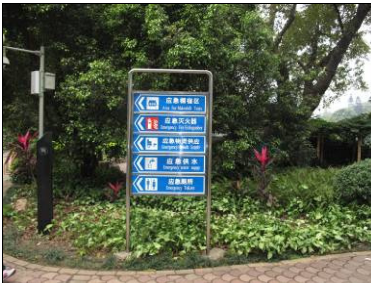
圖 3-33 防災公園中各項設施指標