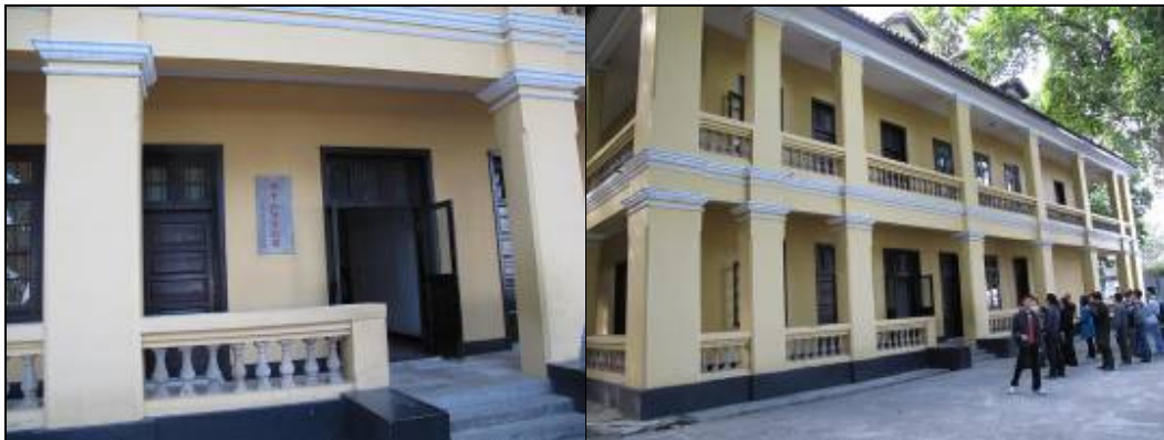
圖 3-23 孫中山故居

大門西側有一幢 2 層磚木結構樓房，原是教職員宿舍，因民國 6 年(1917 年)孫中山曾在此憩宿，孫中山逝世後，改建為總理紀念室；1984 年又改為黃埔軍校紀念館，陳列黃埔軍校校史和孫中山在廣東革命活動的照片。有時也會舉辦孫中山史料展覽。