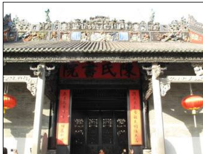
圖 3-26 陳家書院正門