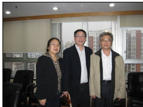
圖 3-29 座談人員合影

廣州在追求經濟成長與都市快速發展的過程中，為因應全球氣候變遷，提升國際競爭能力，不斷加強都市防洪減災基礎建設，提出不同災害類型的減災應變措施與防治策略，不遺餘力，其相關成果與採行策略，可提供本所未來在建築與都市防災減災調適科技計畫規劃時納入參考，亦可作為本所辦理都市防災空間系統手冊彙編研究時，對於防災路線、避難、消防、警察、醫療及物資集散等六大防災空間系統增修之參考。