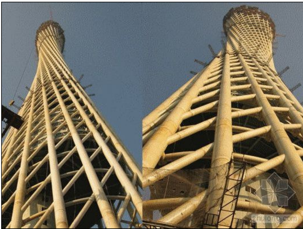
圖 3-14 塔鋼構架外筒