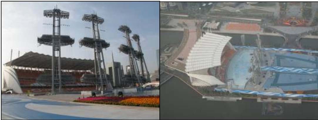
圖 3-8 海心沙體育場

海心沙是位於廣州珠江內江心沙洲島嶼(圖 3-8)，西部為二沙島，南部為海珠島的廣州新電視塔，北部為珠江新城。市民廣場在 2009 年落成，2010 年 11 月 12 日晚，第 16 屆亞洲運動會開幕式(圖 3-9)在這裡舉行。