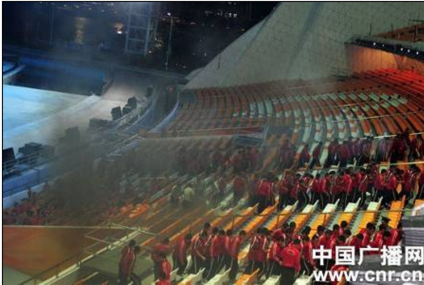
圖 3-10 海心沙體育場疏散演練

子顯示幕發熱冒煙起火、貴賓室沙發冒煙起火、觀眾席縱火、煙火掉落舞台起火、吸煙不慎引發火災、燃氣管道洩露、游船電器短路起火、汽車自燃起火。