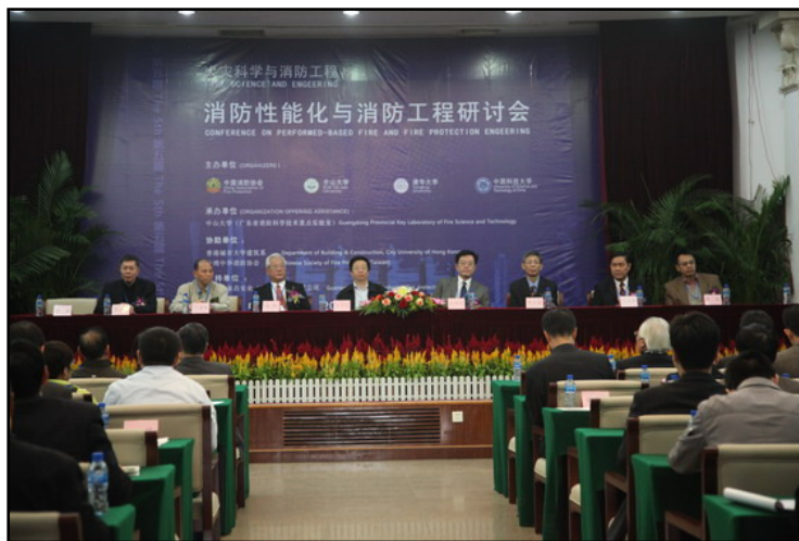
圖 3-1 第五屆國際消防性能化與消防工程研討會主會場

消防性能化與消防工程研討會，原名“消防性能化規範發展研討會”，是由中國消防協會、中山大學工學院、清華大學公共安全研究中心、中國科技大學火災科學國家重點實驗室、香港城市大學建築系共同發起的學術會議，旨在探索國際消防工程與性能化規範發展的新趨勢，分析消防科學與工程在實際應用中的問題，同時探討有關性能化設計規範審查的架構和理念，推動各地科學化防火設計的發展與應用，並為在這一領域進行研究的學者專家提供一個學術交流平台，以推動火災科學與消防工程學科的發展與影響，首屆及第二屆在香港由香港城市大學承辦、第三屆在台北由中華消防及減災學會承辦和第四屆在北京由中國消防協會承辦，取得了良好的效果。第五屆會議在廣州由中山大學承辦，主會場於中山大學懷士廳（圖 3-1），會議延續防火性能化研究的基礎，對火災科學和消防工程領域的研究進行更深入研討和交流。