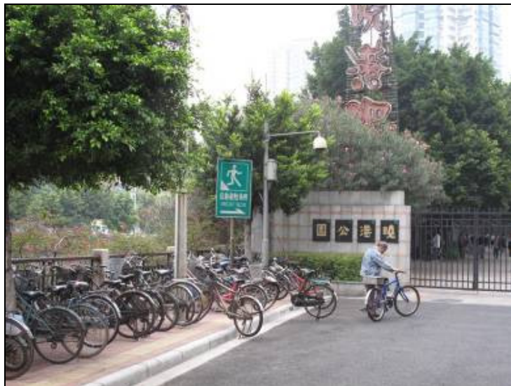
圖 3-31 防災公園入口指標