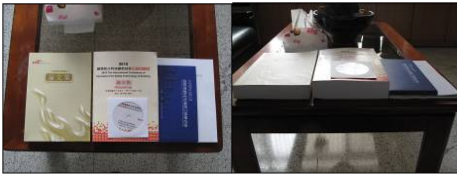
圖 3-2 論文集出版方式比較

此外，由本屆研討會論文分析，有一特點可供國內相關研討會辦理參考，即投稿同時亦可申請推薦並經研討會學術審查推薦，將有機會被收錄於 SCI(科學引文索引)、EI(工程索引)、ISTP(科技會議錄索引) 世界著名的三大科技文獻檢索系統之 EI(工程索引)、ISTP(科技會議錄索引)收錄，本屆提交之 61 篇英文論文中即有 45 篇，已經審查再稍作修改後即可被相關期刊所接受，就本研討會與本所 2010 年 11 月 16 日~17 日主辦，財團法人台灣建築中心承辦之「2010 建築防火科技創新國際研討會」論文徵集方式比較，徵稿活動於 2010 年 6 月 14 日開始，全文截稿日為 2010 年 9 月 15 日，徵集之論文篇數為 51 篇，論文篇數差異倍數之多，此一特點不但對學術論文投稿時程短，可激發投稿者意願，且提高研討會學術地位；在論文集出版方式相較，以財團法人台灣建築中心承辦及第三屆在台北由中華消防及減災學會承辦，其論文集上皆全文印製(詳圖 3-2)，相行之下少紙化之節能減碳觀念尚須加強，由研討會辦理方式而言，上述方式殊值國內參考。