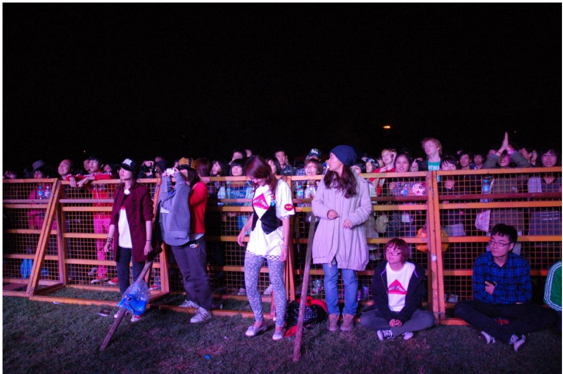
圖四：「拾參樂團」聚集了現場眾多聽眾