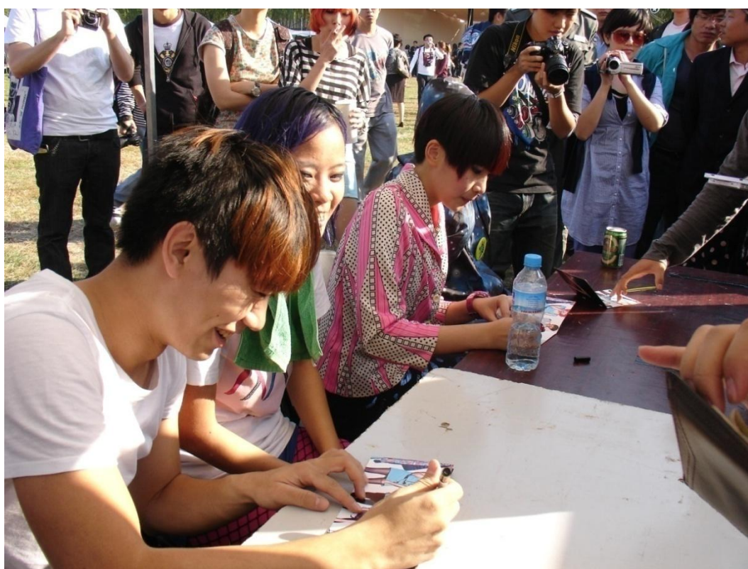
圖八：GO CHIC 於台灣攤位幫歌迷簽名