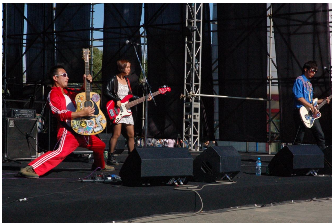
圖一：「八十八顆芭樂籽」現場表演情況