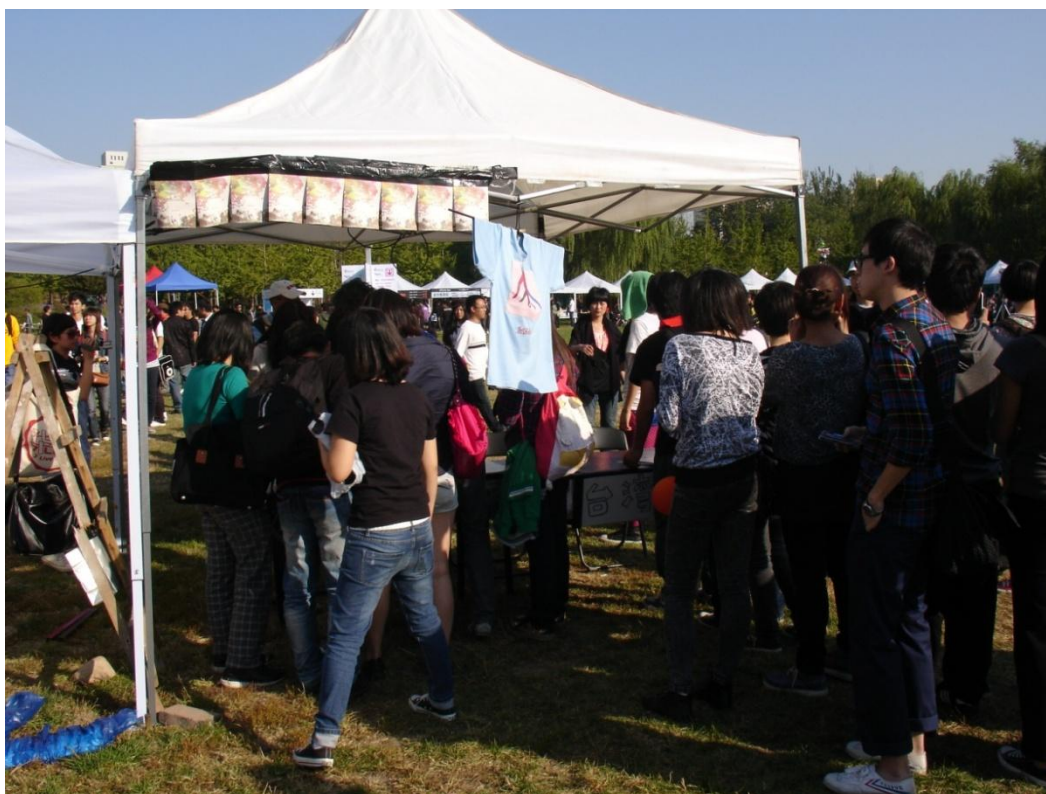
圖七：GO CHIC 表演結束，台灣攤位擠滿等待簽名人潮