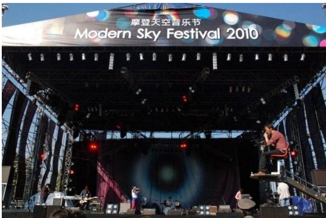
圖六：「GO CHIC」在本次主舞台「摩登舞台」演出