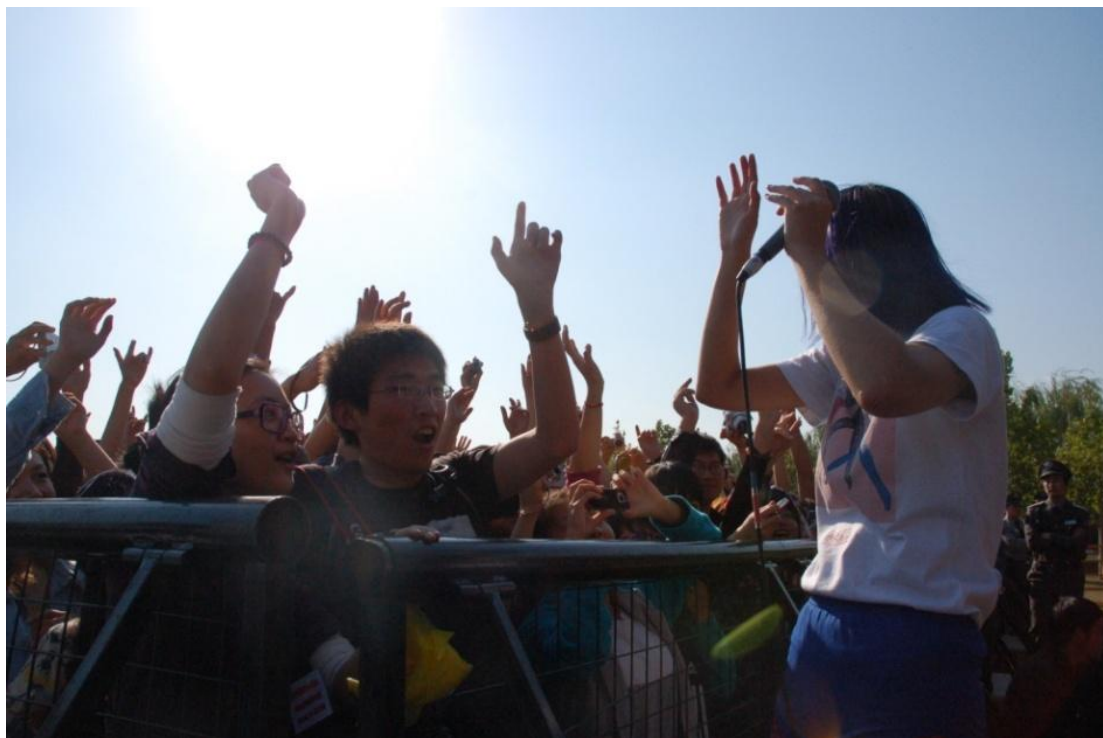
圖五：「GO CHIC」與現場觀眾互動熱烈