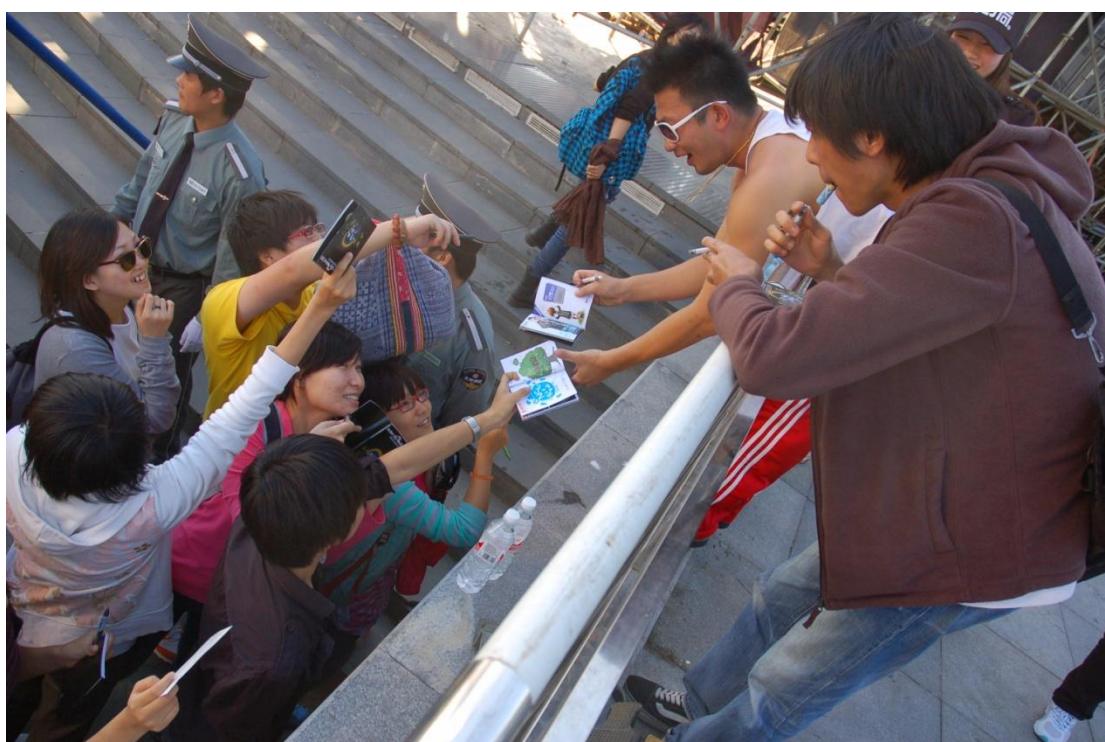
圖二：「八十八顆芭樂籽」表演結束接受現場歌迷索取簽名