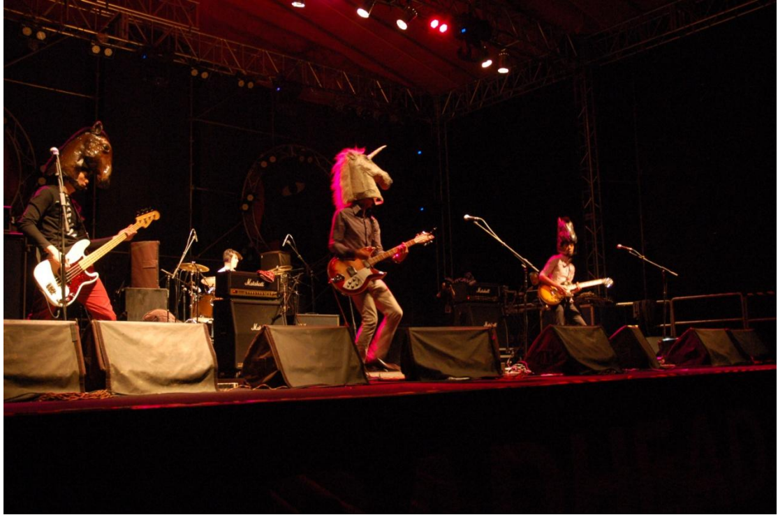
圖三：「拾參樂團」戴上馬臉面具現場演出