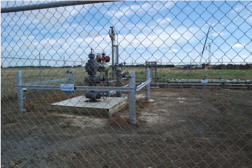
照片八、Otway 封存場址之 CRC-1 注氣井。右側遠方正在動工的正是第二階段的 CRC-2 注氣井。