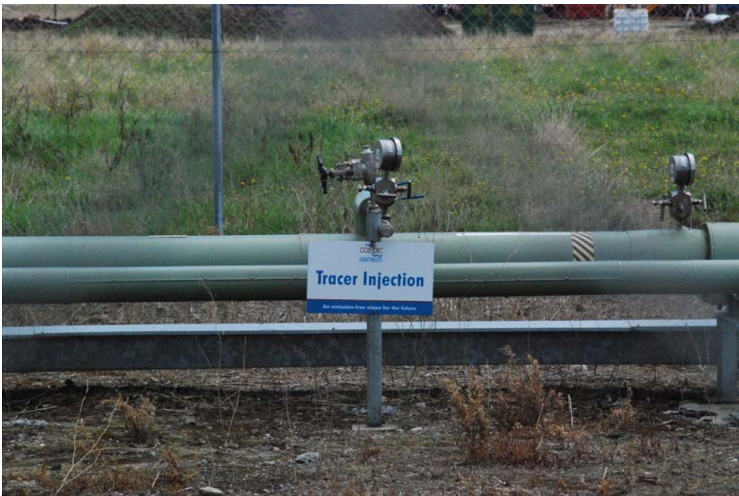
照片九、利用示蹤劑(Tracer)追蹤注入氣之動向