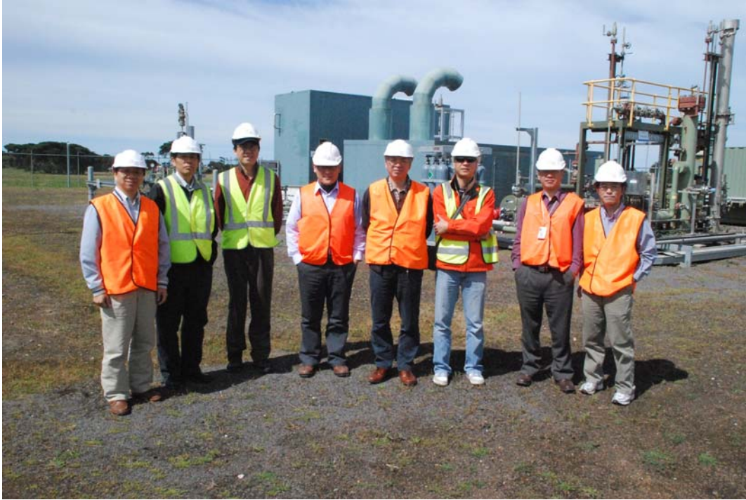
照片十、訪問團合影於注氣設備廠址