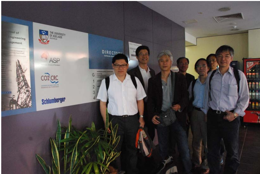
照片六、訪問團於 CO2CRC 阿德雷德大學分部入口處留影