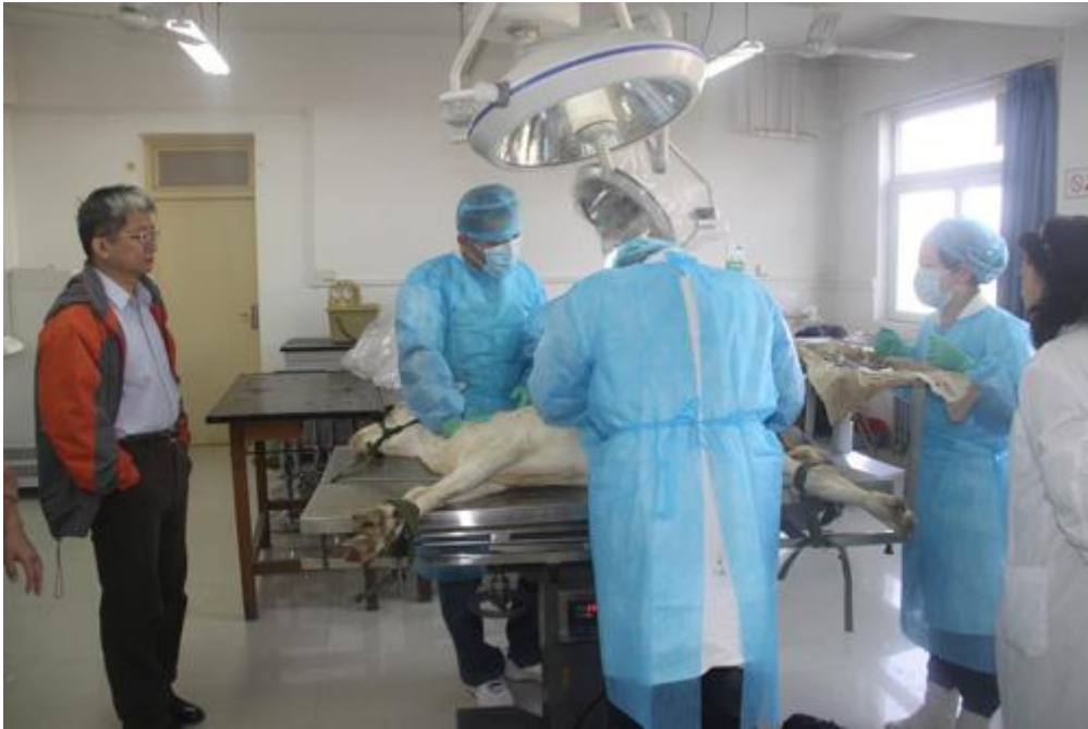
99.11.10 李衛民教授臨床指導