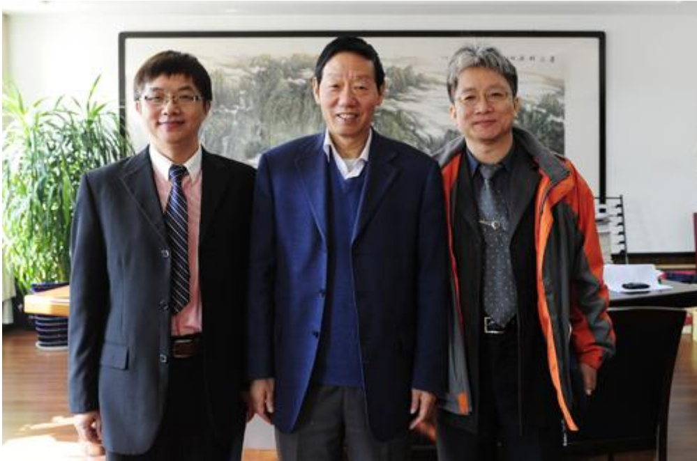
99.11.9 與西北農林科技大學校長會面