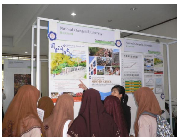
解說政大現有之國際學程