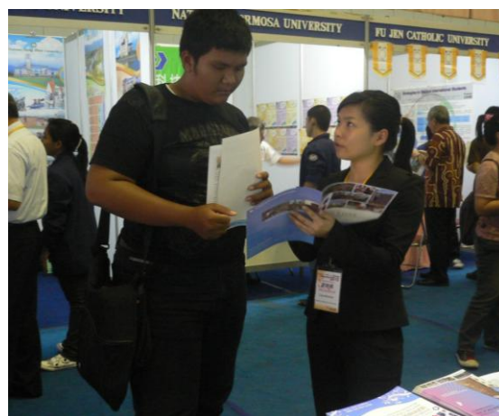
為學生解說國際夏日學程之特色