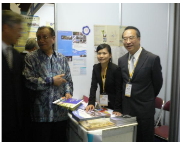
與該校校長及教育部文教處處長合影