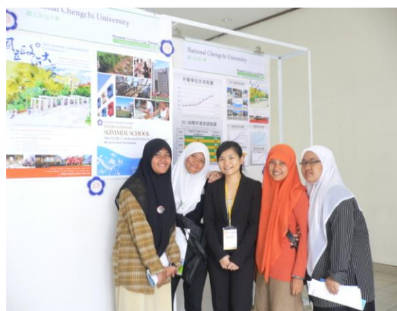
與亞齊大學學生合影