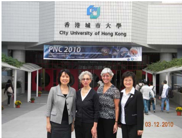
俞主任、廖主任和與會講者美國南加州大學圖書館館長 Catherine Quinlan(右二)及史丹佛大學圖書館 LOCKSS 計畫主持人 Victoria Reich(右三)於會場外合影

PNC 海報展以往一向不是重點，但此次主辦單位城市大學將海報展分為圖書館組(計 26 個單位參加)、一般組(計 18 個單位)及 demo zone(計 11 個單位)，分區展示並作評比、授予獎勵，別有新趣。