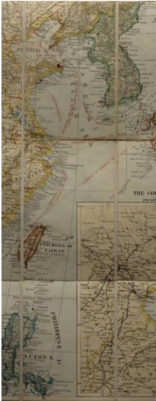
Stanford's map of Eastern China, Japan and Korea 該地圖局部影像