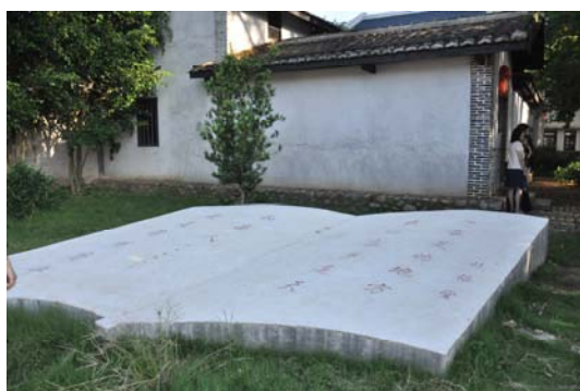
林語堂故居戶外書本展示