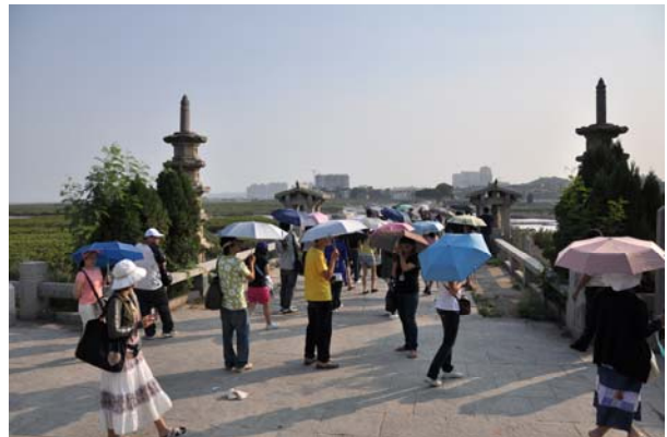
洛陽橋紀念碑(上) 學員參訪洛陽橋(下)