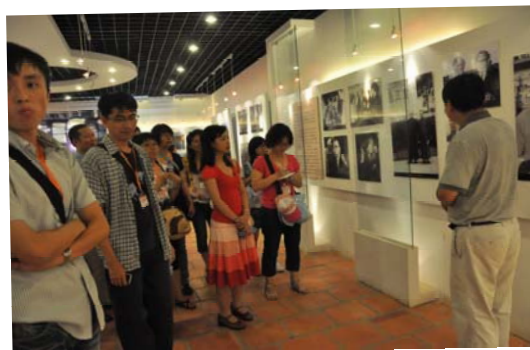
林語堂文學館展場一角