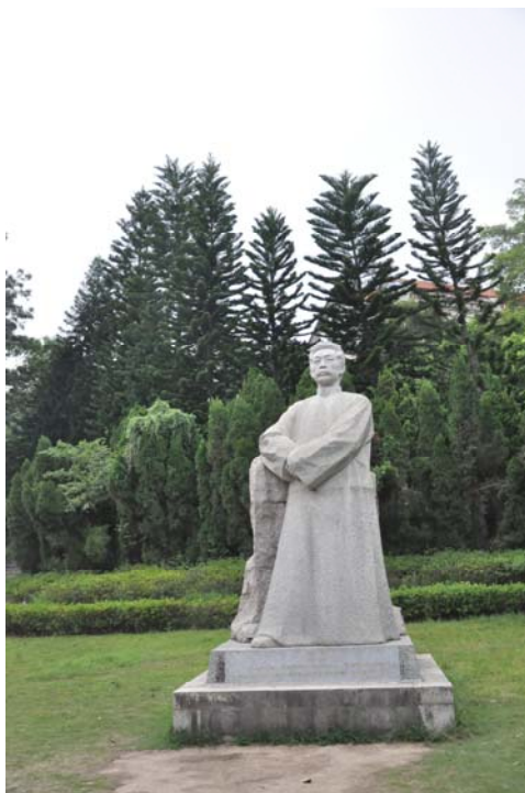
校園中的魯迅雕像

演講結束後，參觀由廈門大學中文系所管理的魯迅紀念館。魯迅紀念館是中國五大紀念館中唯一設於高校的紀念館，設立於 1952 年，紀念室設在集美樓二樓原魯迅先生在該校任教時所居住過的房間，1956 年，為紀念魯迅 75 歲誕辰、逝世 20 週年及到廈大任教 30 年，將原紀念室重新整理，並增設陳列室與著作等相關資料，今日所看到的紀念館，則是 1976 年後廈大對紀念館進行全面整修、補充相關複製文物與照片，並擴大規模，將魯迅紀念室改為魯迅紀念館，門口匾額採用郭沫若先生題字。