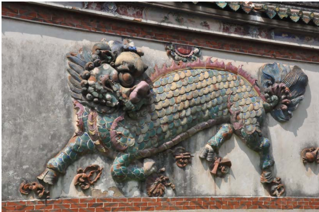
開元寺牆壁上的雕刻藝術

開元寺是福建省內最大的佛教寺院，規模宏大，建築精緻，保留情況相當良好，是中國重點文物保護單位。