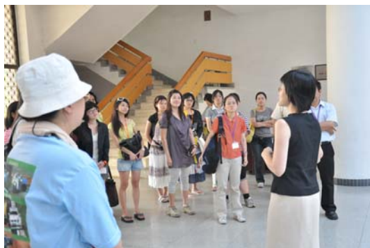
海外交通史博物館館長親自接待

今天的行程第一站就是海外交通史博物館，館長親自接待我們，並安排解說人員為我們導覽。海外交通史博物館從「船式」建築造型上，就可以看出這是一個以船舶和海外交通為主題的博物館，館內有幾個特展，如「海外交通史陳列館」、「古船陳列館」、「中國古代船模館」、「宗教石刻與海外民俗陳列館」。「海外交通史」陳列館是主要也最屬規模較大的大展，展出古代泉州(古稱刺桐)的歷史，展場有大量的文物與模型、古地圖、生活物件，可以看出古刺桐港的興衰，「古船陳列館」展出修復後的宋代海船及各種貨船、客船、漁船和出使船等等。