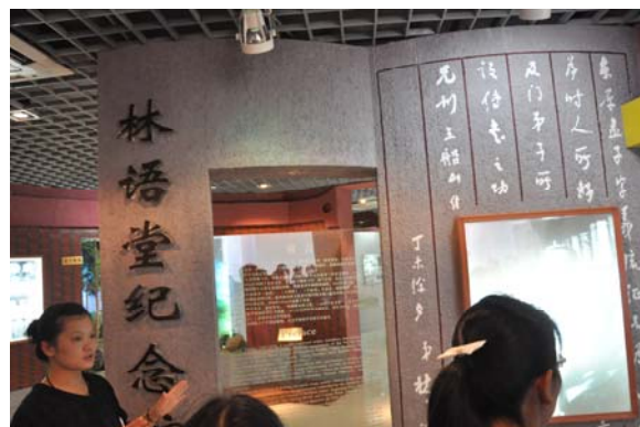
解說員為來訪學生進行展場導覽