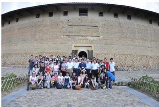
管隊學員於「二宜樓」土樓前合影

世界文化遺產「土樓」的參觀經驗是非常獨特的，土樓的存在與過去閩粵山區的匪盜之存在有相當大的關聯性，有鑑於這樣的社會環境，相同血脈、同姓氏的宗族便會聚集而居，透過修築大型的土樓建築，達到防禦的效果。此次參觀的土樓為圓形結構，此外也有方形的土樓，根據調查，福建土樓目前約有三千多幢，位於華安縣的土樓現存 68 幢，我們這次所參觀的華安土樓也是這些保留下來的土樓當中，較具有鮮明的地域色彩和特殊歷史價值、藝術價值、科學價值的，尤其以「二宜樓」可作為其中代表、傑作，也是中國傳統民居的瑰寶。