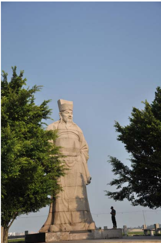
洛陽橋橋頭蔡襄雕像

參觀洛陽橋是個很有趣的經驗，因為洛陽橋的建橋過程已經跟神話傳說融合在一起。洛陽橋是宋代泉州郡守大書法家蔡襄所建，是中國第一座跨海的大石橋，原名萬安橋，始建於 1053 年，並且整整花了六年的時間才興築完畢，素有「海內第一橋」之譽，在橋的起點處，有個巨大的蔡襄的紀念雕像，走過橋到另一側，有紀念石碑與公祠，是個知名的觀光景點。蔡襄曾寫〈萬安橋記〉，其碑刻是書法珍品，現在保存在橋頭蔡忠惠公祠內。