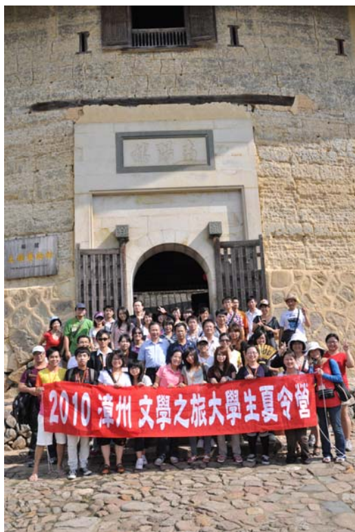
營隊學員於「南陽樓」土樓前合影