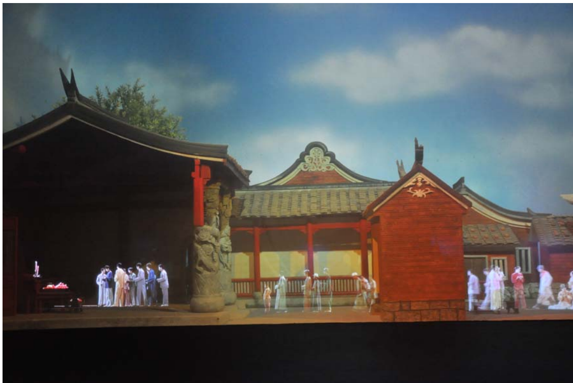
利用 3D 投影效果製作的展示內容，有動態影像呈現生活面貌

晚間前往泉州師範學院參加由泉州師院籌畫的文藝晚會，該校安排了南音、提線木偶「小沙彌下山」表演等精采表演， 第七天 泉州師院並邀請了已經與中央電視台簽約的五位傑出校友回來獻唱，五位男歌手展現高超的和聲之美，此外還有舞蹈表演、令人印象深刻的戲劇表演，互動遊戲等等，台灣赴大陸的學生們也分別以四個節目表演參與、回應。