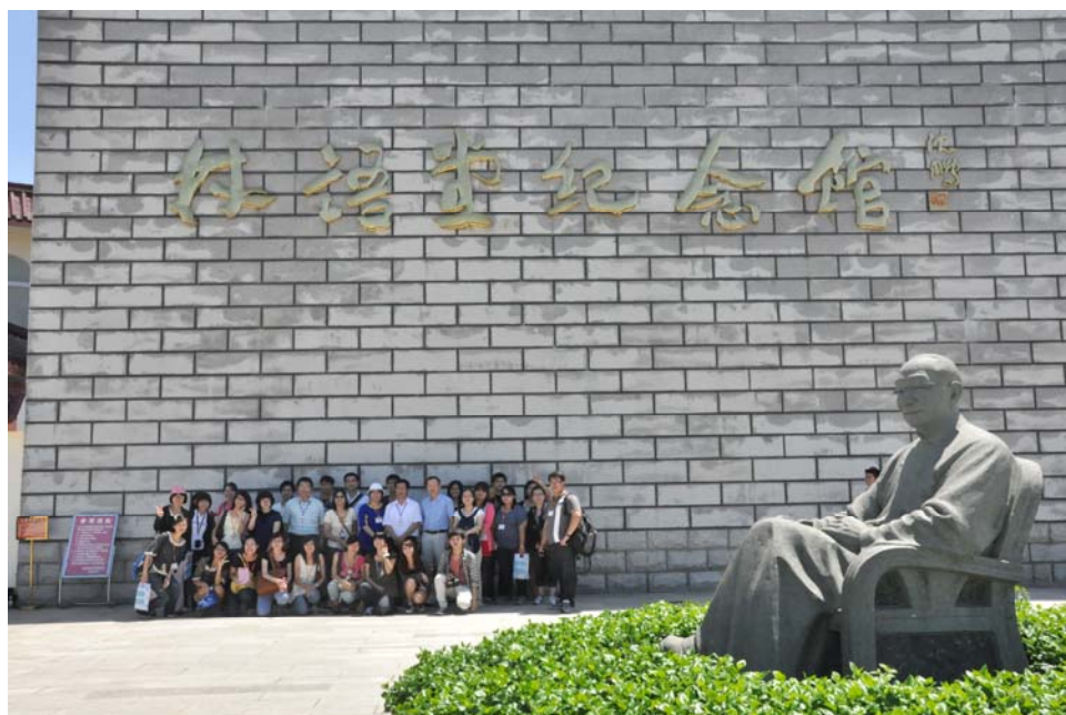
參訪營隊於林語堂紀念館留影

位於薌城的林語堂紀念館，座落於天寶鎮五里沙村，是中國第一家林語堂紀念館，佔地約 30 多畝，附近有廣闊的香蕉園圍繞著，建築風格融合中西，頗能展現林語堂的一生文學精神，林語堂在中國現代文學史上被稱為「腳踏中西文化兩隻船」的人，其紀念館廣場上有 2 米高的林語堂坐式雕像，林語堂雙親的合葬墓就在紀念館後的不遠處。