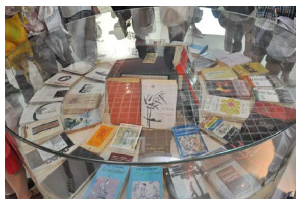
林語堂一生著作展示