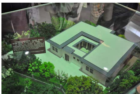
位於台北的林語堂紀念館模型