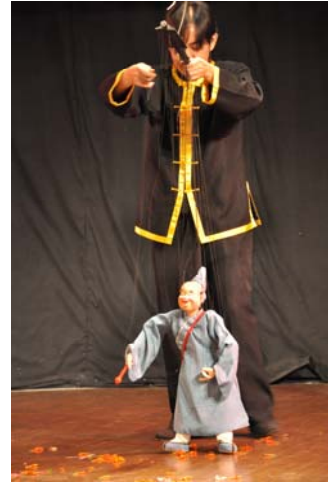
提線傀儡〈小沙彌〉演出(右)