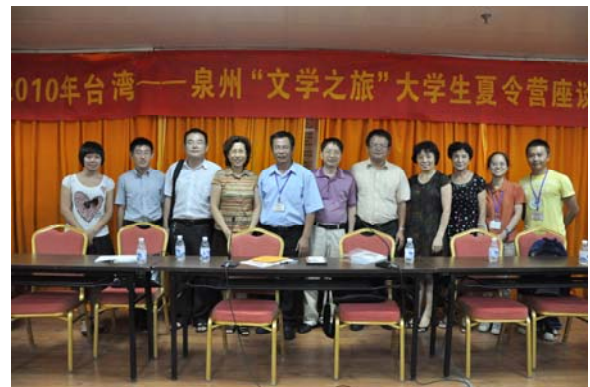
晚間在泉州師院舉辦一場交流座談會，泉州師院師生皆到場參加。