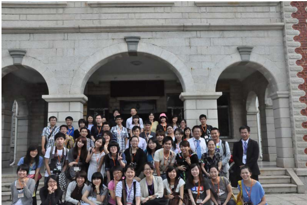
營隊學員於廈門大學人文學院入口留影