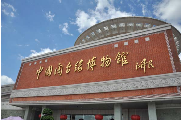
中國閩台緣博物館(左)