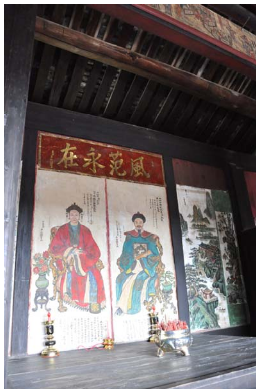
二宜樓內隨處可見書畫等藝術作品