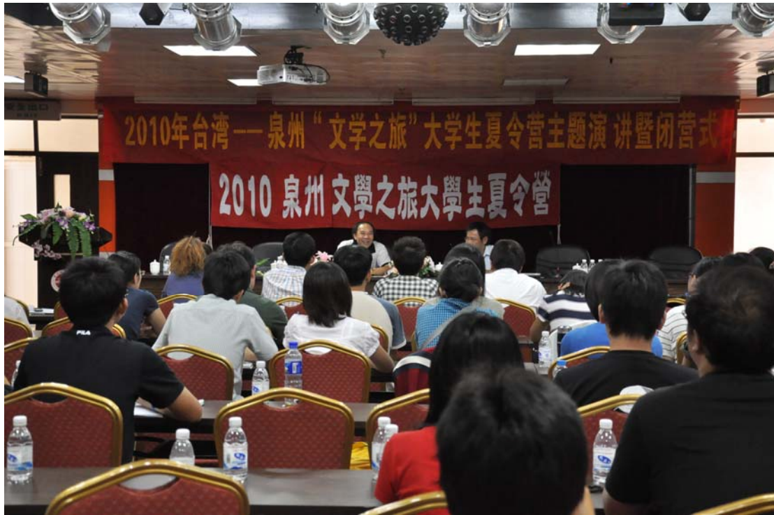
2010 廈門·漳州·泉州文學之旅大學生夏令營閉幕式