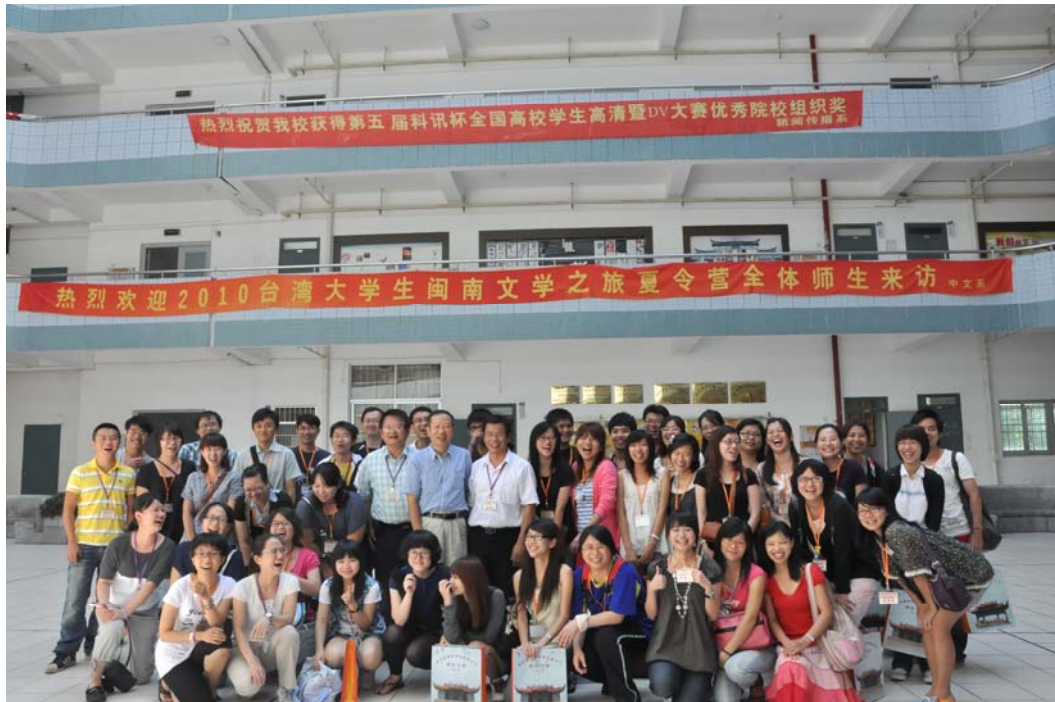
參訪營隊於漳州師院留影，漳州師院贈送叢書給來訪師生

位於薌城的林語堂紀念館，座落於天寶鎮五里沙村，是中國第一家林語堂紀念館，佔地約 30 多畝，附近有廣闊的香蕉園圍繞著，建築風格融合中西，頗能展現林語堂的一生文學精神，林語堂在中國現代文學史上被稱為「腳踏中西文化兩隻船」的人，其紀念館廣場上有 2 米高的林語堂坐式雕像，林語堂雙親的合葬墓就在紀念館後的不遠處。