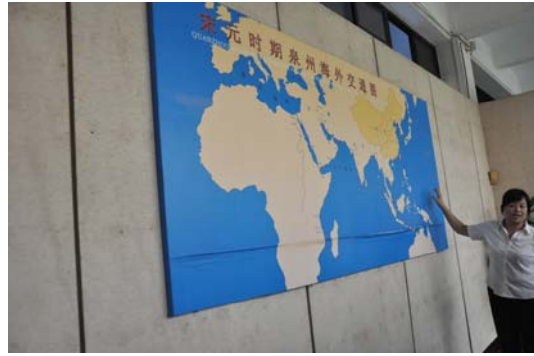
宋元時期海外交通地圖