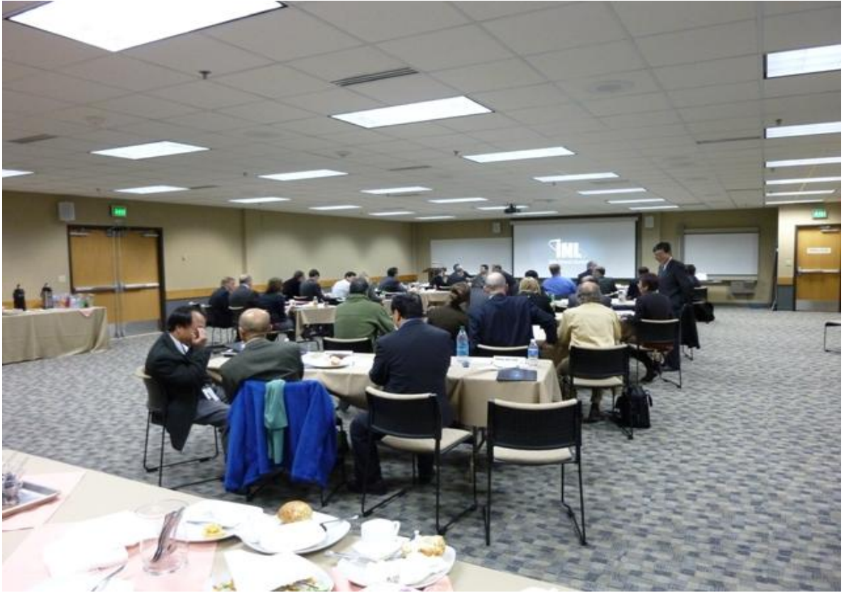
圖 5. 2010 台美民用核能合作會議 INL EROB 會場(2)