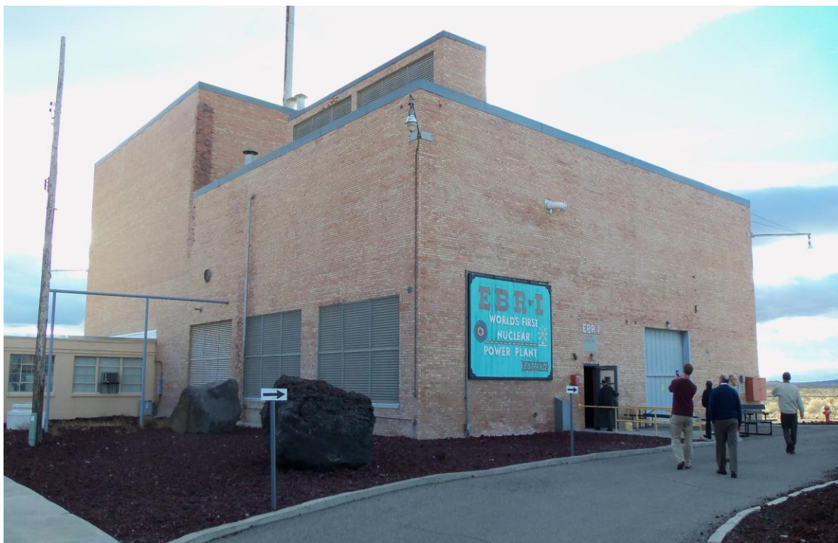
圖 2. 參訪 Idaho National Lab. EBR-1