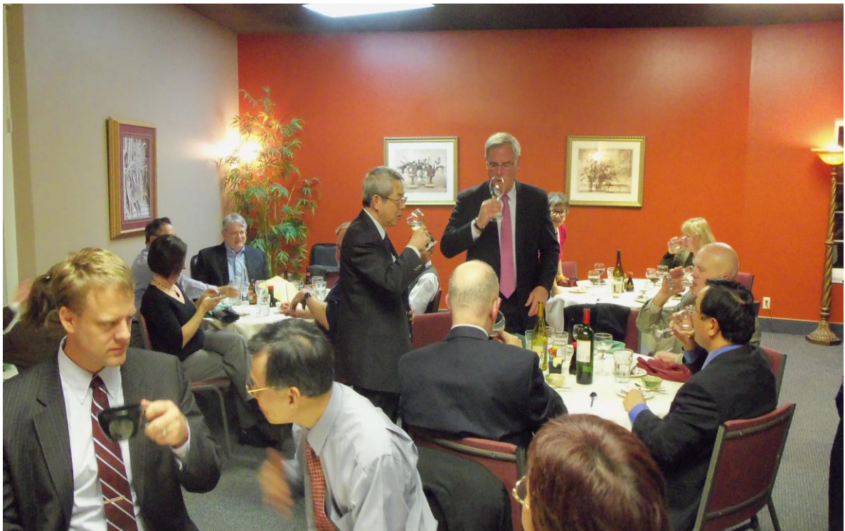
我方答謝美方主辦 2010 會議晚宴