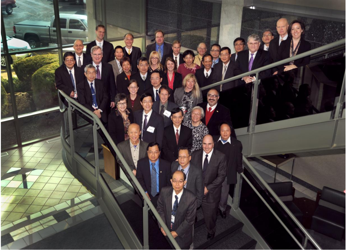
圖 7.台美民用核能合作會議出席人員於 INL EROB Building 會場合照