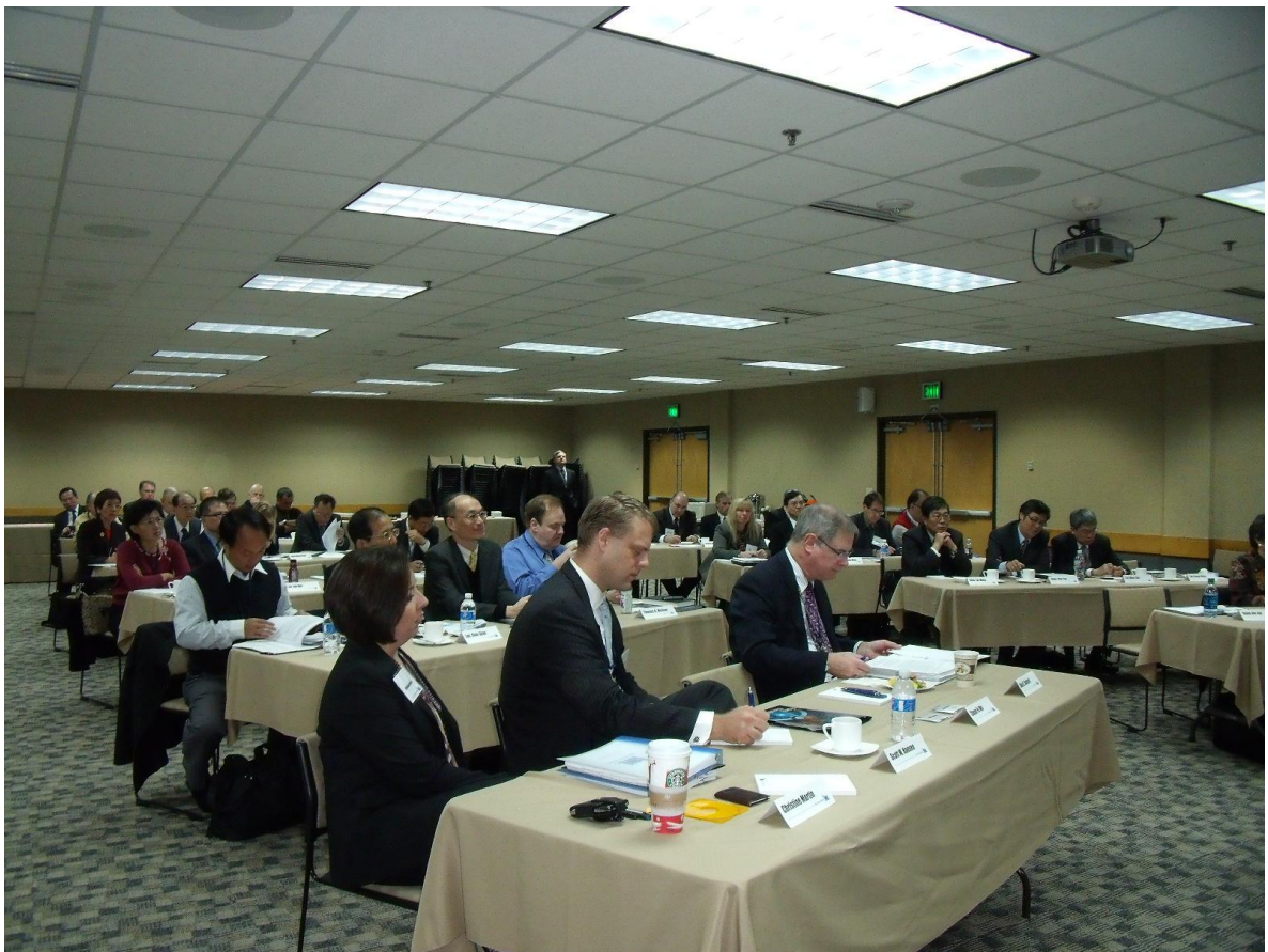
圖 4. 2010 台美民用核能合作會議 INL EROB 會場(1)