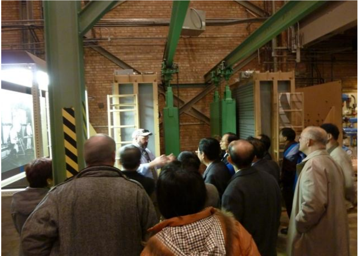
圖 3 我國代表團參觀一號實驗滋生反應器(EBR-1)