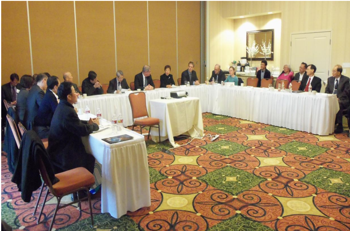
圖 6. 2010 台美民用核能合作閉幕 (Hilton Garden Inn)