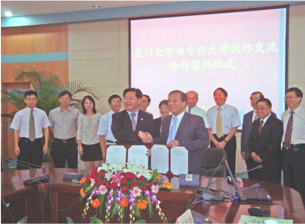
99.07.28 與廈門大學簽訂姊妹校合約