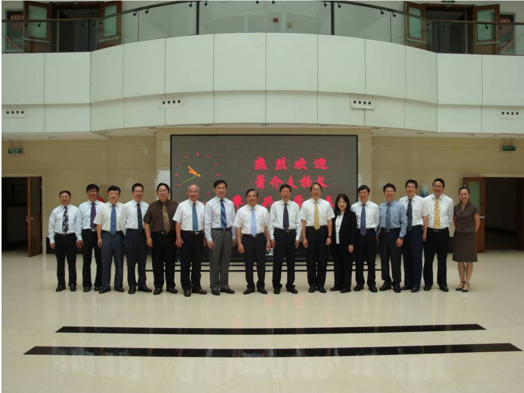
99.08.02 於西北農林科技大學內之合影