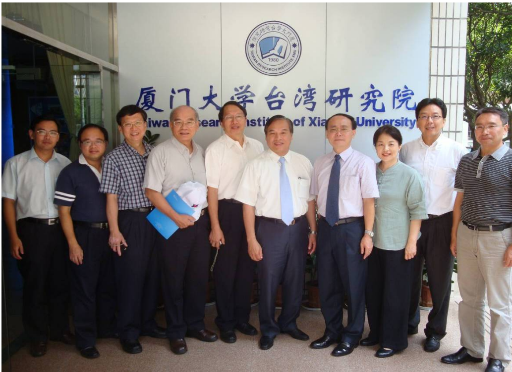
99.07.29 於廈門大學台灣研究院前合影