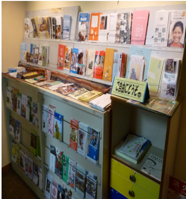
JANIC 於入口處一角 放置日本國內 NGO 的摺頁簡介