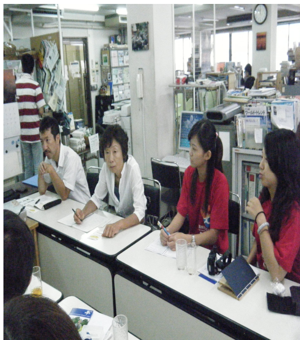
出席人員交流互動