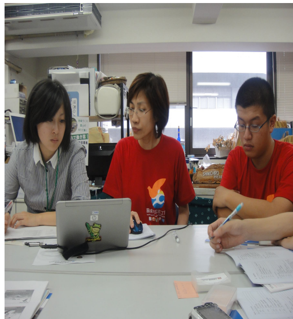
青輔會第三處志願服務業務簡報