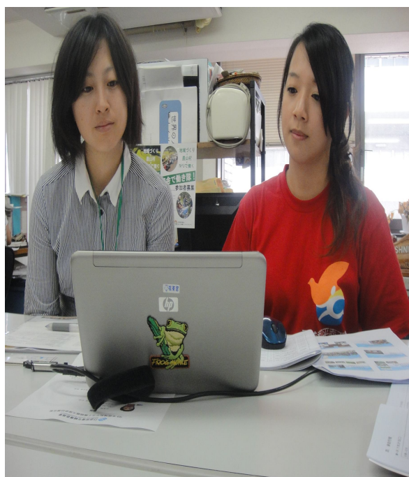
績優團隊教育類代表服務計畫簡報