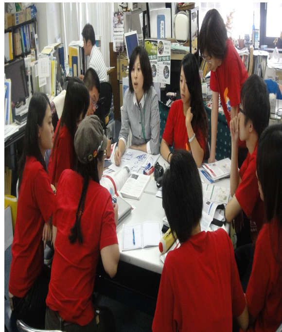
出席人員交流互動