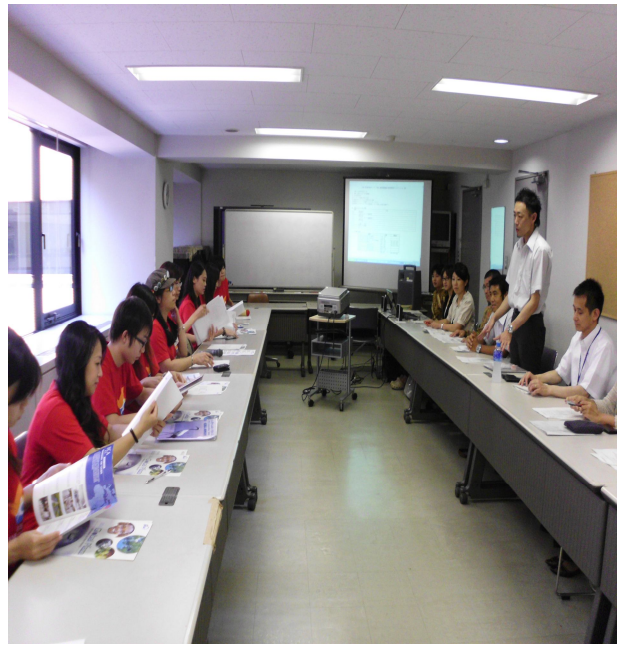
JICA 印尼災害重建志工服務計畫簡報