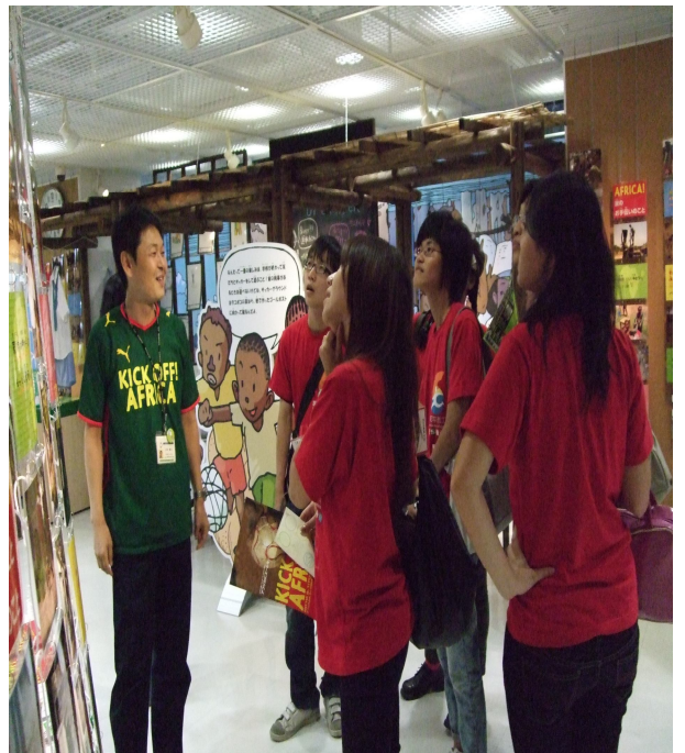
JICA 一樓非洲主題展 (此區為非洲國小學童教室場景)