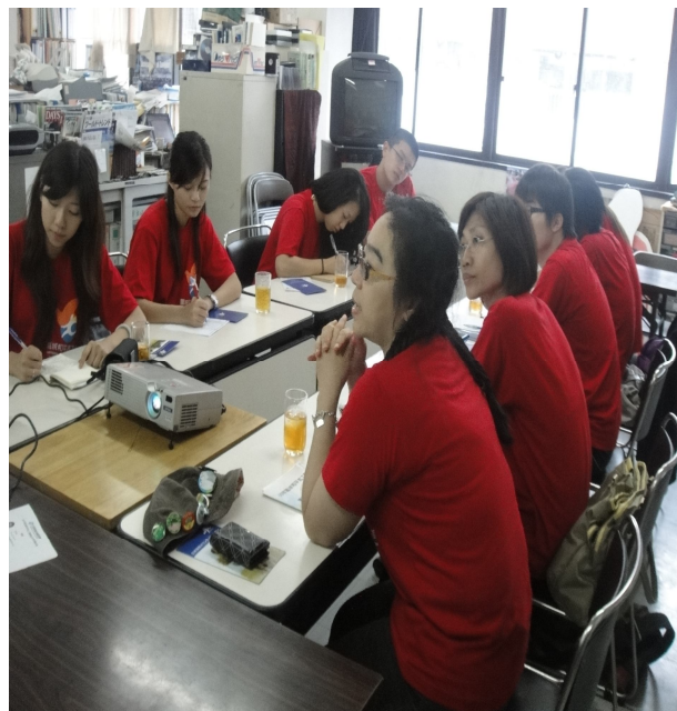
績優團隊參訪一行人員聆聽 JVC 簡介