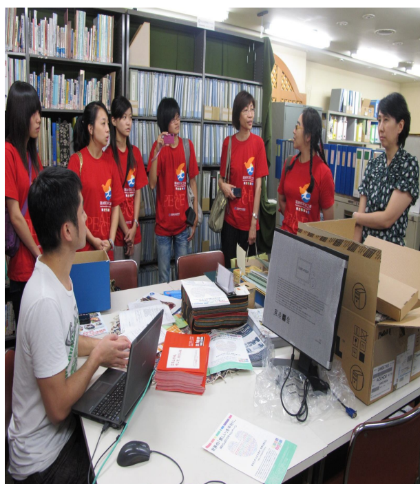
位於 JANIC 辦公室旁一隅的圖書室圖 中座者為當日前來服務的青年志工)