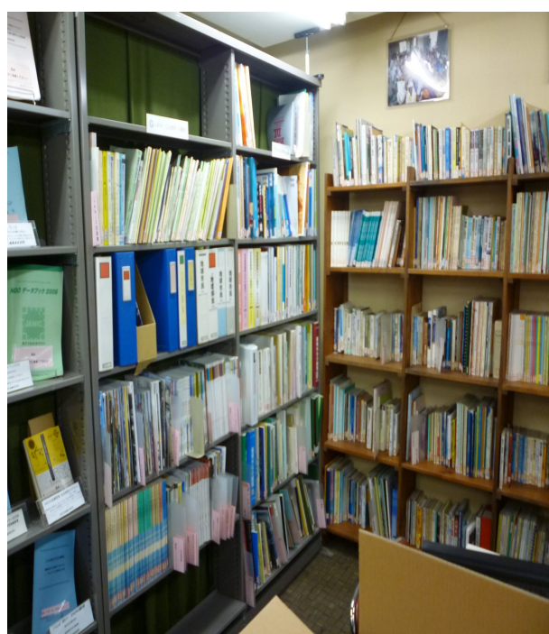
JANIC 的圖書室 (包括日本國內 NGO 出版的書籍、期刊、研究報告等資料)