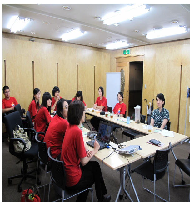
志願服務業務簡報與交流互動