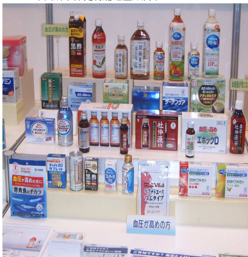
圖 3、4、5、6 日本健康營養食品協會攤位展示 不同訴求保健功能之產品展示