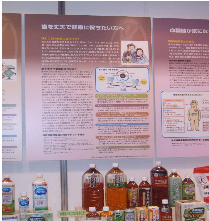
日本特定保健食品之分類介紹及申請流程