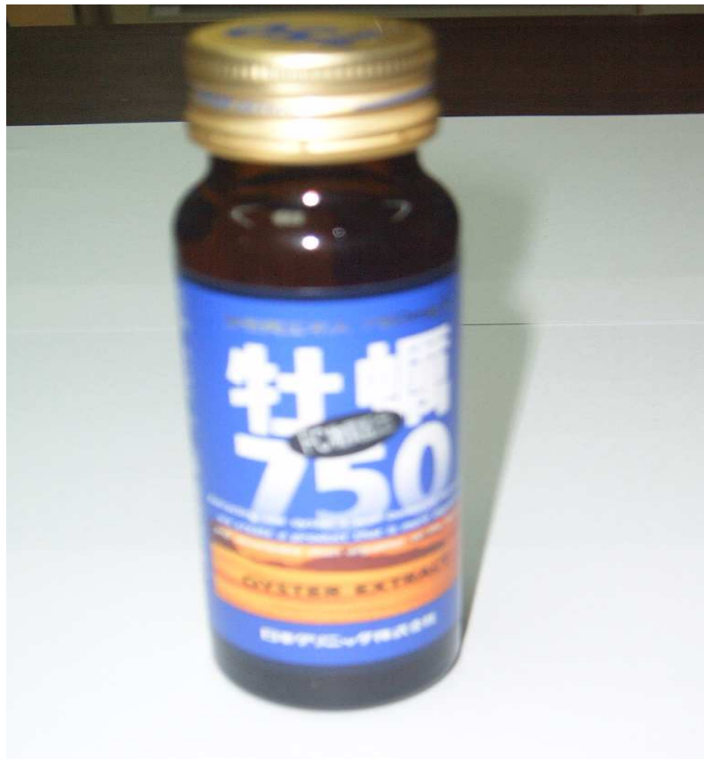
圖 9 牡蠣口服液

三.而本事業部較擅長之水產類保健產品此次也蒐集到日本國內類同之牡蠣口服液及蠔蜆類產品，見圖 9、10；這牡蠣口服液是以清涼飲料配方模式開發，即類似台灣康貝特、蠻牛提神飲料之酸甜口感，該產品並添加了防腐劑安息香酸（對苯甲酸）輔助保存，此與本事業部所生產之「蠔蜆精」採用鹹味口感為主是截然不同之設計思考，在本公司推出「蠔蜆精」同時，國內某一廠商也曾出品一項蠔精產品，也是採用上述類似酸甜清涼飲料配方設計，但產品推出上市後，不符合台灣消費者之需求，產品已停止販售，所以如前所言市場消費者之認知才是產品開發最大挑戰。而另一項日本的「蠔蜆錠」產品，其命名為「肝活源」，該產品之成分為酵母、蜆萃取物、牡蠣萃取物及相關賦型劑、維生素等，並未取得「特定用保健品」認證（但其命名有”肝”器官這在國內已涉及影射違反食品衛生管理法），該產品是以糖衣錠型態上市，與本公司之膜衣錠型態不同，而且咬開其內錠成分以酵母粉口味為主，口感不是很理想，而本公司蠔蜆錠產品除了口感佳外，經功能性測試又具有保護肝臟功能，可見本公司之蠔蜆錠產品已有國際水準的設計，可與國際性同質類產品競爭。