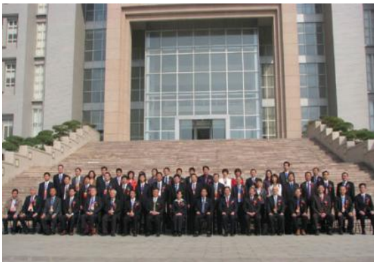
圖 5、參加兩岸高校校長座談會全體與會人員於鄭大行政大樓前合影

本日在鄭州大學舉行兩岸高校校長座談會。早上為開幕及高教主題發表，包括探討兩岸高校聯合培養人才合作模式、台灣高等技職教育發展歷史經驗、促進優勢互補、深化交流合作等，並朝向推動台灣與河南高校之合作新契機。此外，鄭州大學由原有三校合併成一所全方位之綜合大學。因此鄭州大學申校長也分享了鄭州大學的轉型與邁向高品質的實踐和探索。