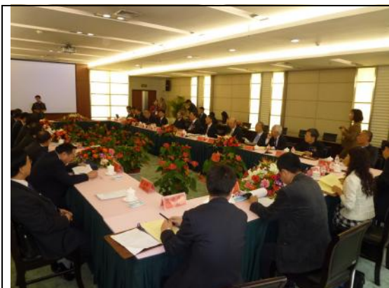
圖 9、兩岸高校校長座談會

經由本次座談，兩岸高校彼此間更增進瞭解，為未來加強兩岸合作找到新的切入點。兩岸的高等教育交流合作發展迅速、前景廣闊。本日除了座談會外，鄭州大學亦安排參訪大學校園。座談會結束後，晚上餐敘，進一步溝通討論兩岸學校教育合作之未來發展，增進兩岸間的瞭解與互動。