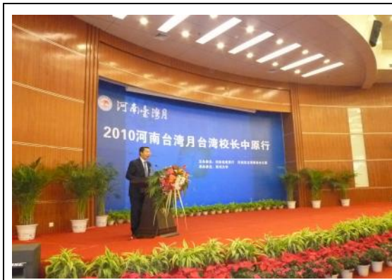
圖 7、鄭大校長於兩岸高校校長座談會開幕式致歡迎詞