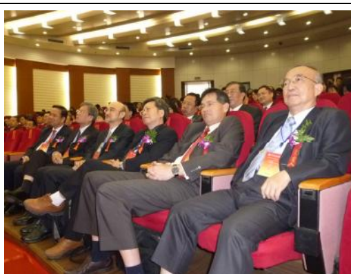
圖 8、國內大專院校校長出席開幕式

為適應高等教育國際化發展的趨勢，大陸學校也積極開展廣泛的國際交流與合作。不僅持續與歐洲、美洲、亞洲和澳洲等國家進行文化教育及學術交流，並建立校際間友好合作的關係，同時朝往開展多層次的聯合辦學、互派留學生、文化教育交流等實質互惠活動。對台灣的大學院校，因語言及文化的同質性，在各方面的交流上，便利許多。特別是對於我國的中國文化傳統保留的完整性與紮實度、高教發展的經驗與良好模式，無疑可以做為大陸高校發展的標竿與學習模式。