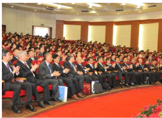
圖 6、兩岸高校校長座談會開幕式