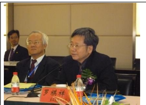
圖 10、本校羅副校長於座談會中發言