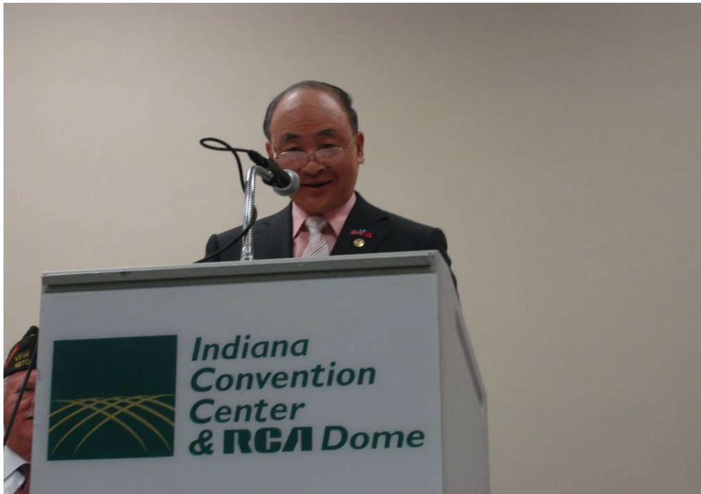
附圖 9：曾主任委員受邀在 VFW 安全與外交理事會致詞