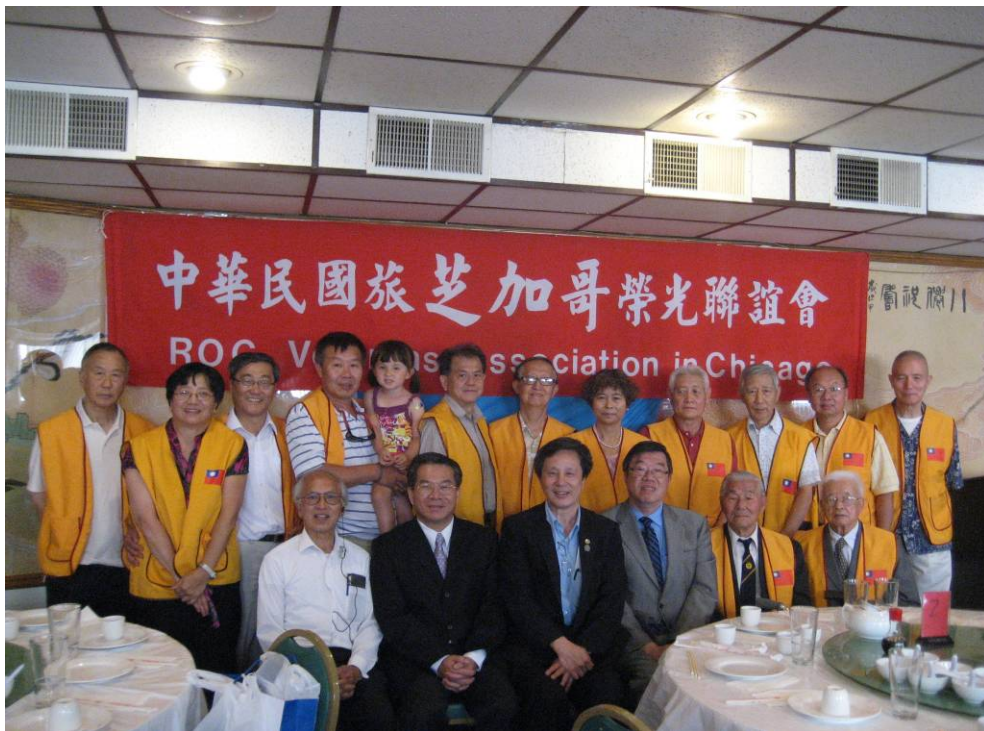
附圖 42：宋處長與芝加哥榮光聯誼會理監事合影