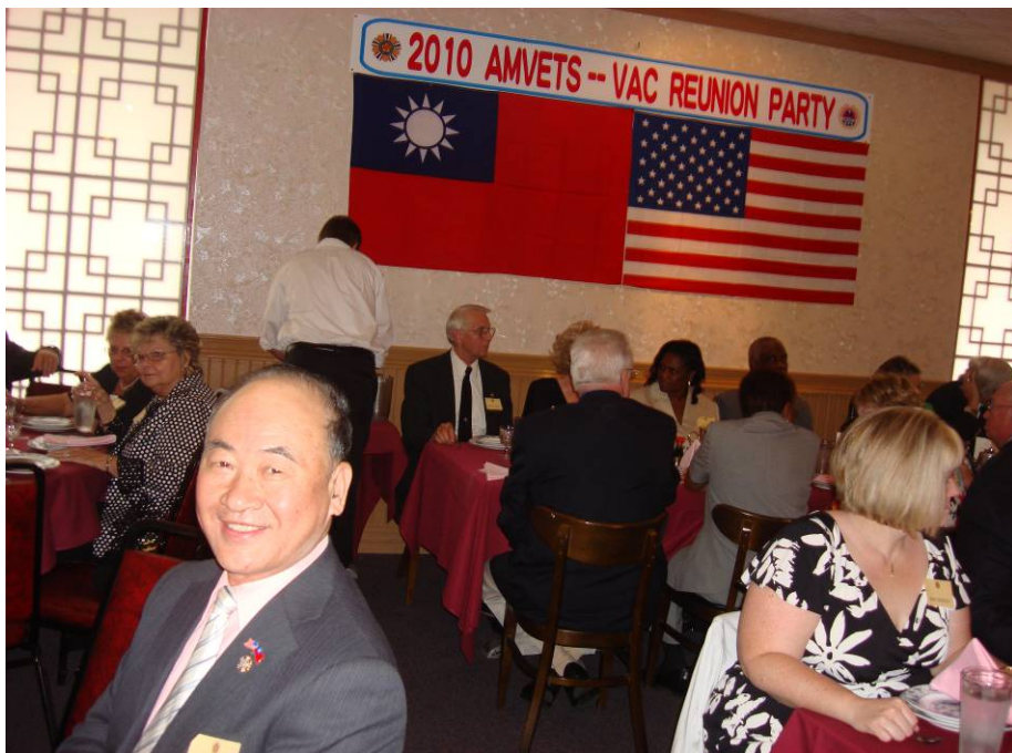
附圖 7：曾主任委員與 AMVETS 歷屆總會長餐敘