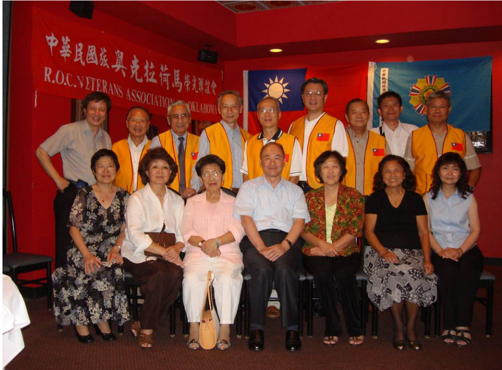
附圖 39：曾主任委員與奧克拉荷馬榮光聯誼會理監事合影