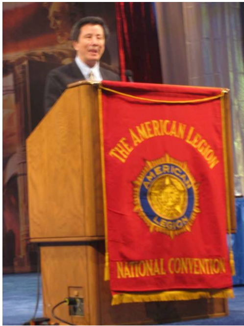
附圖 13：宋處長代表主任委員在 AL 聯合開幕式上致詞