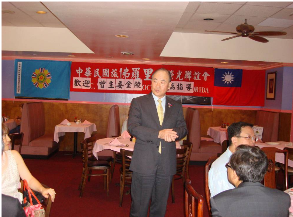
附圖 37：曾主任委員向佛羅里達榮光聯誼會理監事介紹本會工作現況