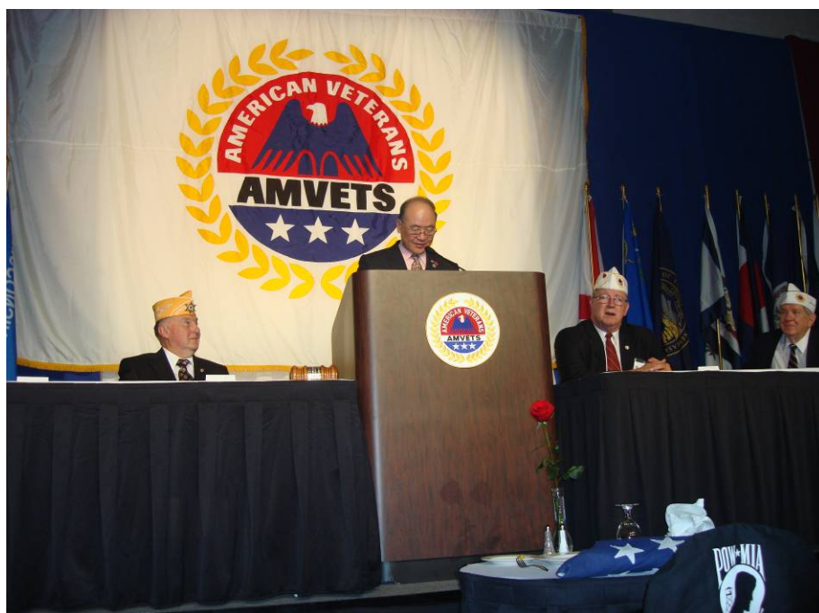
附圖 3：曾主任委員受邀在 AMVETS 大會開幕式致詞