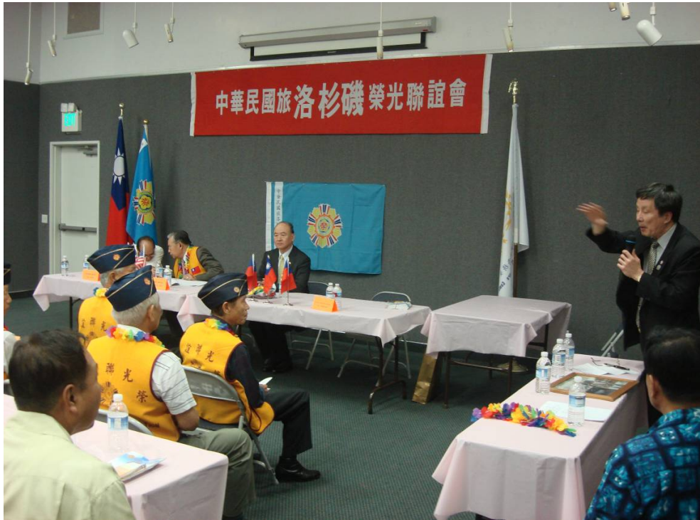
附圖 45：曾主任委員與宋處長解答洛杉磯榮光聯誼會理監事座談會現場提問