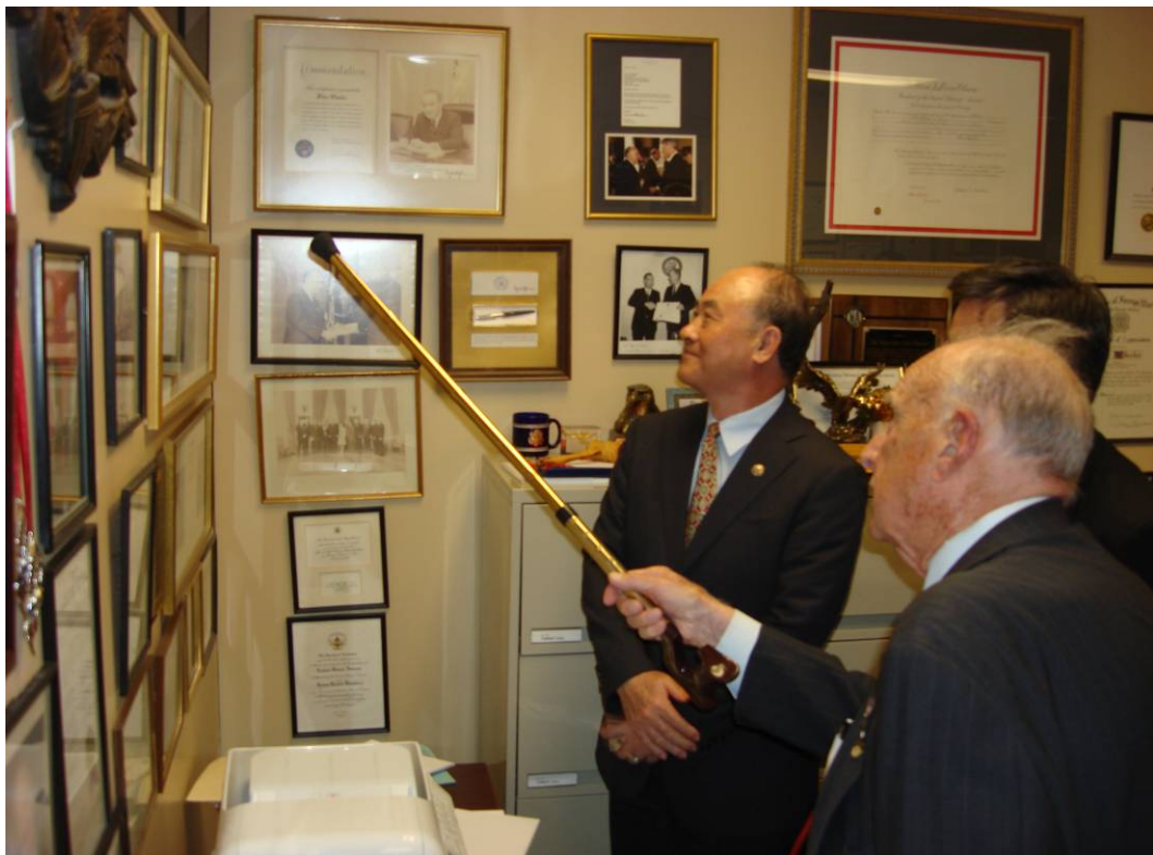
附圖 28：美國喬治亞州退伍軍人事務處惠勒處長（Gen. Wheeler）向曾主任委員一行介紹該處沿革