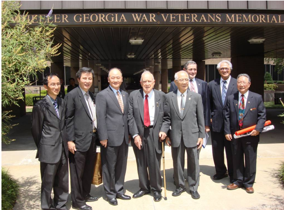
附圖 27：曾主任委員一行與美國喬治亞州退伍軍人事務處惠勒處長（Gen. Wheeler）等合影