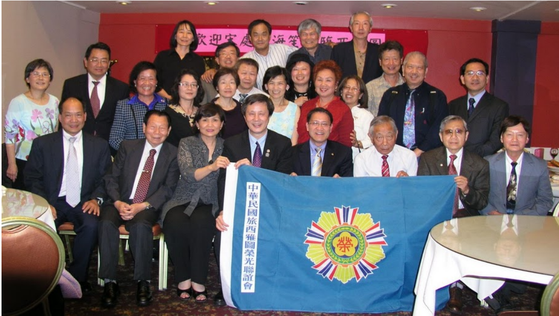
附圖 41：宋處長與西雅圖榮光聯誼會理監事合影