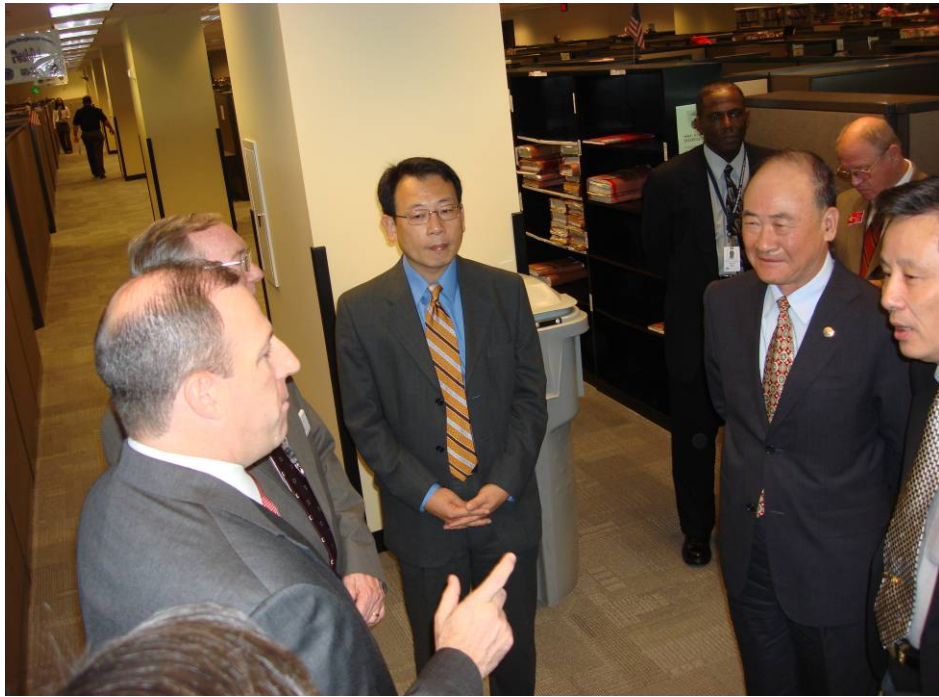
附圖 25：曾主任委員一行參觀美國退伍軍人事務部亞特蘭大地區辦事處退伍軍人醫療檔案電子化作業區