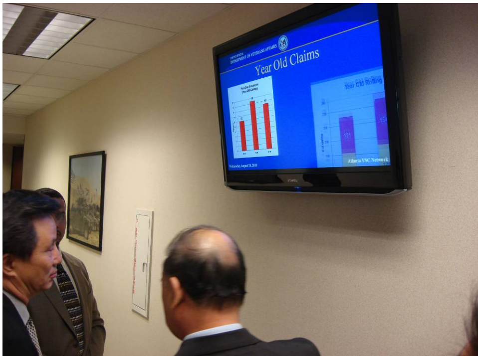
附圖 26：曾主任委員一行參觀美國退伍軍人事務部亞特蘭大地區辦事處動態績效電子看板