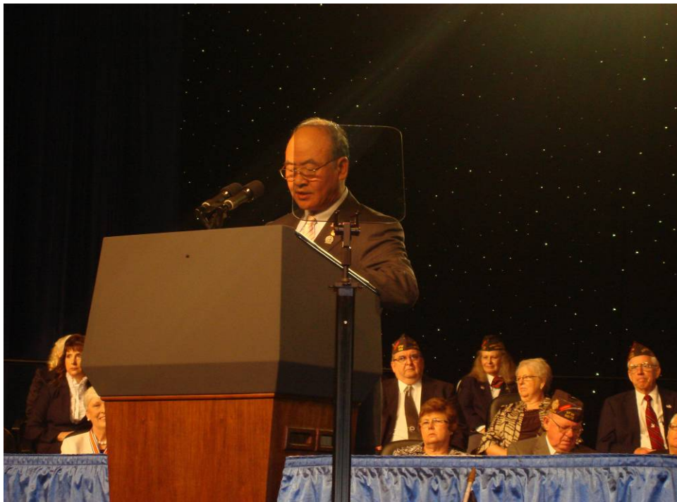
附圖 8: 曾主任委員受邀在 VFW 年會大會開幕式致詞