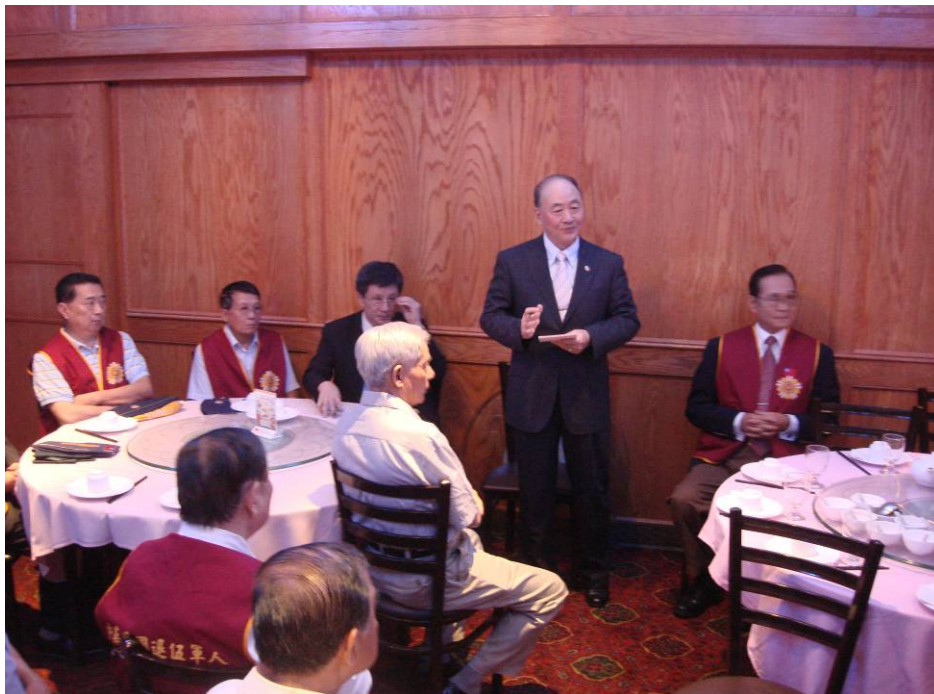
附圖 44：曾主任委員與紐約榮光聯誼會理監事座談