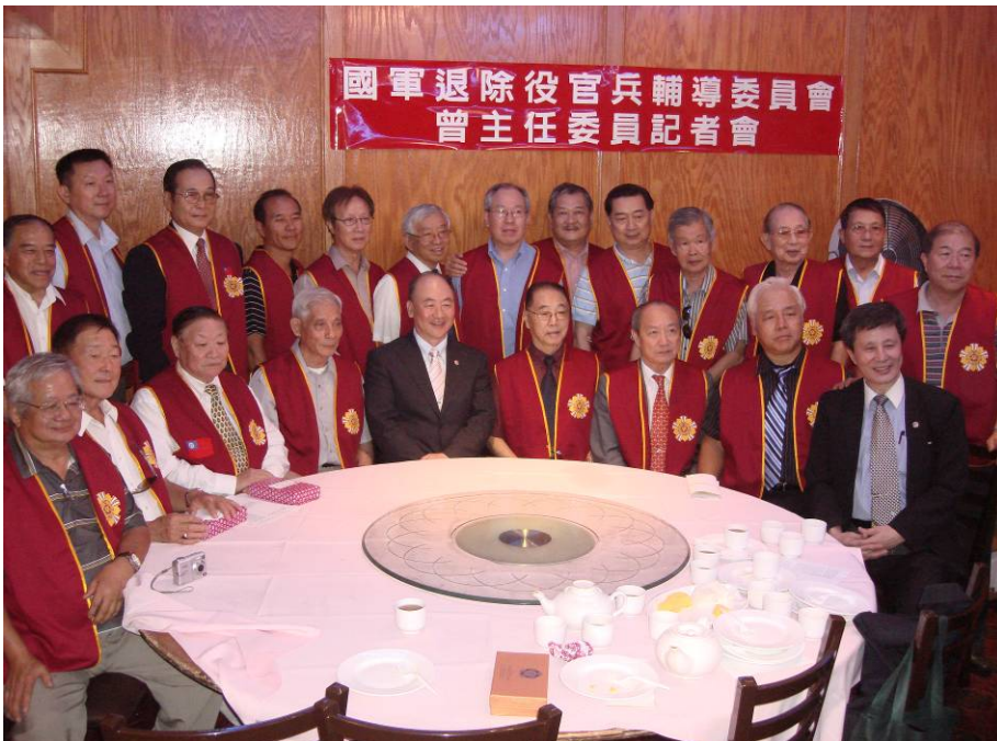
附圖 36：曾主任委員與紐約榮光聯誼會理監事合影