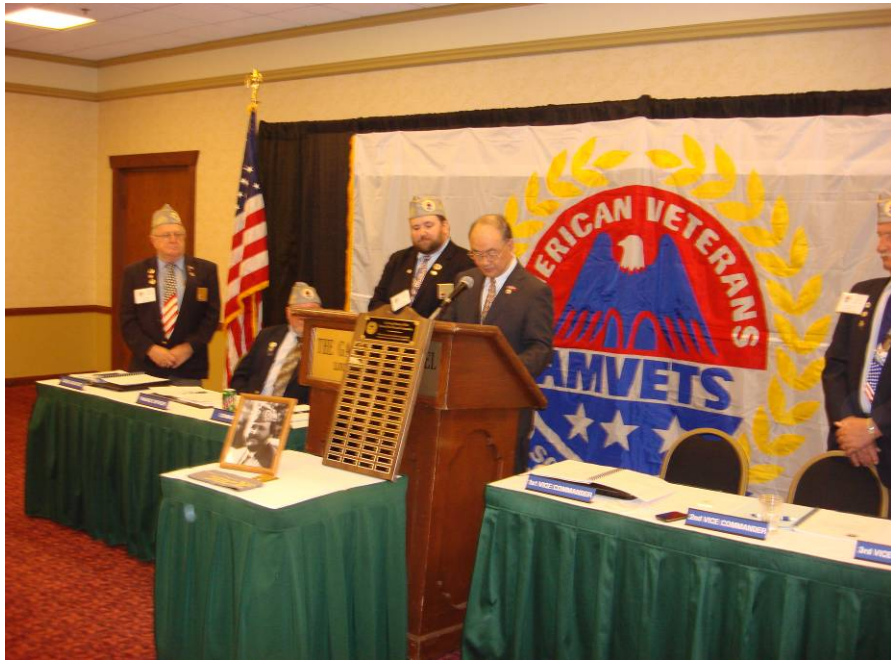
附圖 5：曾主任委員受邀在 AMVETS 子弟會致詞