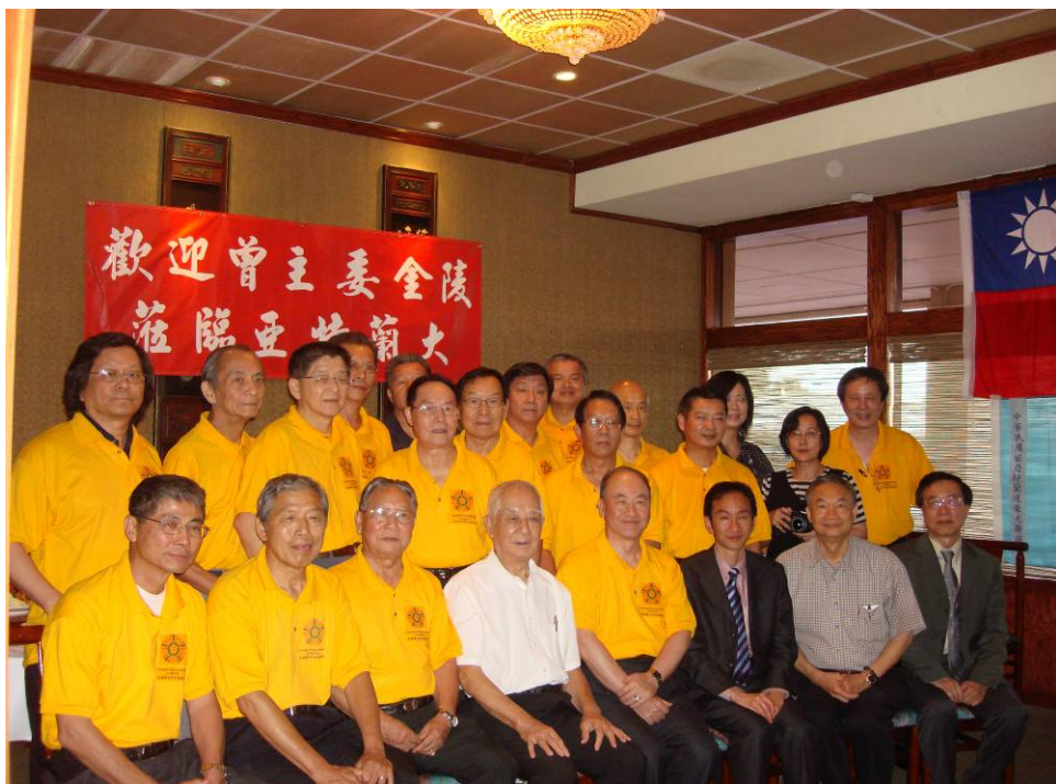
附圖 38：曾主任委員與亞特蘭大榮光聯誼會理監事合影