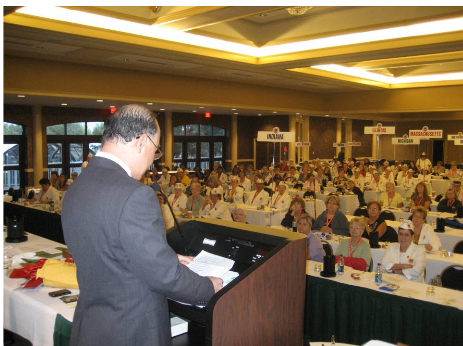
附圖 4：曾主任委員受邀在 AMVETS 婦女會致詞