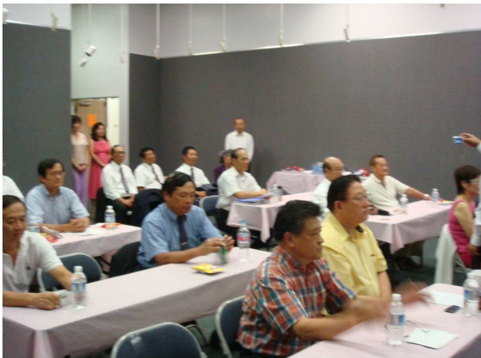
附圖 46：洛杉磯榮光聯誼會理監事參加與曾主任委員座談