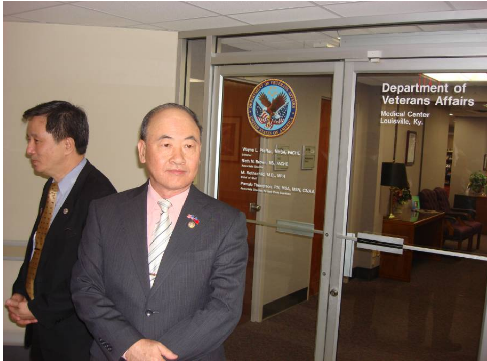
附圖 23：曾主任委員參觀退伍軍人事務部駐肯塔基醫療中心醫療設施