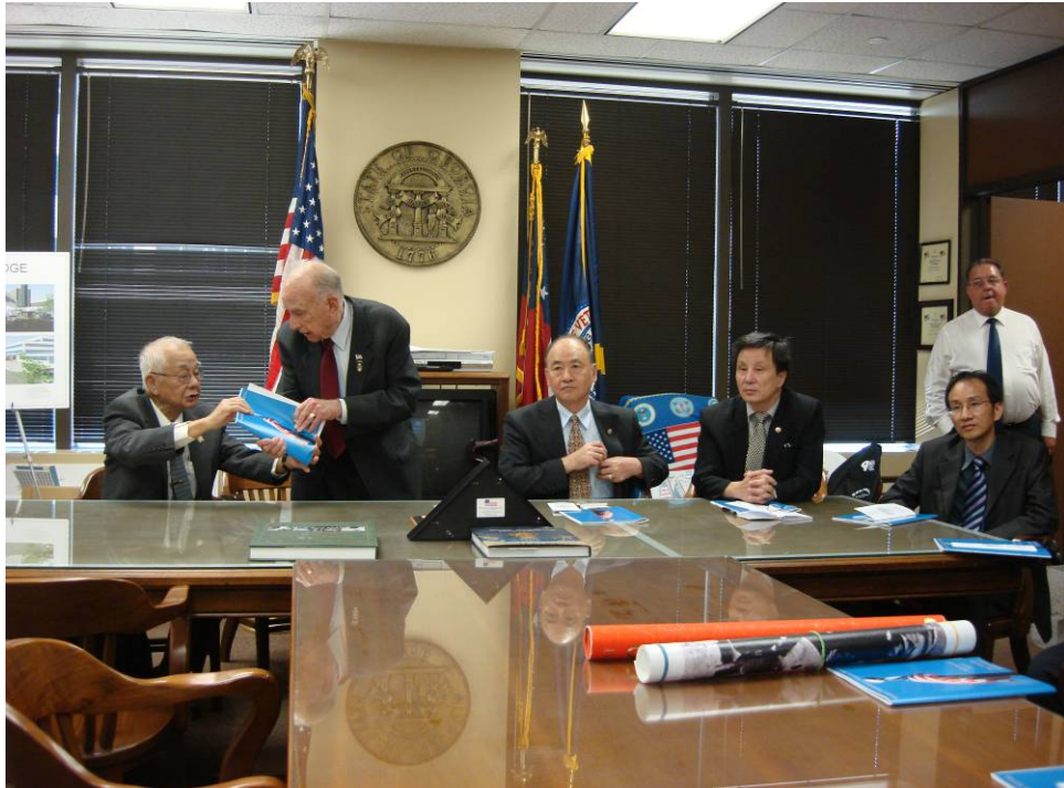
附圖 29：美國喬治亞州退伍軍人事務處惠勒處長（Gen. Wheeler）向曾主任委員一行簡報該處工作概況