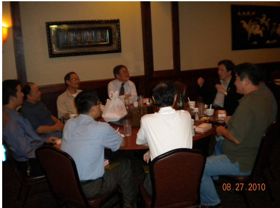
附圖 43：宋處長向明尼蘇達榮光聯誼會理監事簡介本會工作