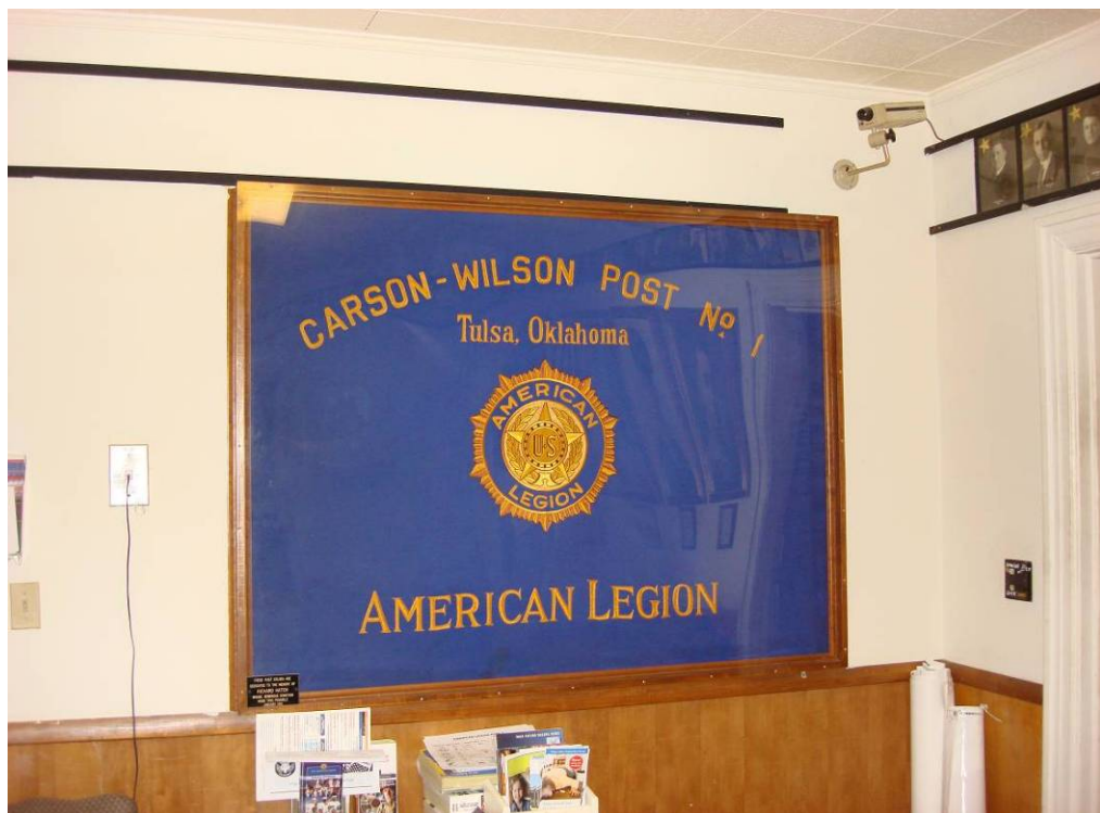
附圖 30：美國退協奧克拉荷馬州淘沙市第 1 分會