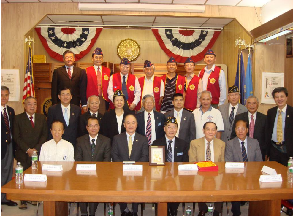
附圖 33：曾主任委員、紐約榮光聯誼會理監事與美國退協紐約市華裔分會主要幹部等合影